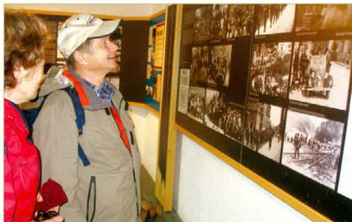
Ogledovanje starih fotografij v muzeju na Osankarici