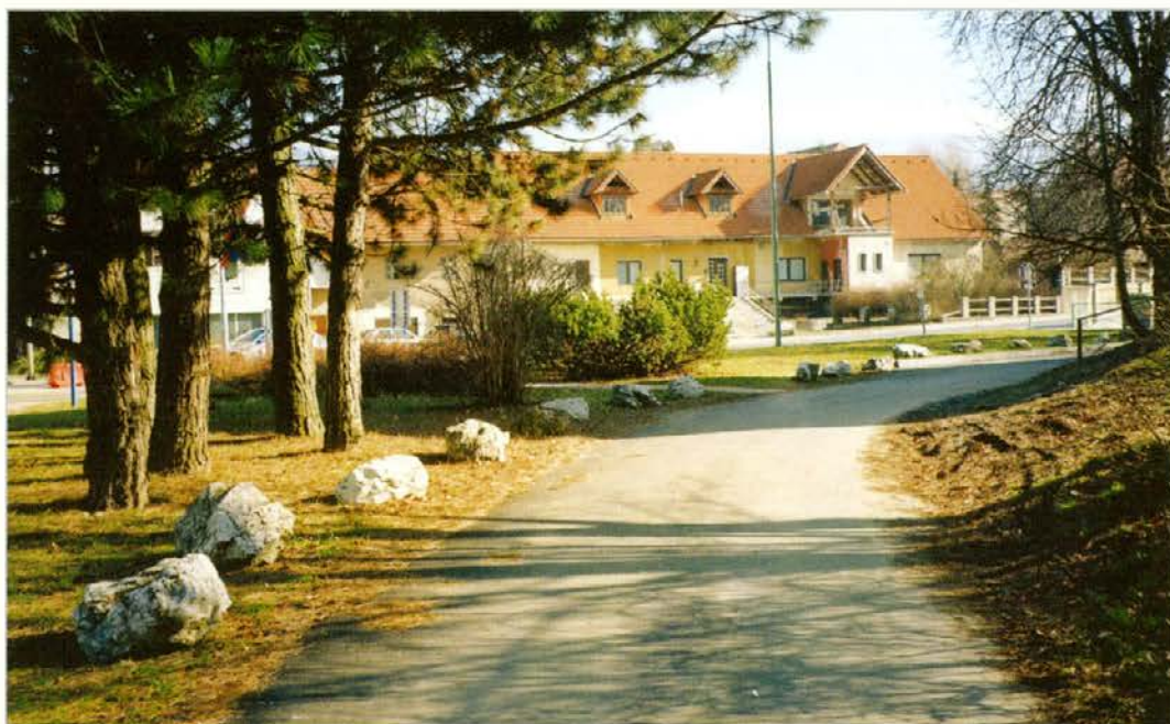
Da kamni resnično varujejo zelenice, lepo vidimo na sliki, če primerjamo levo in desno stran ob cesti.