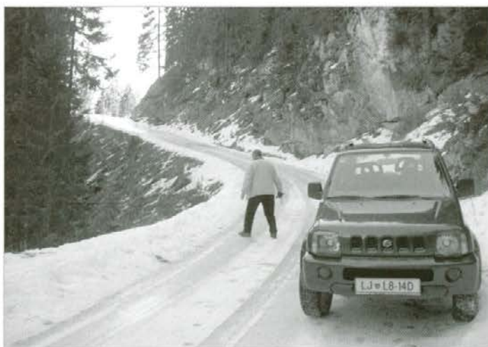
Poledeneli odsek gozdne ceste na Peco (24.1.2008)

je večjemu številu podlubnikov, zato lastnike gozdov in koncesionarje - izvajalce del v državnih gozdovih - opozarjamo, da pravočasno posekajo in spravijo iz gozda poškodovana drevesa, ki so jih označili revirni gozdarji in za posek izdali odločbo C. S pravočasnim posekom in ureditvijo vetroloma boste preprečili prekomerno razmnožitev velikega in malega smrekovega lubadarja (podlubnika) in veliko škodo v vašem gozdu. V za razvoj primernih klimatskih pogojih podlubnikov (neka-jurna dnevna temperatura okoli 16° C, suša) lahko ena sama poškodovana in slabo vitalna smreka privabi številne podlubnike, ki lahko