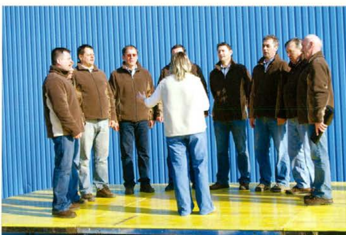
Nastop gozdarskega pevskega zbora Stezice