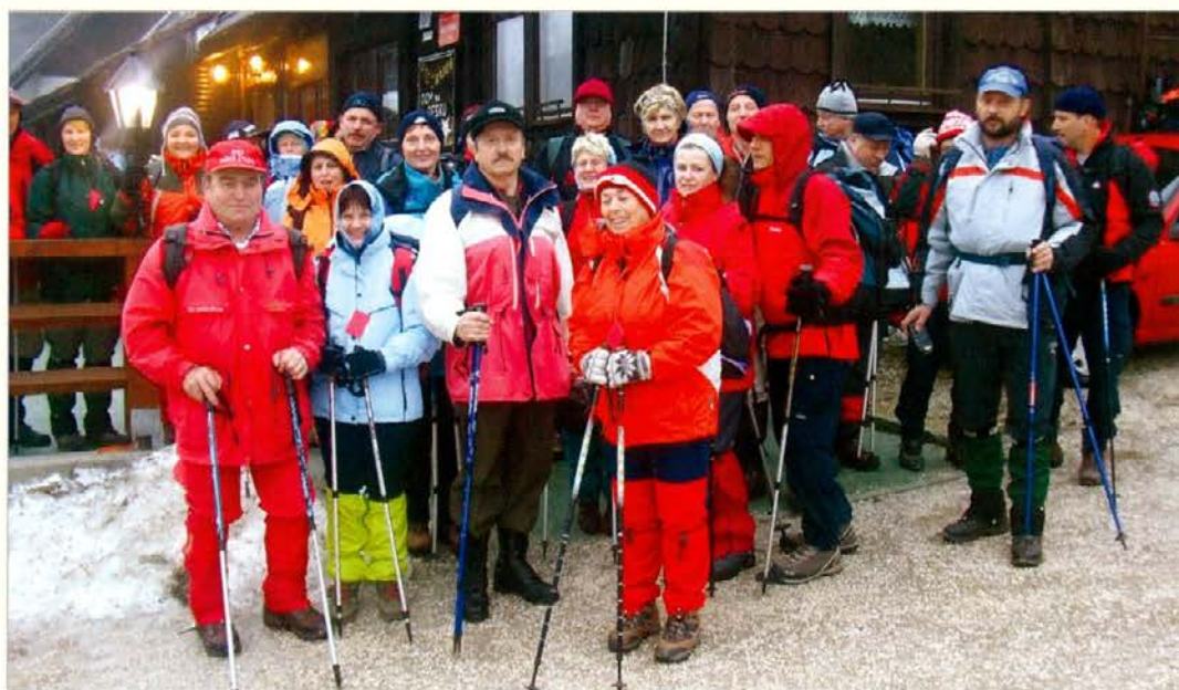
Del naše skupine pohodnikov pred kočjo na Pesku

Na zasneženi, večkrat tudi od odjuge razmočeni gazi, nas je med potjo pričakalo boljše vreme. Proti Osankarici je nekajkrat izza oblakov celo pokukalo sonce, dobre volje pa vseeno na vsej poti ni manjkalo. Pri spomeniku padlim borcem smo zapeli nekaj pesmi, ponovno pa smo položili tudi spominski venec, ki ga je delegacija občine Mislinja na proslavi že teden dni prej položila pred granitno spominsko ploščo. Res lepo, da se je tudi naša občina po dolgih letih ponovno spomnila na to, da sta med borci Pohorskega bataljona padla tudi dva naša rojaka in na ta način na