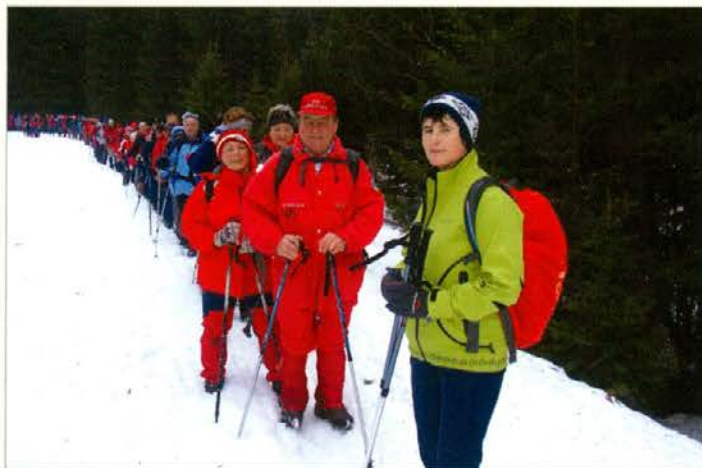
Kolona pohodnikov je bila kar dolga.