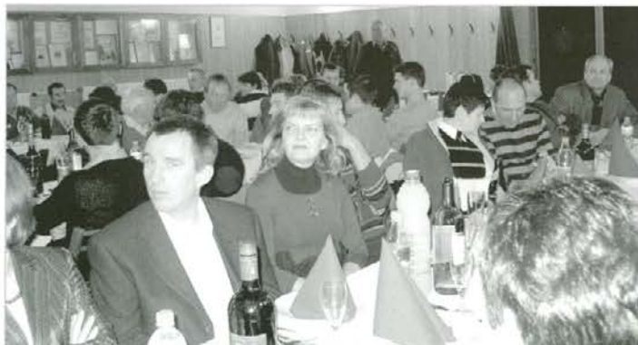
Proizvajalci mleka so tudi tokrat napolnili podgorski kulturni dom.