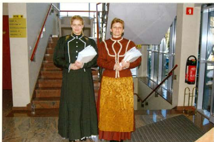
Hostesi sta skrbeli za goste in delili kataloge.