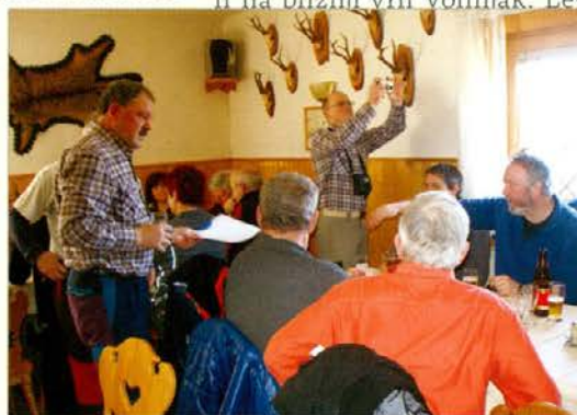
V lovski koči je bilo prijetno.