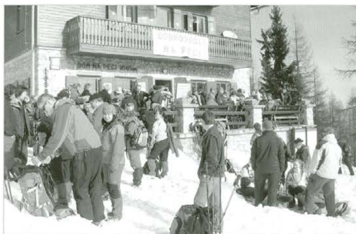
Pri koči na Peci se je zgrinjala množica planincev.

veduje še posebej množično srečanje, saj se bodo ob tej priložnosti na Peci srečali planinci iz slovenskega in avstrijskega dela Koroške. Tako naj bi na simboličen način pokazali, da je zaradi vstopa Slovenije v Evropsko unijo odpadla meja, ki je dolga leta ločevala Slovence na tej in drugi strani meje.