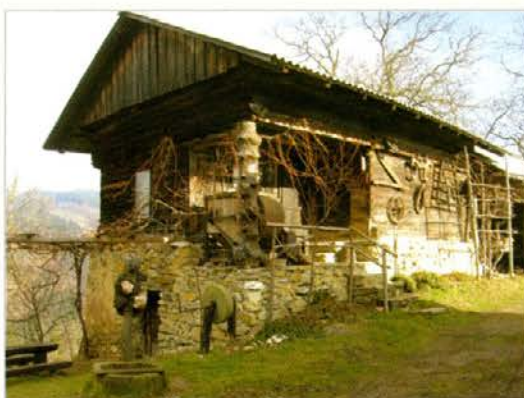
Kašča, v kateri je etnografska zbirka.