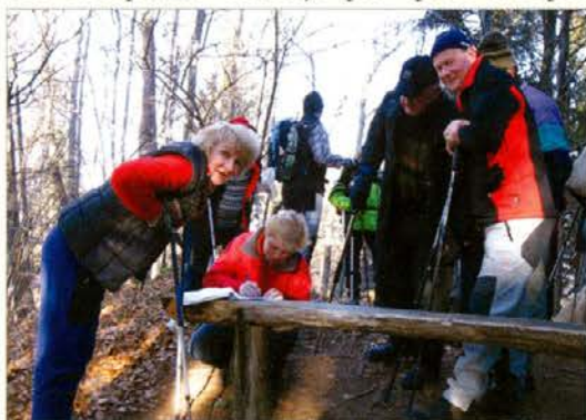
Vpisovanje pohodnikov na Črepiču