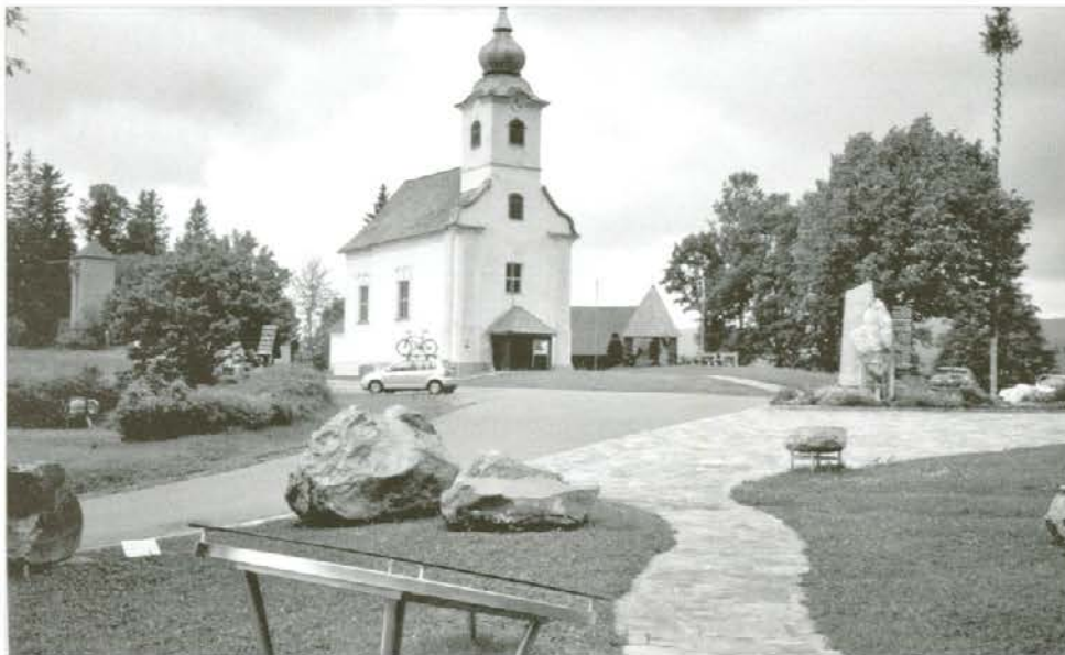
V Glashütten, majhni vasici pod Golico – Koralpe –, so z razstavo mineralov okrasili središče vasi.

ugledni gostje iz pobratenih mest sadijo drevesa, bi bilo kamnom primerno dati še drugo vsebino. V Mislinjski dolini in hribih nad njo bi poiskali različne kamne primernih velikosti in oblik, jih opremili z napisi, da bi se vedelo, kaj so, in jih postavili med obstoječe kamne. Šolarji in starejši bi se mimogrede poučili nekaj o kameninah, kamni bi varovali zelenice, ugledni gostje pa bi bili tudi zadovoljni, ko bi videli, v kakšnem kulturnem kraju