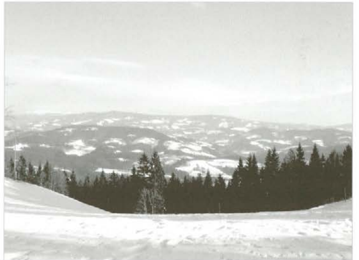
Pogled iz revirja Sele (Lesnik pod Blatnico) na revir Pameč

Prisotnost ekološko najbolj vplivnih živalskih vrst, sku-paj s posledicami dejavnosti človeka, pomembno vpliva na procese razvoja gozdne vege-tacije. Gostota poseljenosti in sodobno kmetijstvo v ravnin-