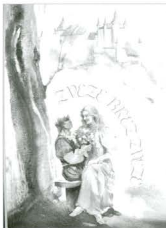
Naslovna stran knjige Zveze brez zveze

dušo in razum. Predstavitve je bila spontana, morda tudi ne-