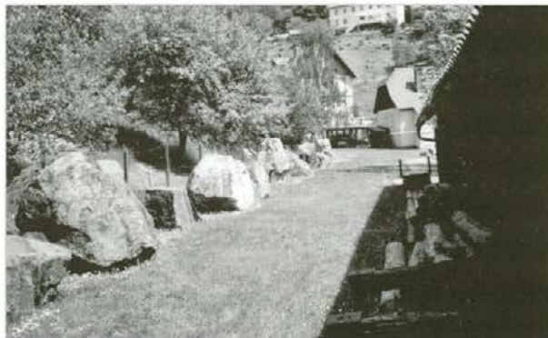
Na Knapenbergu pod Svinjško planino so predstavili svoje bogastvo mineralov (mimogrede; pravijo, da je ta predel eden najbogatejših nahajališč mineralov na svetu).

ugledni gostje iz pobratenih mest sadijo drevesa, bi bilo kamnom primerno dati še drugo vsebino. V Mislinjski dolini in hribih nad njo bi poiskali različne kamne primernih velikosti in oblik, jih opremili z napisi, da bi se vedelo, kaj so, in jih postavili med obstoječe kamne. Šolarji in starejši bi se mimogrede poučili nekaj o kameninah, kamni bi varovali zelenice, ugledni gostje pa bi bili tudi zadovoljni, ko bi videli, v kakšnem kulturnem kraju