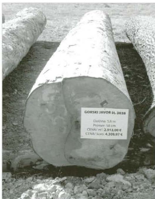
Najbolje licitiran ploč – gorski javor

Pri organizaciji licitacije je tudi letos aktivno sodeloval Zavod za gozdove Slovenije, še posebej Območna enota Slovenj Gradec. Njihovi strokovnjaki so pomagali lastnikom pri izboru in razrezu sortimentov in tudi pri odvo-