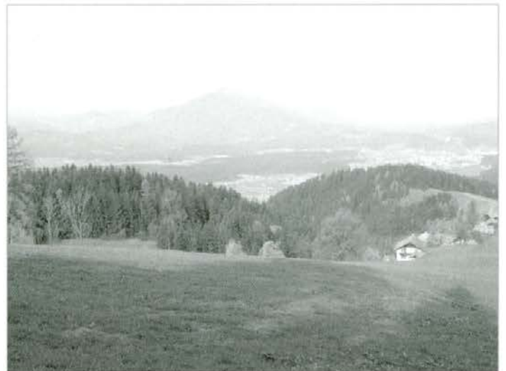
Pogled na Uršljo z Golavabuke