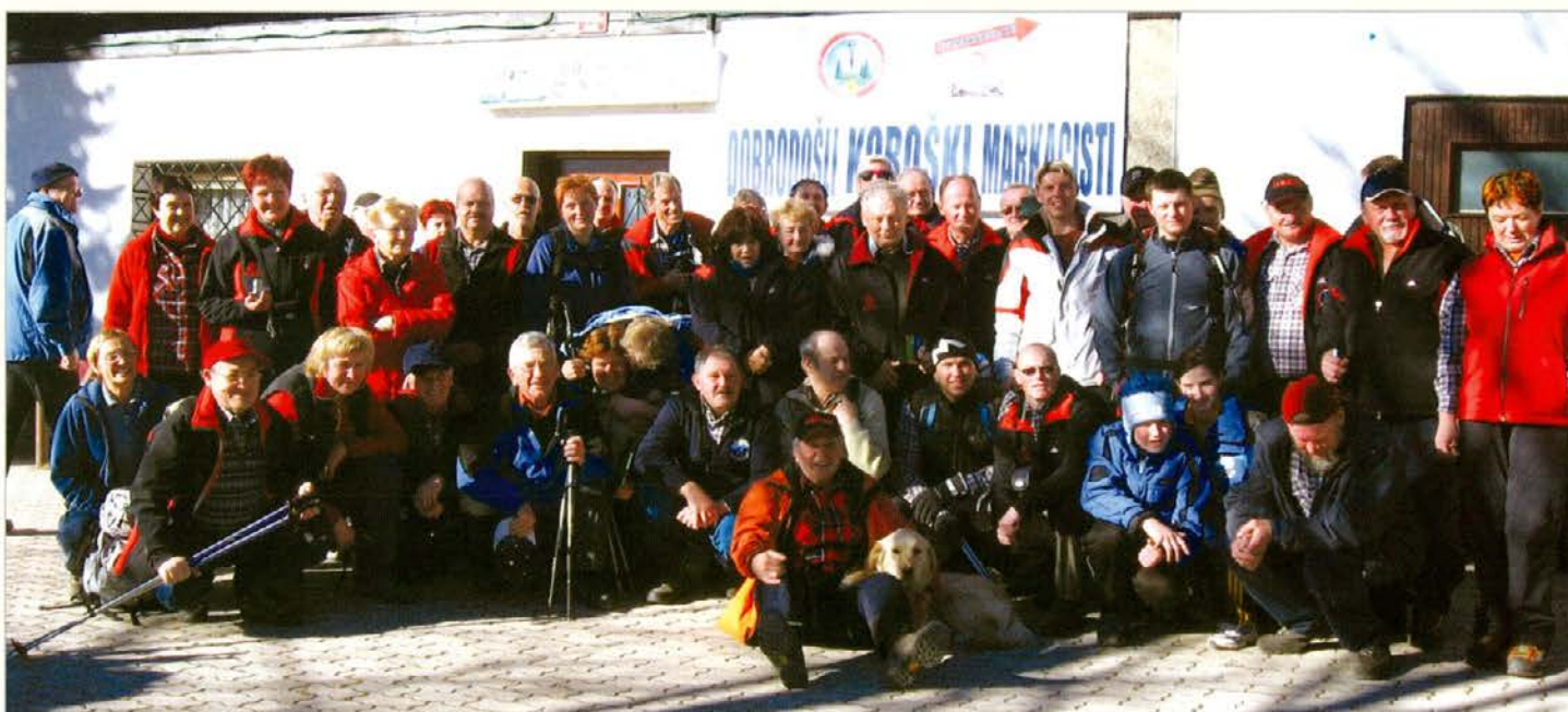
Skupinska fotografija markacistov pred lovsko kočjo