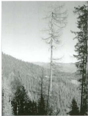
Macesen v skalni samici

V letu 2007 se je v primerjavi s prejšnjimi leti zelo povečalo število aktivnih „živih“ žarišč in s tem količina lubadark. Skupno smo v letu 2007 evidentirali 751 žariščih (611 v zasebnih gozdovih, 140 v državnih gozdovih) oz. 20 954