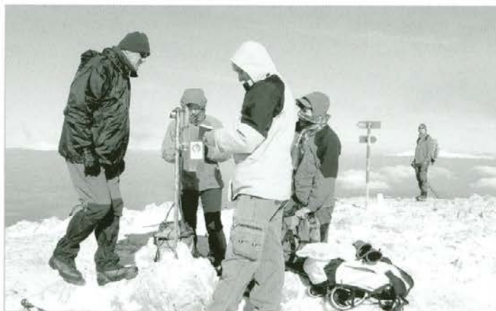
Na vrhu Pece