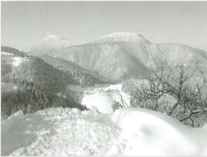
Uršlja gora od Šašla

zirani apneneci, dolomiti), v spodnjem montanskem delu prevladujejo tako imenovane soteške plasti, ki spadajo med zmerno bazične silikate. V Mislinjski dobri so peščene glinice, ob vodotokih pa mlajše aluvialne usedline (terasne tvorbe), ki jih prav tako prištevamo med zmerno bazične silikate. V SV delu enote (Vrhe, del Sel) prevladujejo kisle filitoidne silikatne kamnine (pretežno črn in zelenkast filitoiden skriljavec in filitoiden gnajs).