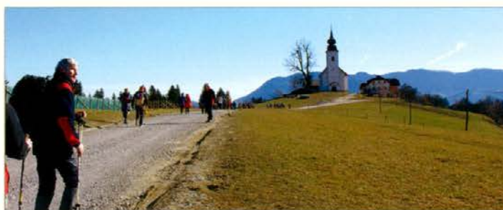
Na poti proti cerkvi sv. Rupreta v Završah