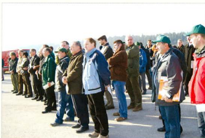
Povabljeni na sklepni prireditvi licitacije