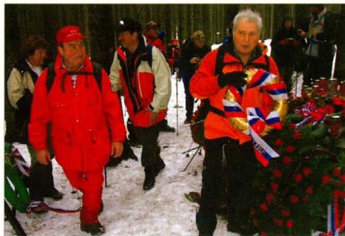
Znova smo položili venec in se spomnili tragičnega dogodka.