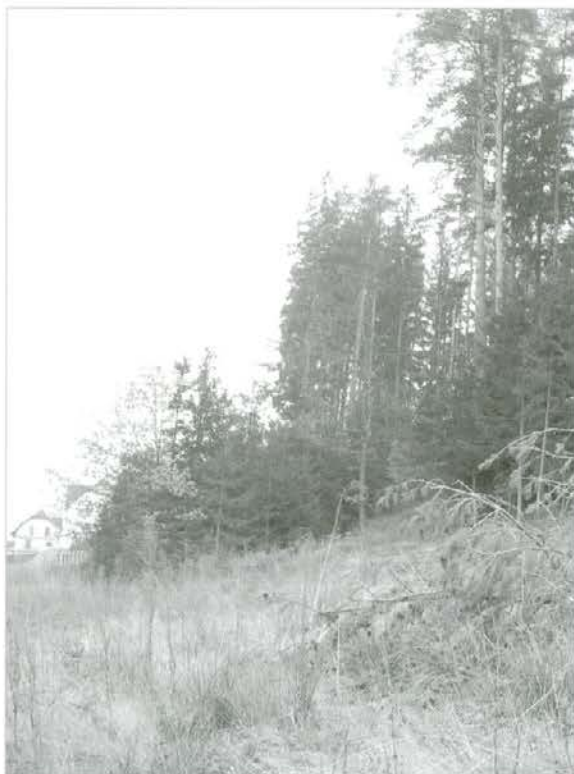
Krčitev gozda za urbane namene

Lastnik površine je dolžen zagotoviti, da se sprememba namenske rabe zemljišča izvede ob prvi spremembi oziroma dopolnitvi prostorskih aktov lokalne skupnosti .