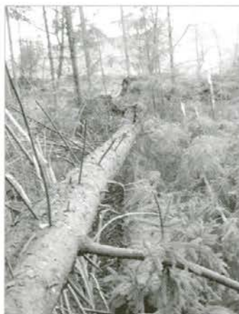
Po vetru podrti smreki v Navrškem vrhu

vesa in manjše šope dreves predvsem v slovenjgraški občini (500 m 3 ). V Mežiški dolini smo gozdarji evidentirali manjše vetrolome predvsem v spodnjem delu doline (v občinah Ravne na Koroškem - Navrški vrh, Prevalje - Kot in