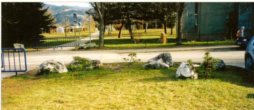
Že malo zelenja poživi in polepša okolje kamnov.