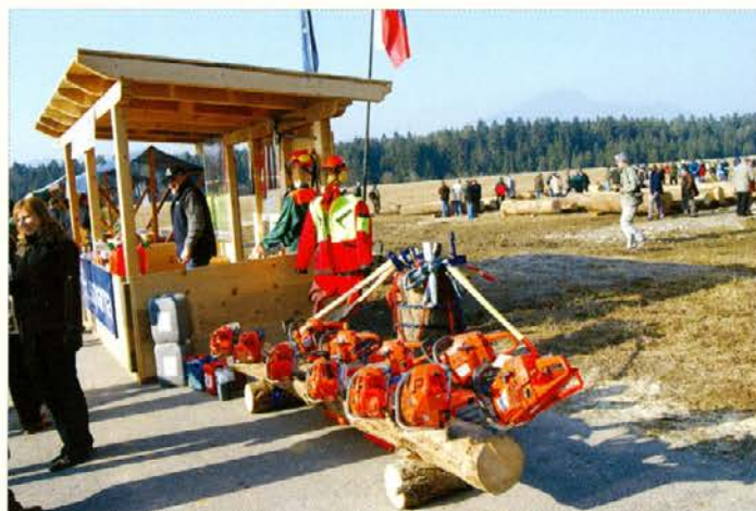
Trgovina Les je predstavila svoj prodajni program.