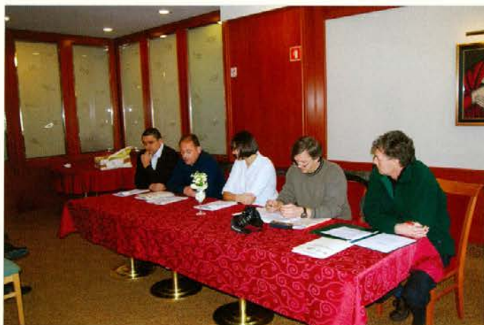
Predstavniki organizatorjev licitacije na novinarski konferenci

imeli pri urejanju licitacijskega prostora, ki je bil ravno v tem času zelo razmočen zaradi slabega vremena. Za udritev tal so porabili ca 350 m 3 gramoz.