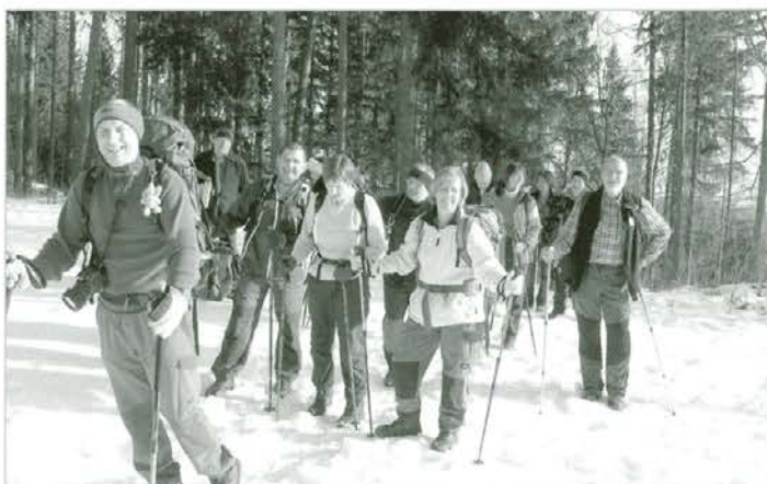
Pohodniki PD Dolga pot iz Dravograda