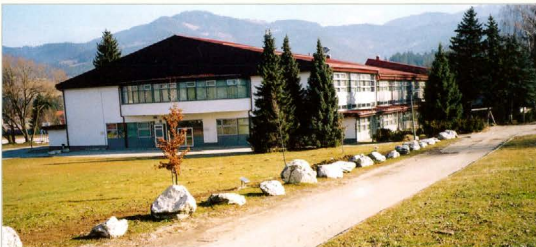
»Kamnored« in »ugledna« drevesa pred Prvo osnovno šolo v Slovenj Gradcu. Če bi nekaj kamnov-varuhov zamenjali s kamni-učiteljji, bi se namen in vsebina »kamnoreda« močno požlahtnila.