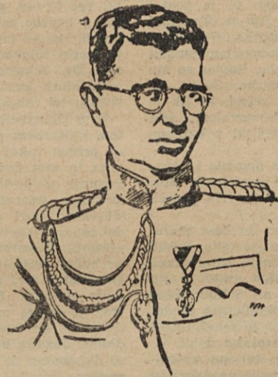
Vodja jugoslovanskih četnikov Draža Mihajlović

La pesada cabeza se deslizó de su mano al lecho, en ella bullían oscuros pensamientos sobre el porvenir.