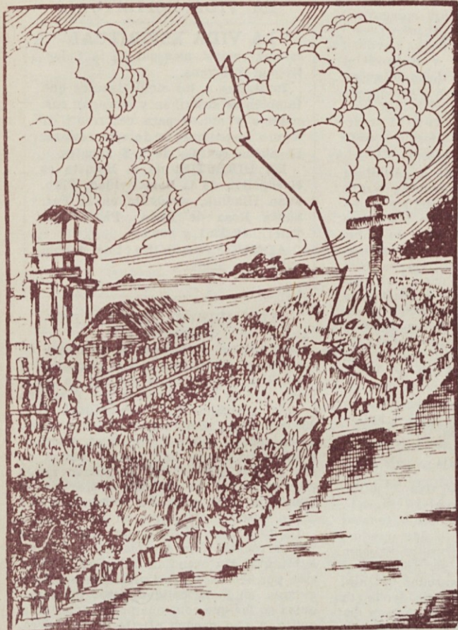
Esta reseña histórica dedico a mis amigos de Corrientes.

La Ciudad de Corrientes fué fundada por el Adelantado Juan de Torres de Vera y Aragón, el 3 de Abril de 1588.