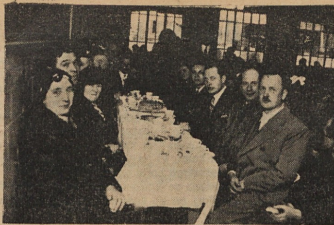
Nekaj obrazov z čajanke na Cirilovo nedeljo na Paternalu