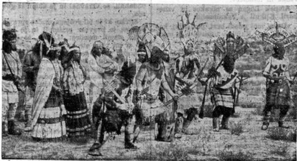
Bojni ples Indijancev, ki jih je podžigal k borbenosti

Toda preden se je ozrla po sovražniku, ki ji je ranil otroka, je že stal Logan za njo. Svojo puško je bil stis-