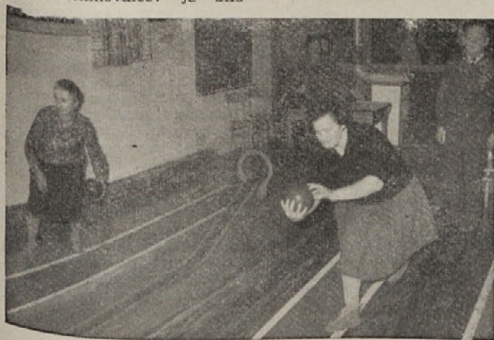
Med tekmovanjem upokojenk in upokojencev

V kratkem nameravajo pripadniki JLA iz Ribnice in predstavniki občinskega komiteja izdelati še nadaljnji program skupnih prireditev in srečanj.