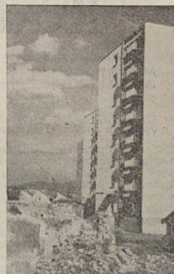
KOČEVJE — staro se umika novemu

Volilne enote za zbor delovnih skupnosti ne objavljamo, ker so vsem delovnim organizacijam že znane.