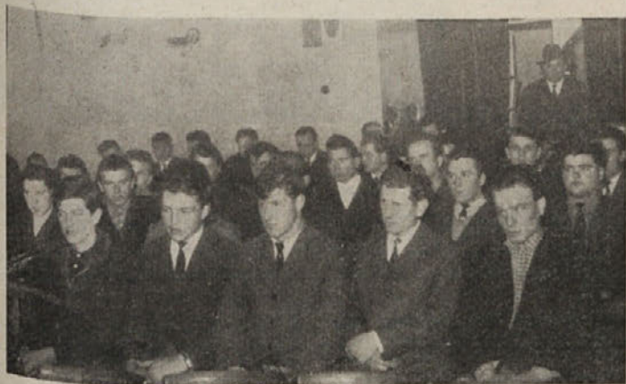
Člani Avto-moto društva Kočevje na občnem zboru.