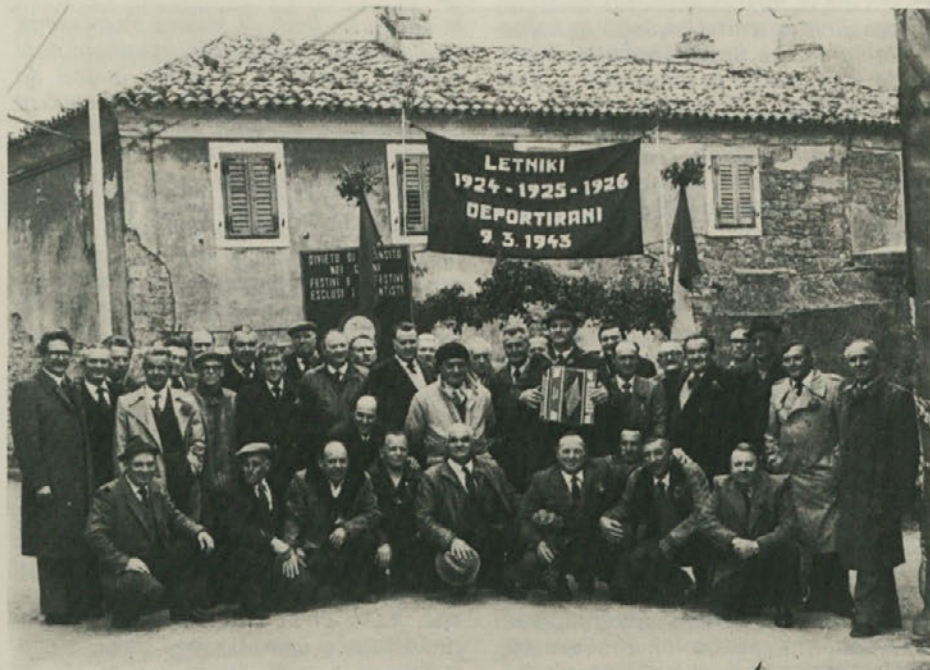
Deportiranci iz dolinske občine so se srečali v sredo, 9. marca v Boljuncu

Ob 9. obletnici smrti moža in očeta je prispevala Vera Kral z otroci 15.000 lir.