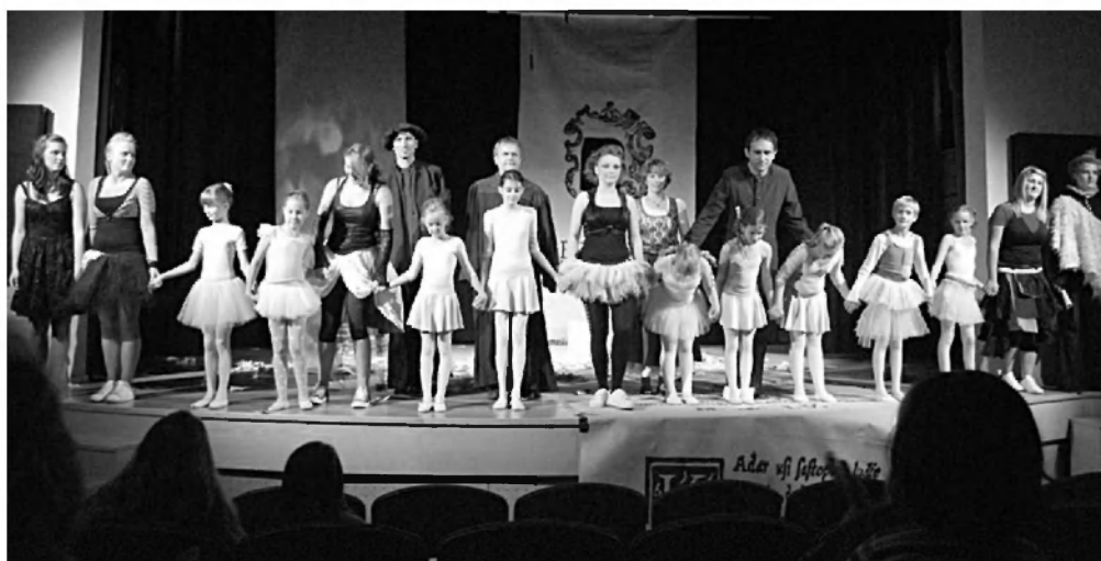
Priklon igralske in baletne skupine ob koncu predstave v Jakličevem domu.

Besedilo: Ana Porenta