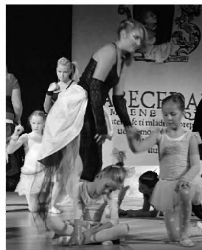
Ti mladi inu preprosti deklički se brati inu pisati učijo.