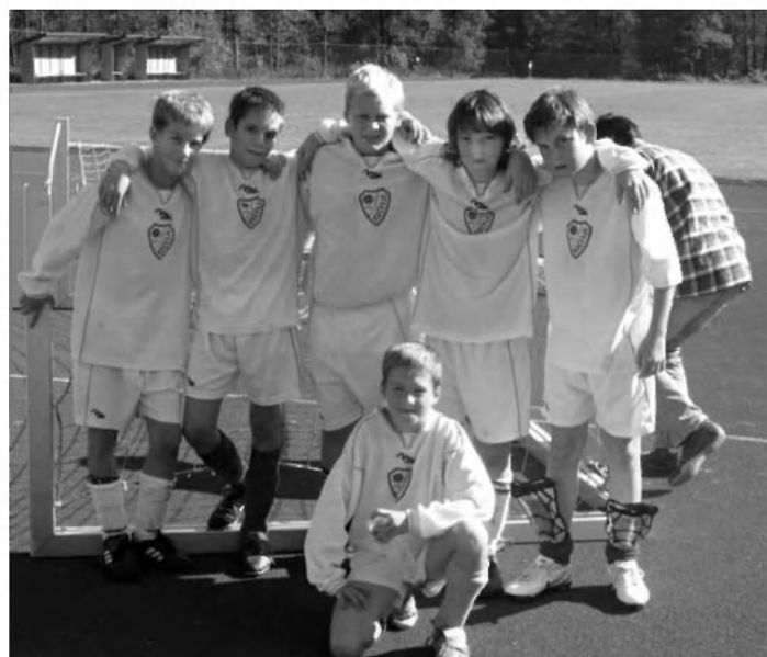
SKUPINA U-12 , TEKMUJE LETOS Z NK KOČEVJE

Termini vadbe*: torek 17:00–18:00, sreda 18:30–19:30, četrtek 16:00–17:00.