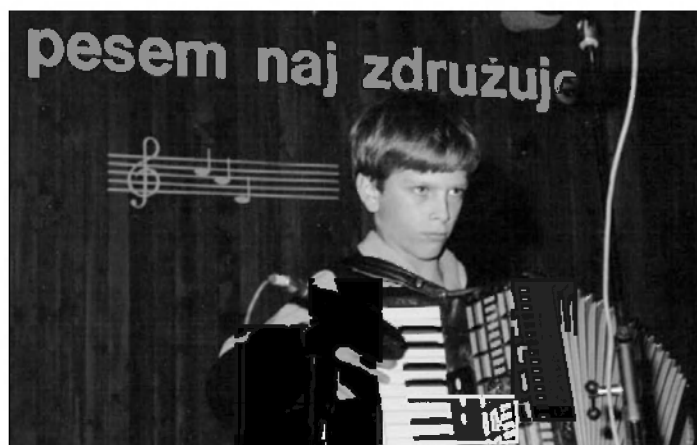
Na srečanju harmonikarjev 1990 je nastopil tudi tale fantič. Ali ga prepoznate? Pravične odgovore pošljite s pripisanim vašim naslovom na: kud.marijkogoj@gmail.com.