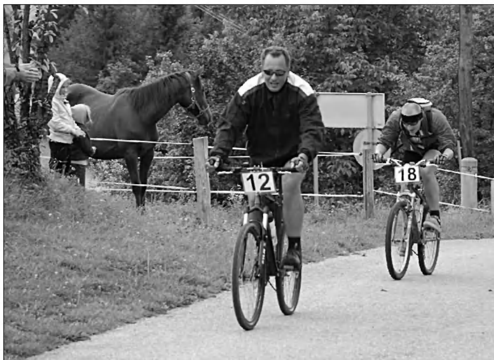
Brez popuščanja do konca