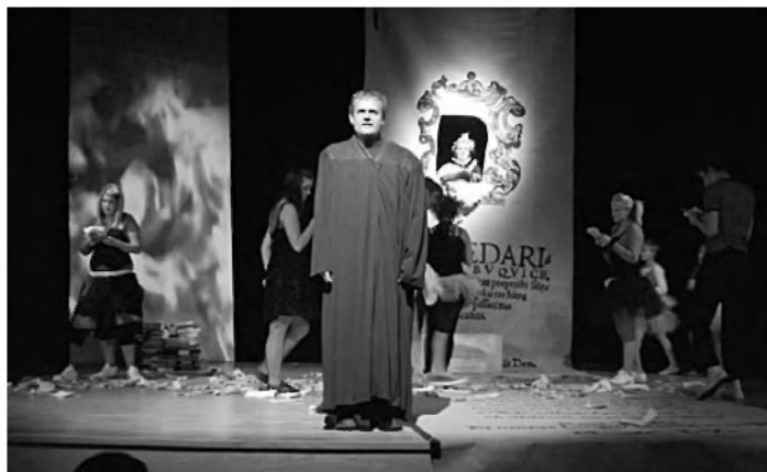
Sklepni prizor predstave. Slovenska beseda bo po Trubarjevi zaslugi preživela.