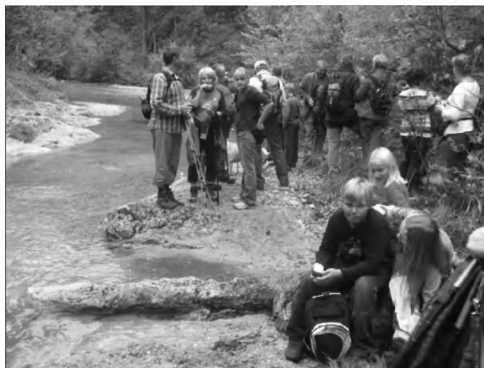
Pohodniki na stičišču. Prija malica, saj nas čaka še pot v Krvavo Peč.