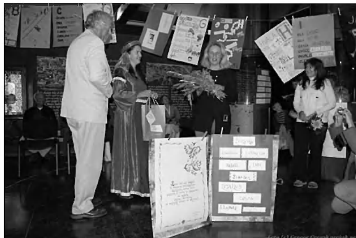
Zahvale in prijazno slovo ob knjigi velikanki.

Polni lepih vtisov smo se udeležili tudi uradne otvoritve Dnevov evropske kulturne dediščine. Po njej so mladi ustvarjal-