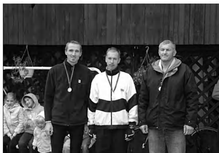
Najhitrejši od 40 do 60 let