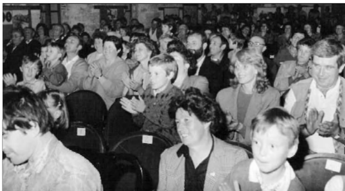
Zadovoljni obiskovalci 23. junija 1990 v viteški dvorani na gradu Turjak

Letos bo to srečanje organizirano petnajstič, kajti treh srečanj ni bilo zaradi objektivnih razlogov. Že na lanskem srečanju se je predstavilo 22 harmonikarjev iz 10 občin, letos pa bo nastopajočih še več, seveda v okviru možnega. Z organizacijo vseh dosedanjih harmonikarskih srečanj smo nastopajočim načrtno dvigovali pogum in samozavest, s tem pa ohranjali identiteto. KUD Marij Kogoj je med drugim zelo ponosen na to dejavnost, ker lahko »mobilizira« kvalitete harmonikarje za vsako priložnost ob vsakem času, če je to objektivno možno. Takšni lahko nastopimo v kulturnih programih prireditvev, ki jih organizirajo druga društva.