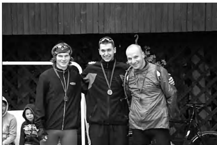
Najhitrejši do 40 let