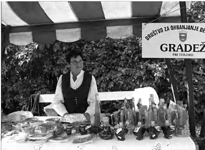
Dejavnost društva za ohranjanje dediščine iz Gradeža