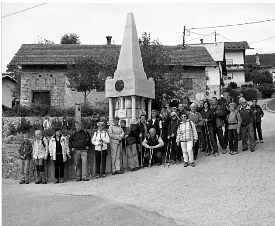
Pred Trubarjevim spomenikom na vasi Rašica