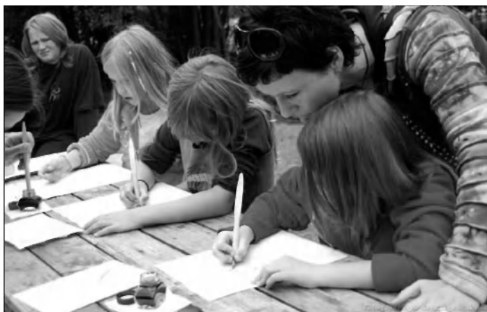
Mladi grajski pisarji pri delu.

Dogajanje na Trubarjevi domačiji se je začelo ob enih, ko so se začele različne delavnice za otroke. Otroci so lahko obiskali Hišo abecednico in kaligrafsko delavnico Grajski pisar, ki ju je pripravil ZRU, lesene igrače pa so lahko sestavljali pri Lojzetu Severju. Vodnik Andrej Perhaj je v spominski sobi predstavil Trubarja in njegov čas, nato je sledil Sprehod po Trubarjevi Rašici z ogledom lokalnih znamenitosti pod vodstvom Boža Zalarja.