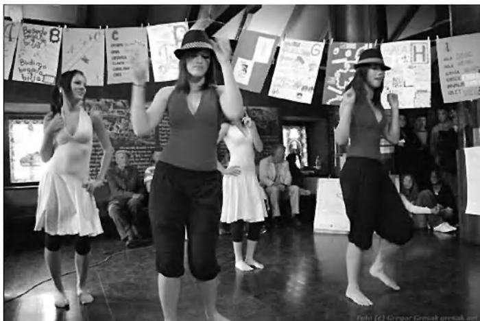
Nastop plesne skupine Modri konj s Ptuja.