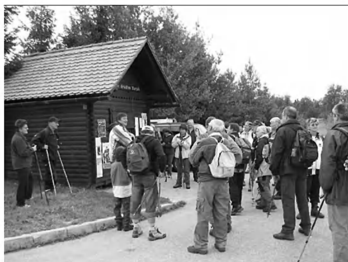
Zbirno mesto pri Domu krajanov na Turjaku

Izpred Doma krajanov na Turjaku je 50 zbranih pohodnikov krenilo na 8 km dolgo pot po rojstni fari našega velikega rojaka Primoža Trubarja. Na poti so pohodniki zaustavili korak na krajih, ki so tesno povezani s Trubarjevim življenjem, in prisluhnili lokalnim vodnikom, ki so udeležence popeljali skozi njegovo življenje. Na poti so si v Turjaškem gradu ogledali razstavo Trubar in Turjaški, poročno dvorano, turško ječo in Dalmatinovo kapelo, nadaljevali pot po gozdni učni poti do Trubarjeve domačije na Rašici, si tam ogledali urejeno spominsko sobo in postavljeno razstavo Primož Trubar in njegov čas. Obiskali so še podružnično cerkev Sv. Jerneja po krajšem počitku in okrepčilu pa nadaljevali do farne cerkve v Škocjanu, v kateri je bil Primož Trubar krščen.