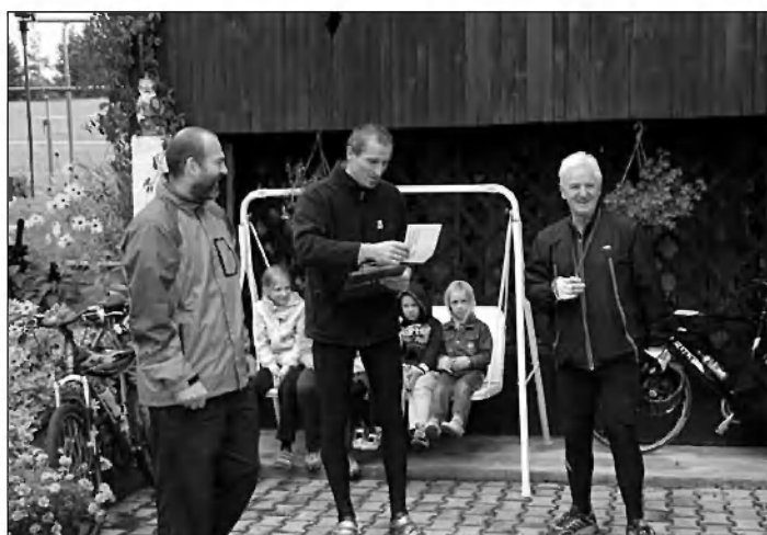
Najhitrejši v kategoriji nad 60 let