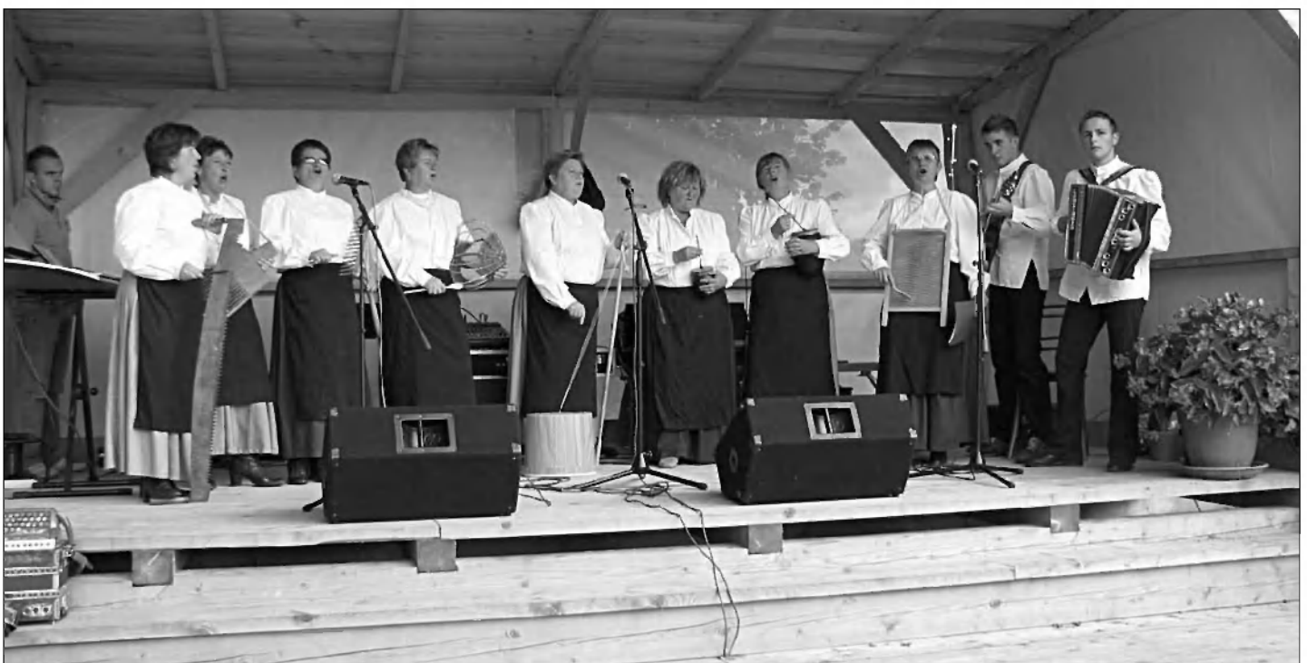
Nastop društvene skupine »Suhe češplje« iz Gradeža

Prireditelj je popestril bogat srečelov.