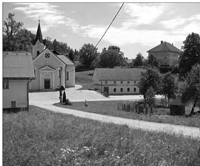
Cerkev v Škocjanu kjer je bil krščen Primož Trubar