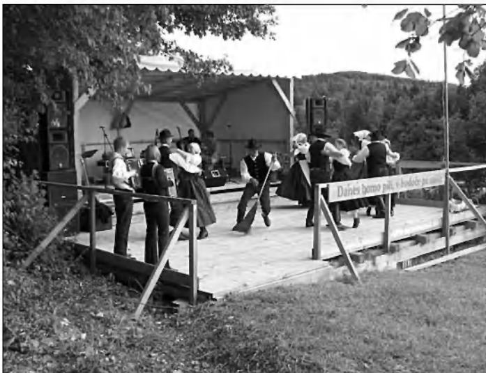
KUD Nastop članov Konjeniškega kluba in članic Društva podeželskih žena

sadja na ekološki način. Na ogled je bila tudi črna kuhinja, stara gostinska klet v starem vaškem jedru in zbirka starega kmečkega orodja, razstava lončarskih izdelkov, vezenin ... Predstavljena je bila tudi ustvarjalna delavnica »Ane Bukvice«, ki je ponazorila nastanek prve slovenske knjige. Nastopali so turjaški lokostrelci s podmladkom, z lokom v roki pa so se lahko preizkusili tudi obiskovalci.