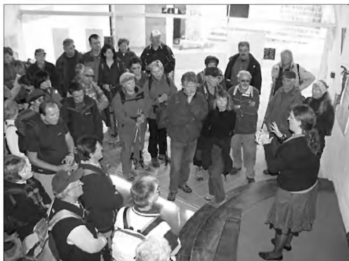
V Turjaškem gradu

Svoj pohod so zaključili pri sušilnici sadja na Gradežu in se pridružili ostalim udeležencem prireditve, ter spremljali zanimiv prikaz raznih kmečkih opravil in sušenja