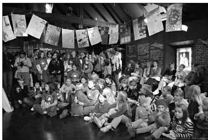
Posedli smo kar na tla v Trubarjevem muzeju.