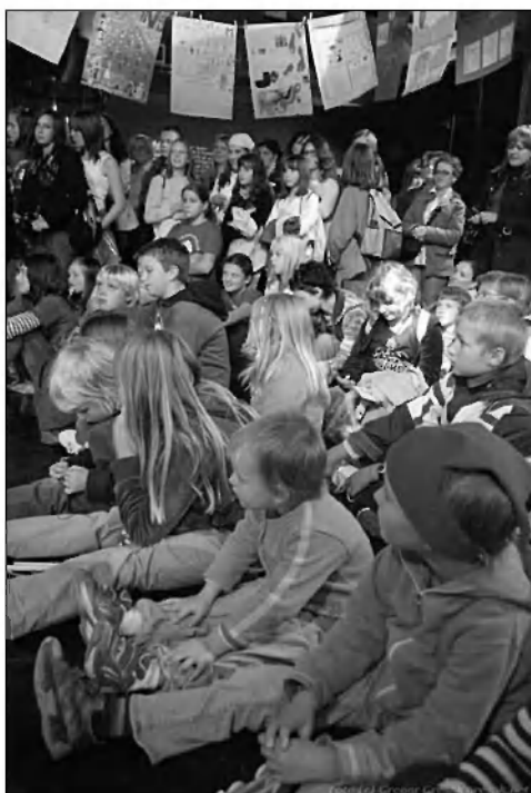
Številna publika na sestavljanju knjige velikanke.

Zavod za razvijanje ustvarjalnosti