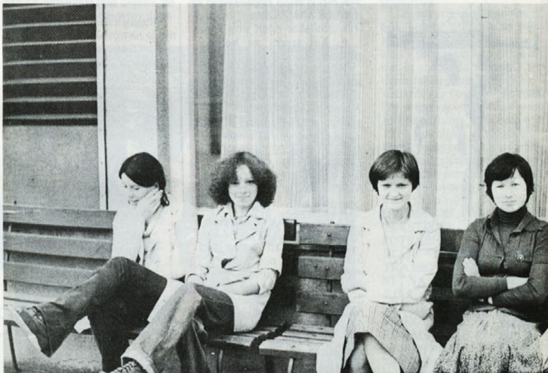
V TOZD Libna imajo že od pomladi deljeno malico. Ob devetih zjutraj imajo dvajset minut časa za topli obrok, ob pol dvanajstih pa si v kratkem odmoru, ki so mu dali ime trimček, privoščijo kavico in malo svežega zraka. Delavke so tak razpored prostega časa z veseljem sprejele.

Tudi letos je pred nami redna letna zbirka Prešernove družbe. Tokrat bomo v Prešernovem koledarju našli poleg proze in poezije sodobnih slovenskih avtorjev tudi razprave o dogajanjih po I. svetovni vojni, pa bogato informacijo o olimpiadi v Moskvi in še mnoge zanimivosti, knjigo pa bodo krasile tudi reprodukcije slik Matije Jame. Poleg koledarja je v zbirki še pet knjig – potopis, povesti, roman, zdravstveni priručnik o alergijah in en roman tujega avtorja.