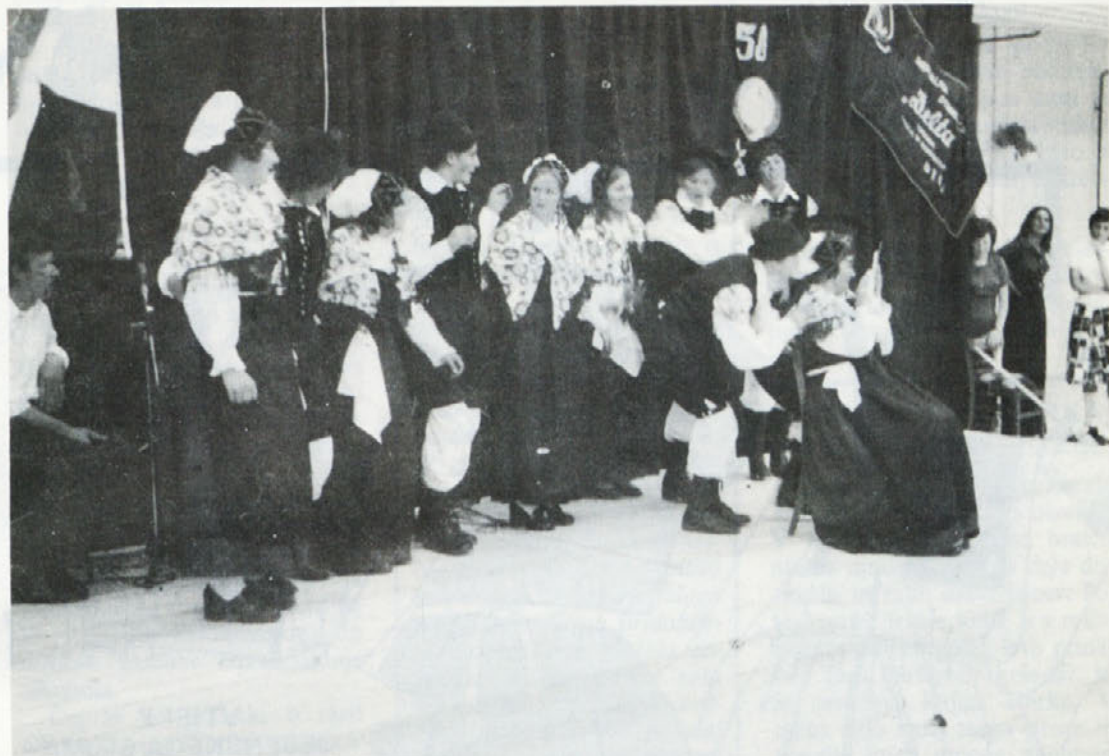
V TOZD Delta deluje že dobro upeljana folklorna skupina, ki s svojim nastopom razveseljuje in popestruje proslave v svoji temeljni organizaciji, sodeluje tudi na proslavah zunaj Laboda.

V molku je bil sram človeka, ki ne mara govoriti o svoji najgloblji ljubezni; ponos človeka, ki se ne zmeni za počestno žalitev. V nobeni drugi laži, recenzente moji, niste razodeli