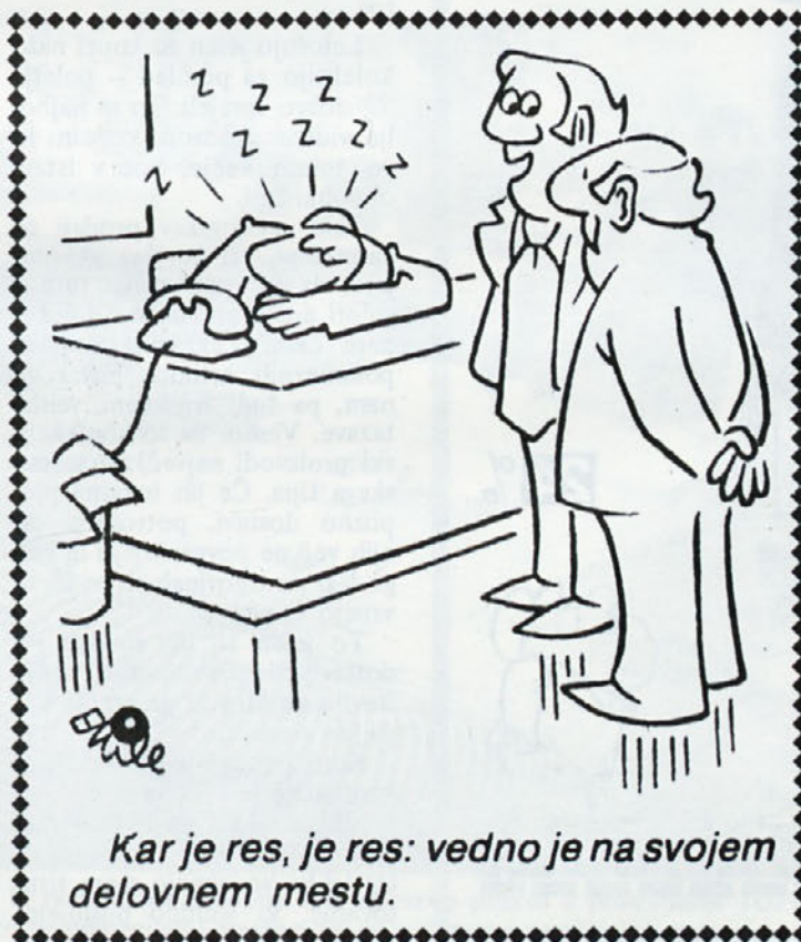
Kar je res, je res: vedno je na svojem delovnem mestu.

Na seminarjih bodo delegati dobili temeljno znanje, ki je potrebno za njihovo uspešno delovanje, saj bodo razlage povezane s prakso delegatskega delovanja. Delo na seminarjih je široko zastavljeno, uspeh seminarja pa seveda ni odvisen samo od predavateljev, ampak predvsem od prizadevnosti slušateljev.