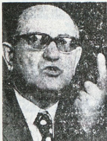
Mika Špiljak, predsednik Zveze sindikatov Jugoslavije.