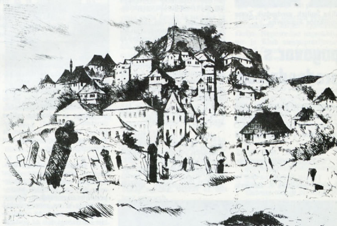
Božidar Jakac: Jajce (jedkanica, 1946)

Pred letošnjim 29. novembrom nam zato hvaležna misel še zlasti hiti k tovarišu Titu, tvorcu nove Jugoslavije. V srcih nas