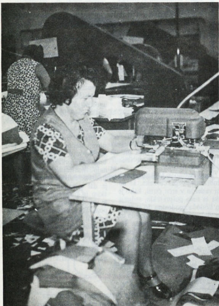
Številčenje posameznih delov za moško obleko v TOZD Temenica.