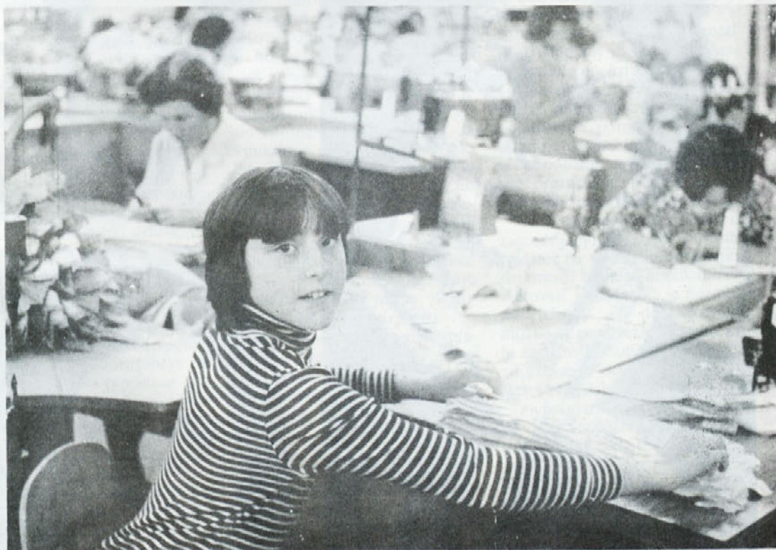
Vsako leto odpravi nekaj učenk iz novomeške posebne šole obvezno prakso v proizvodnji TOZD Ločna. Tu se srečajo z vsemi delovnimi operacijami, spoznavajo pa tudi samoupravljanje v tovarni.