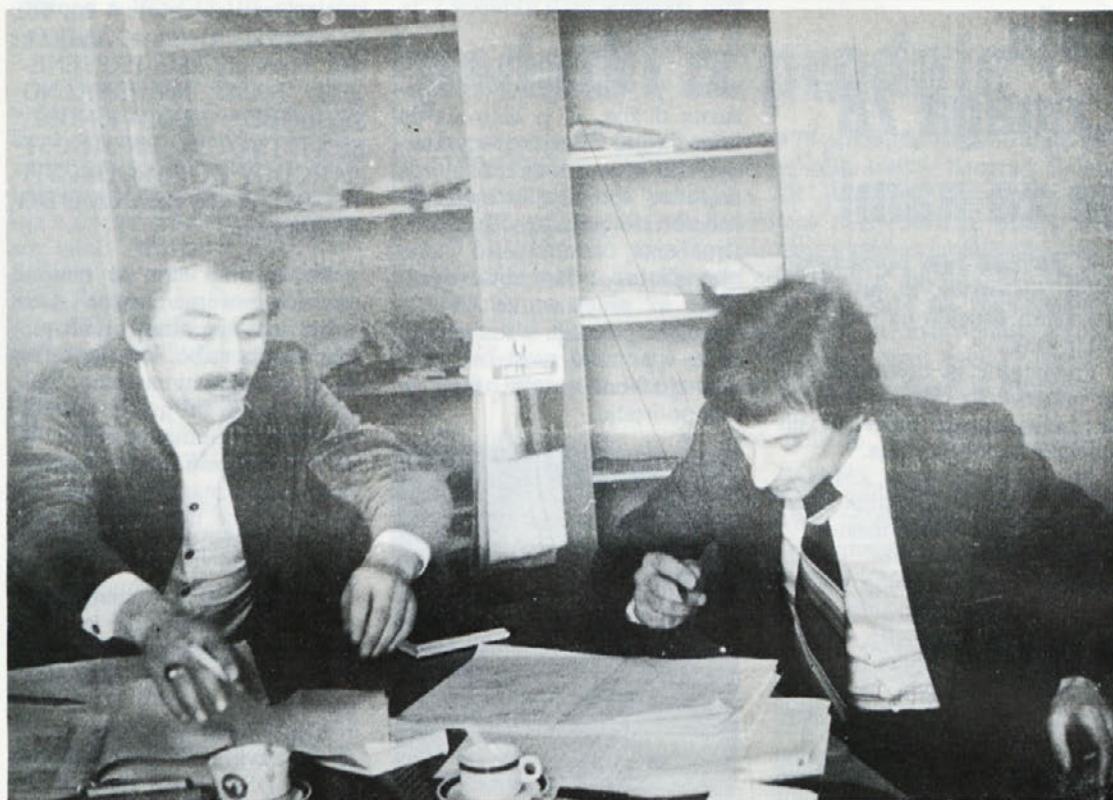
Vodja prodaje bluz in vodja nabave PŠ vsklajujeta polletni program, ki zajema vrsto izdelka, dobavitelja, surovinski sestav, ceno in dobavni rok.

Dvakrat na leto opravljamo zaključevanje kolekcij za vnaprej, za sezono jesen – zima in pomlad – poletje. Ob tej priložnosti kupci, to je trgovska mreža, sklepajo pogodbe za del njihovih potreb (od 70 do 80 odstotkov) in to za obdobje šestih mesecev. Ostalo blago kupujejo trgovine naknadno, ob naših občasnih obiskih na tere-