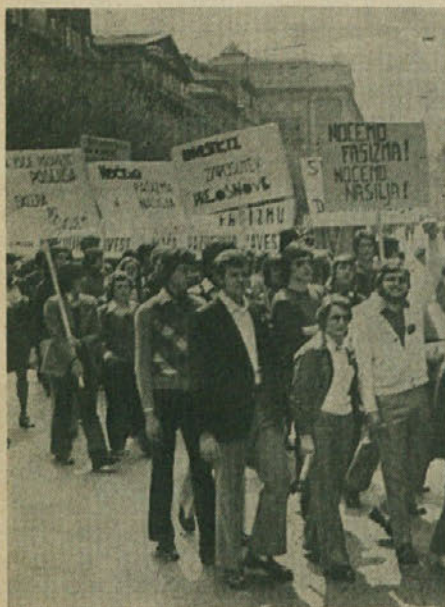
Skupina slovenskih mladincev v prvomajskem sprevodu v Trstu.

Mitja Ribičič je tudi poudaril pomen srečanja Primorcev na proslavi v Tolminu in podčrtal, da «Tolminska ni bila le srečanje nekdanjih upornih kmetov, temveč tudi središče in žarišče partizanskega gibanja na Primorskem».