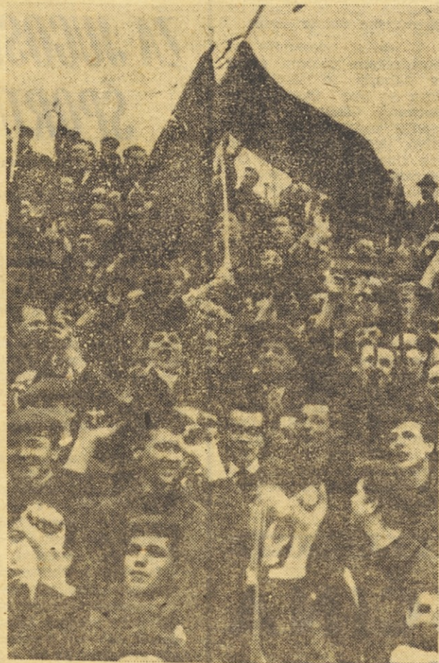
K rekordu na Centralnem stadionu v Ljubljani so prispevali tudi navijači iz Maribora.

90. min. Prekršek v korist Olimpije. More je lepo podal pred vrata Maribora, vendar je obramba gostov žogo odbila do Jovičevića, ta pa je streljal daleč čez vrata.