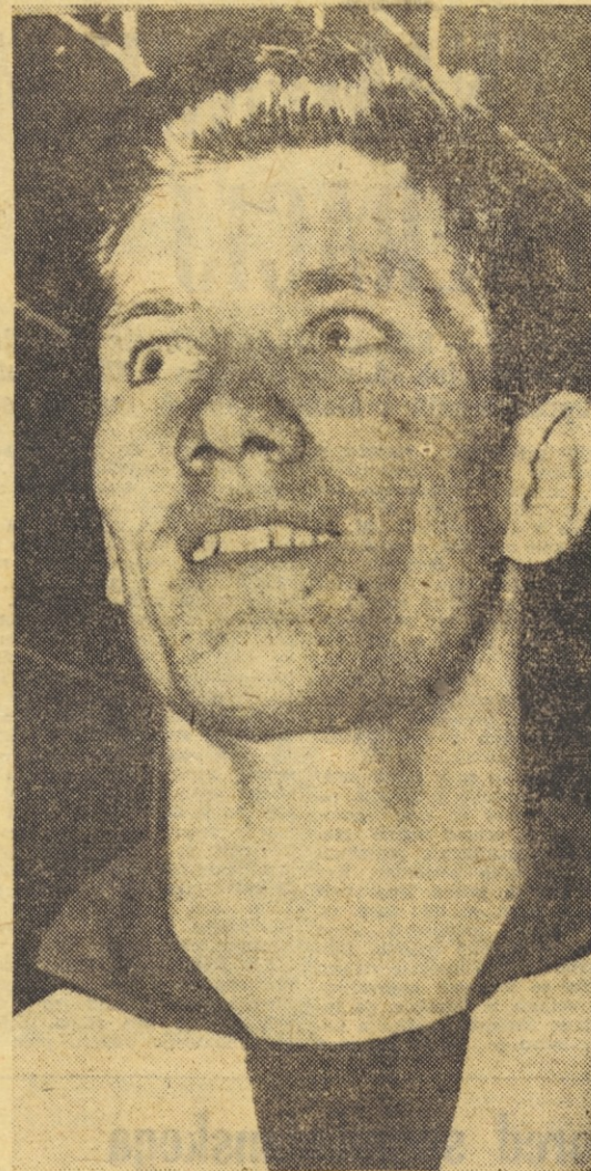
Adolf Urnaut stalni državni odbojarski reprezentant