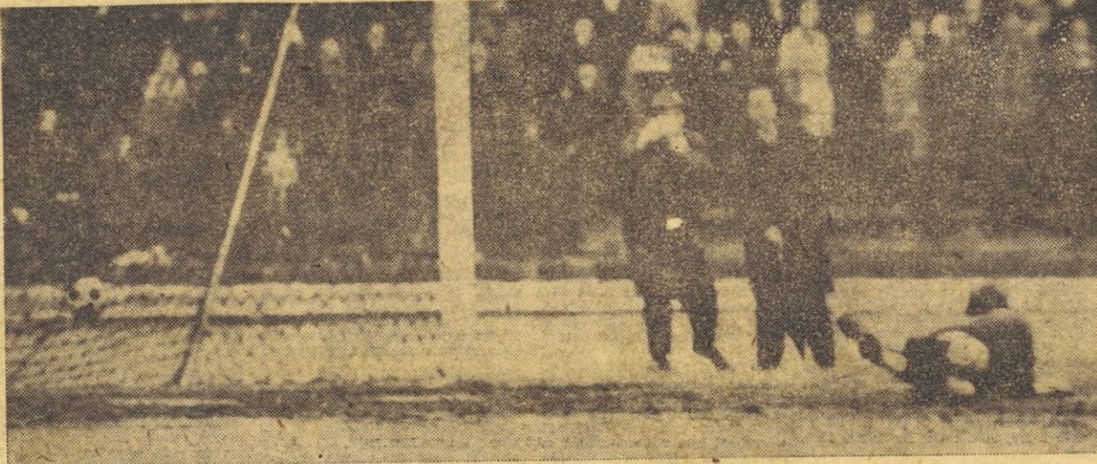
Mariborski napadalci so na današnji tekmi proti Olimpiji bili prvi, ki so preišli do zadetka.

Manila — Z vodstvom s 3:0 proti Južni Koreji se je teniška reprezentanca Filipinov že uvrstila v polfinale azijske cone Davisovega pokala.