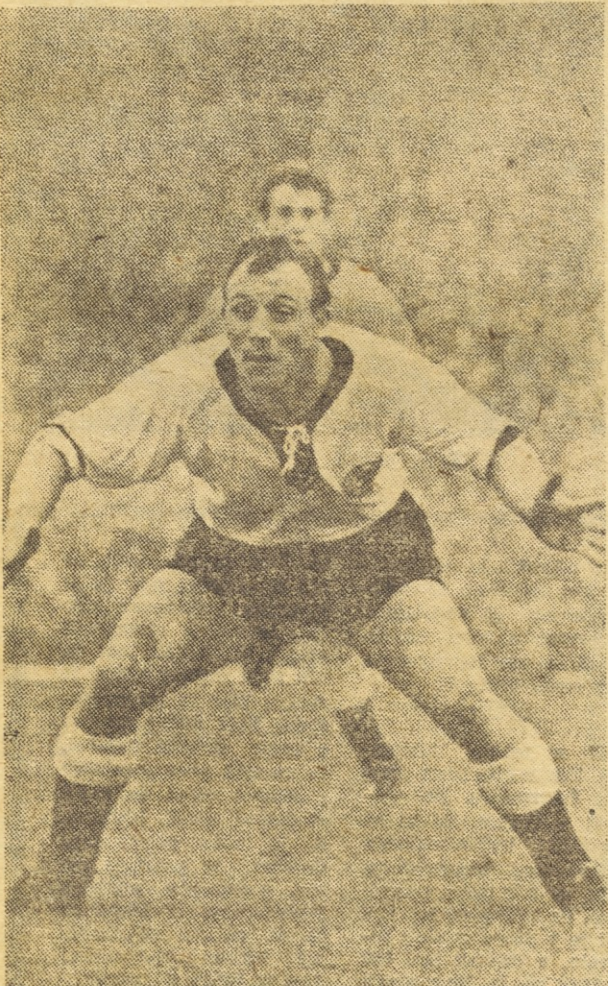
Uwe Seeler stalni član nemške nogometne reprezentance

Po velikih nesrečah v Le Mansu se je razvila v časopisju in v javnosti nasploh velika razprava za in proti avtomobilskim dirkam. Lahko si mislite kako smo se počutili na dirki za Veliko nagrado Nizozemske, ki je bila na sporedu osem dni po katastrofi. Mossov in moj Mercedes sta bila kmalu v izredno ugodnem položaju, tako da se nama ni bilo treba več bati nasprotnikov, ampak sva kar med seboj reševala in rešila vprašaje prvaka. Prav za malenkost sem bil hitrejši, tako da sem po tej dirki vodil v točkovanju za svetovno prvenstvo s 27 točkami pred Mossom, ki jih je imel šele 13.