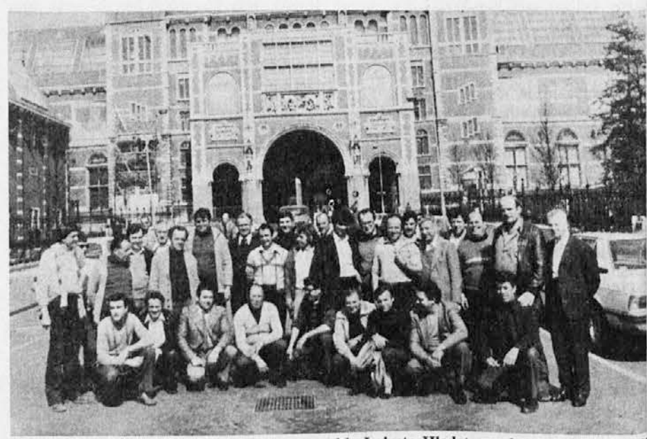
Člani moškega zbora »Mirko Filej« in ansambla Lojzeta Hledeta med turnejo po Belgiji

Rodezija je po nedavnih volitvah postala neodvisna država in se imenuje Zimbabwe. Steje okoli 7 milijonov prebivalcev. Katoličanov je nekaj manj kot 10% (654.000). Med katoličani deluje 63 domačih duhovnikov in 286 tujih. V bogoslovne msemenišču je trenutno 80 bogoslovcev. Za bogoslovje skrbijo jezuiti.