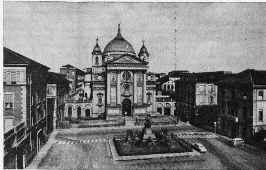
Bazilika Marije Pomočnice v Turinu