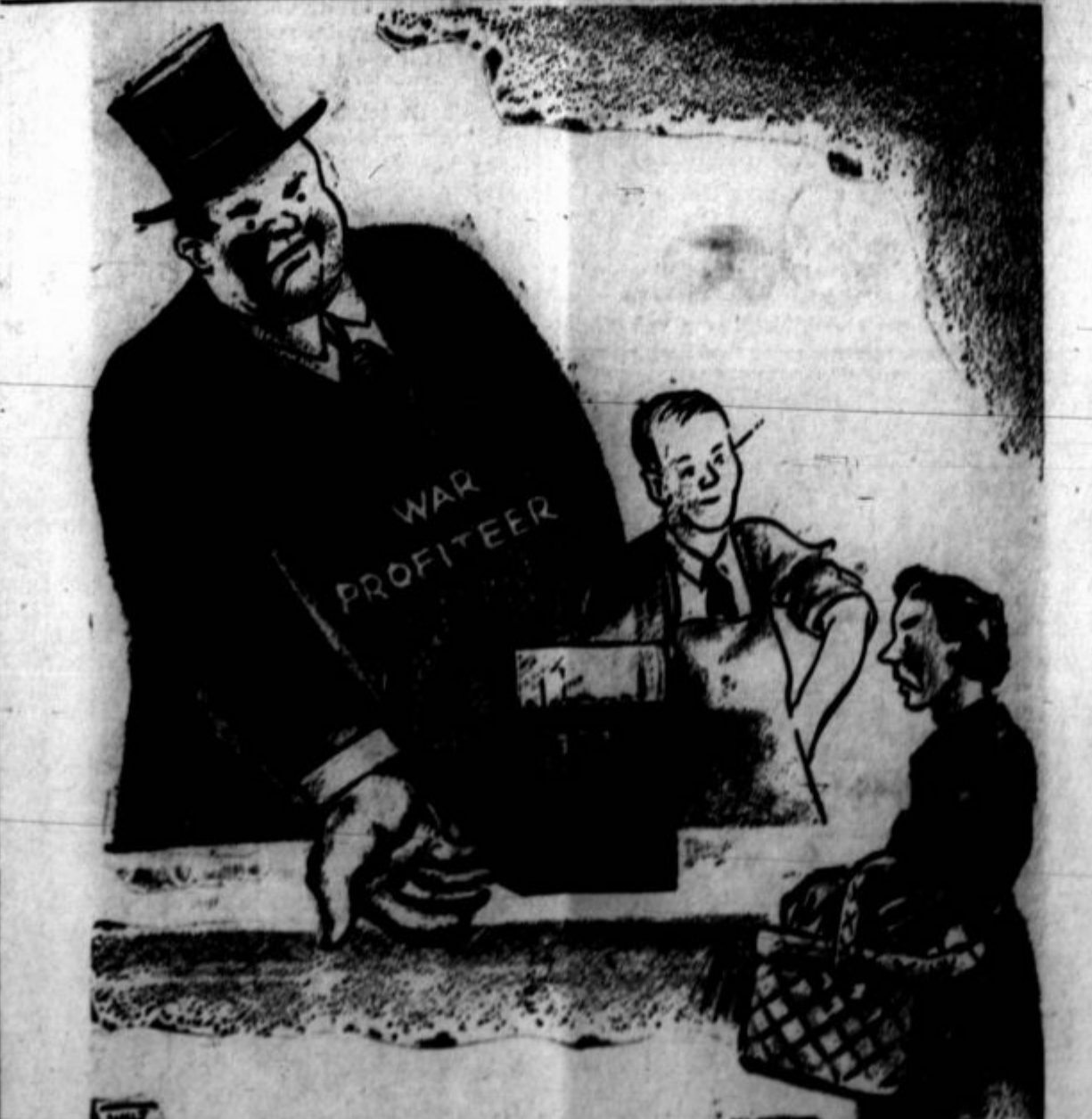
Vojni profitar zahteva plačilo.

Panama City, Panama, 2. okt. — Predstavniki ameriških republik so se končno zedinili glede načrtov zaščite ameriškega obrežja pred Evropo in sklenili dogovor o povečanju medsebojne trgovine. Diskuzije, kako daleč naj seže zaščitna cona, se nadaljujejo. Predstavniki vseh ameriških držav so osvojili načrt glede ustanovitve posvetovalnega odbora, čigar glavni stan bo v Washingtonu. Ta bo izvajal program zaščite obrežja in trgovinskih odnošajev. Republika Čile bo povečala uvoz ameriških avtomobilov in farmskih strojev. Zadevna pogajanja se bodo pričela istočasno v Washingtonu in Santiagu.