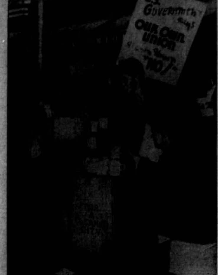
Grupa raznašalcev telegramov, članov unije American Communications Ass'n. (CIO), ki je oklicala stavko proti Western Union Telegraph Co.

Zaradi zdelice me pač ne bi bilo treba tako otevat. No do bro, kar se mene tiče, naj molji