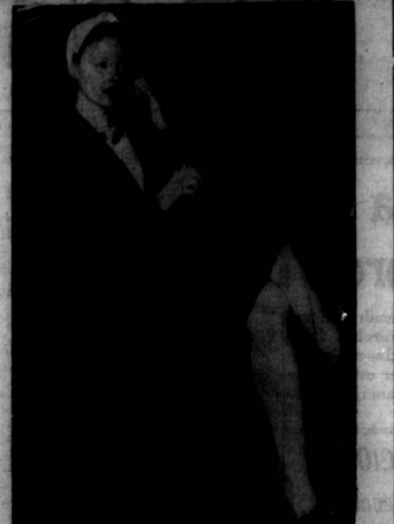
Jean Muir, filmska igralka in ustanoviteljica unije filmskih igralcev.

Po večerji smo šli zopet v SND, kjer smo se sešli z več prijatelji. Dobil sem več celolet-