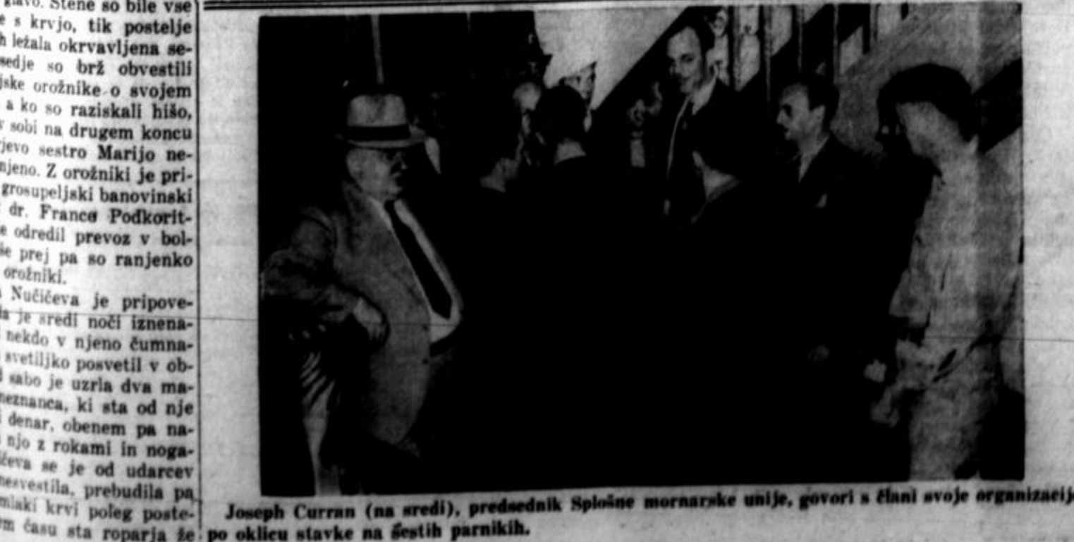
Joseph Curran (na sredi), predsednik Splošne mornarske unije, govori s člani svoje organizacije po poklicu stavke na šestih parnikih.

Spoznati se želim s Hrvatico ali Slovenko v starosti 40 let ali več v svrhu ženitve. Biti mora dobra gospodinja, zdravega razuma in imeti mora nekaj premoženja. Katera resno misli, naj piše na naslov: VDOVAC, 2657 So. Lawndale Ave., Chicago, Ill. —(Adv.)