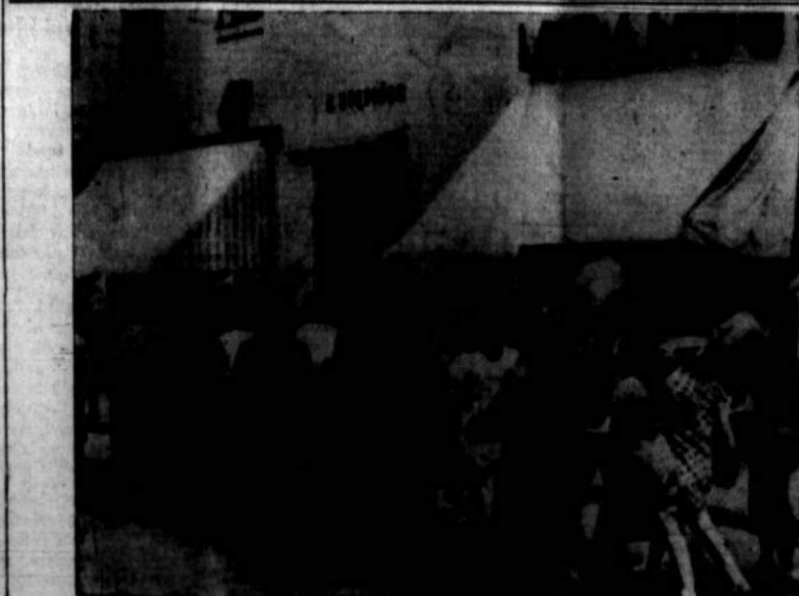
Poljski otroci korakajo z lopatami po cesti na poti v predmestja.

Smešno je torej, če danes Borah trdi, da Amerika ni bila deležna plena zmagovalcev svetovne vojne. Amerika — to se pravi privatni finančni mogotci — je vzela od plena velik delež s pomočjo svojih gospodarskih in finančnih manipulacij. Pomagala je na vsej črti ustvariti konfuzijo in kaos v Evropi — poleg kaosa doma — čeprav je bila 12 let "izolirana in se ni hotela vtikati v inozemske zadeve in probleme..."