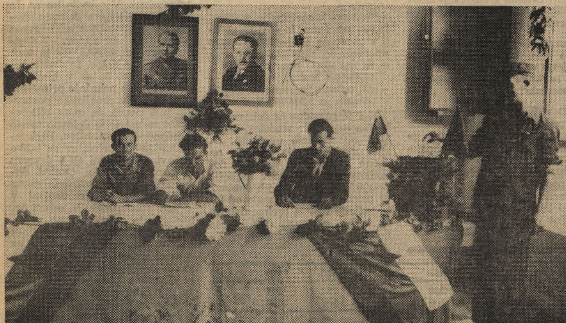
Leto 1950 - volišče v mehanični delavnici