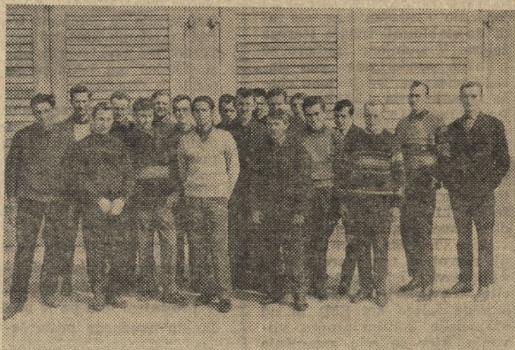
Skupina tečajnikov, kandidatov za žerjavovodje

V najkrajšem času bomo pričeli s tečajmi za usposabljanje za delovna mesta v novi livarni Štor II. Deloma je takšno usposabljanje že v teku, vendar potrebe kažejo po organizaciji 10 različnih tečajev v katerih se bodo usposabljali praktično in teoretično za pretežno vsa delovna mesta v novi livarni. Ko bo nova livarna pričela poskusno obratovati, bo to usposabljanje in izobraževanje za delovna mesta stopilo v intenzivnejšo fazo. R. U.