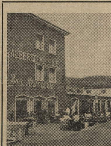
Rezervirani hotel za Kompasove goste

— Saj prav zato. Moja žena bi vas vse življenje stavila menini za vzgled, tega pa jaz ne bi prenesel!