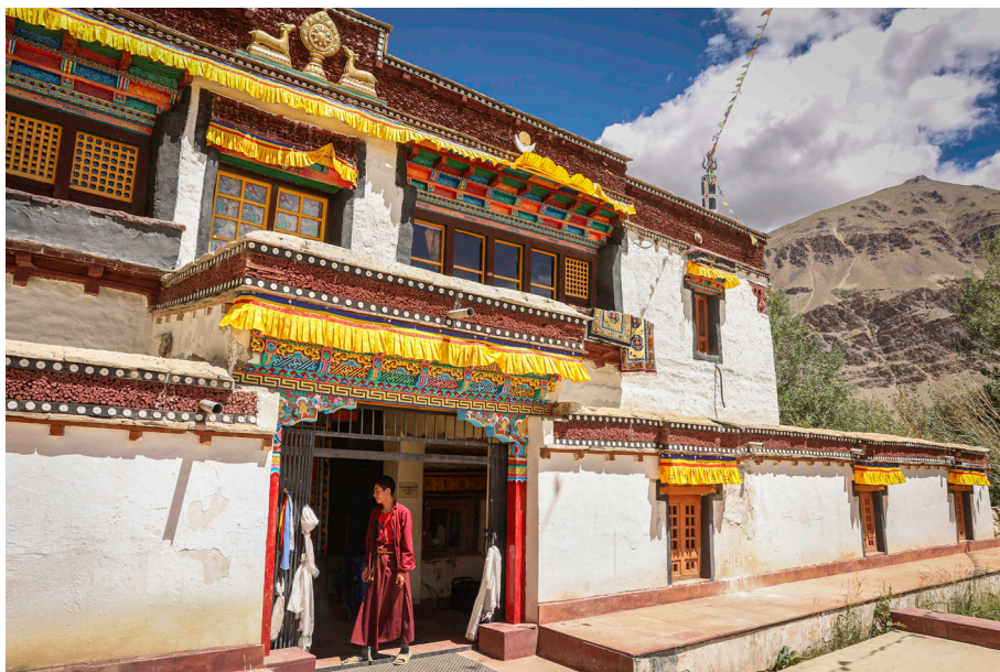
Gompa Sani

Okolica gompe, ki predstavlja nekakšen duhovni in geografski center pokrajine, je posejana s številnimi svetimi kraji, visoko cenjenimi tudi s strani domačinov. V neposredni bližini templja, kjer je meditiral mahasiddha, je znamenita stupa Kanika, zunaj kompleksa pa kamnite skulpture, med njimi tudi bodhisattva Majtreja. Zraven se nahaja pokopališče, po izročilu domovanje dakini (skrt. dākinī , tib. khandroma ), ženskih božanstev, ki izvajajo daritve v ogenj, kjer so se pozneje številni jogiji urili v nočnih meditacijskih praksah, zlasti v kontemplaciji o smrti. Nasproti gompe, čez cesto, je tudi sveto jezero, sredi katerega je kip Padmasambhave na lotosovem cvetu. Okolico gompe Sani naj bi namreč še pred Naropo, v poznem 8. stoletju, obiskal Padmasambhava, ki je premagal zle duhove böna in jih spreobrnil v budizem, kraj pa preroško razglasil za »srečno pokopališče« ( ibid. , 164).