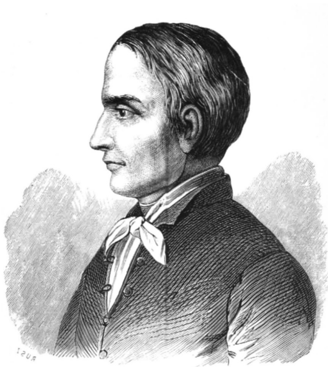
Sándor Csoma de Kőrös, oče tibetologije