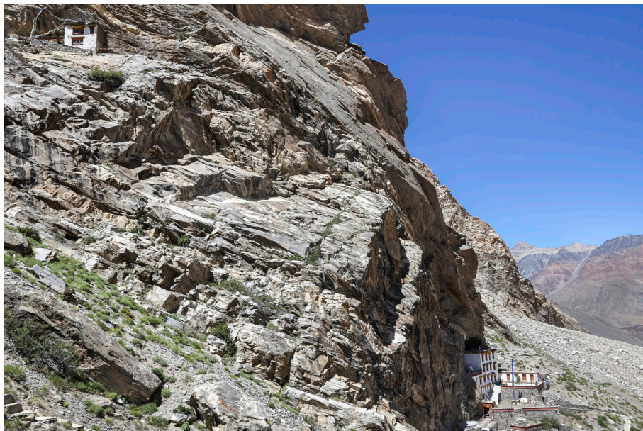
Naropova votlina v strmem skalovju nad gompo Dzongkhul