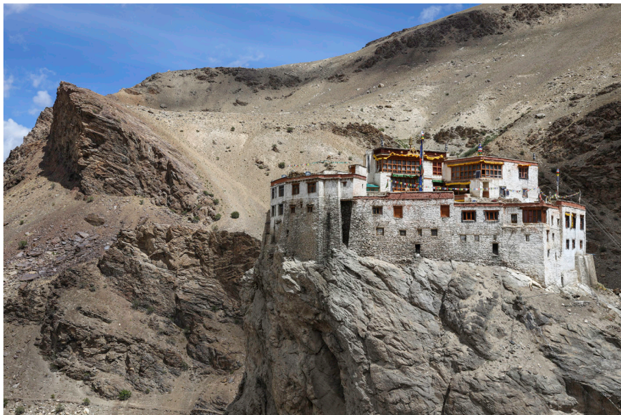
Gompa Bardan ob reki Lungnak