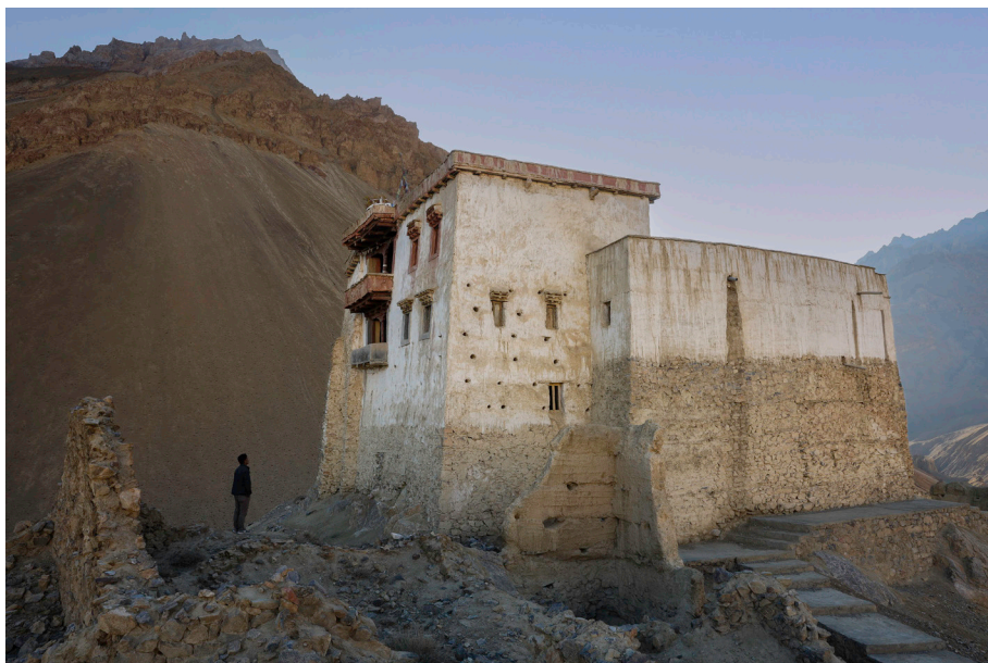
Palača-gompa v vasi Zangla, kjer je Sándor Csoma de Kőrös snoval prvi tibetansko-angleški slovar