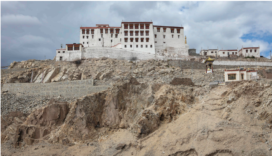
Gompa Stakna, ki je zaradi oblike hriba, na katerem stoji, znana tudi kot »Tigrov nos«