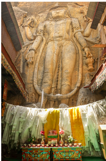
Bodhisattva Majtreja v Mulbekhu, Kargil