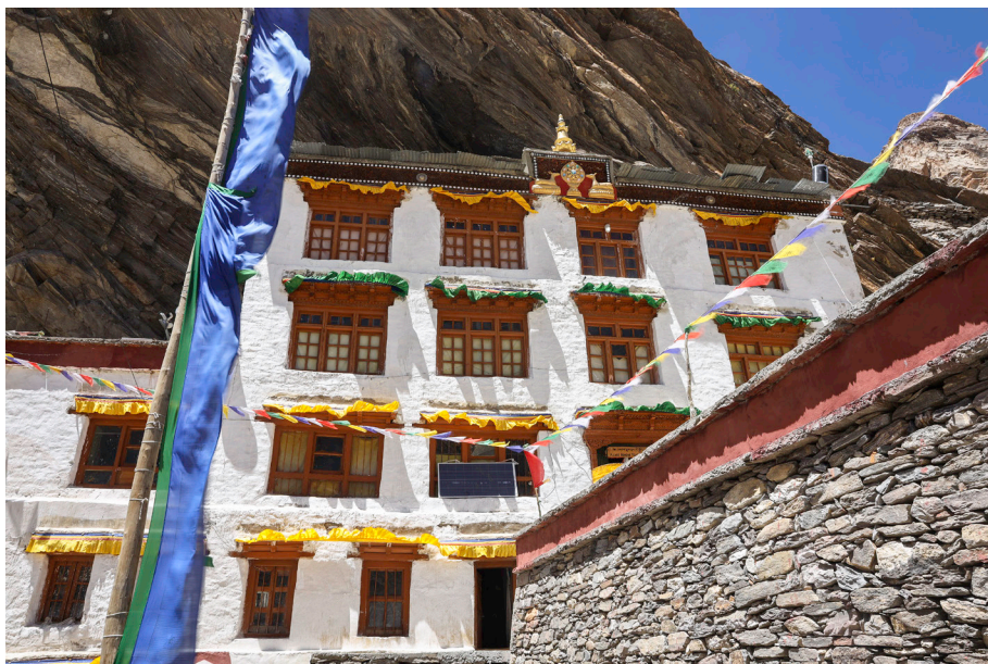
Gompa Dzongkhul v divji naravi zangskarške doline Stod