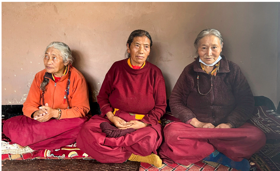
Jogini v svoji hiši