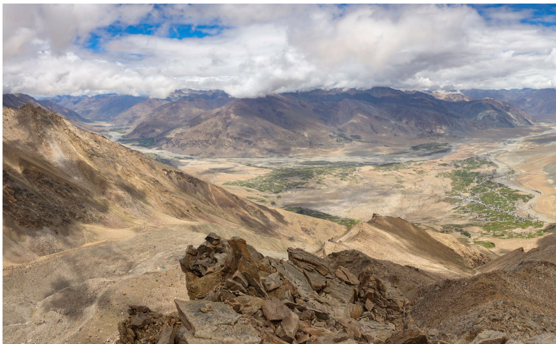
Panorama ladaške doline Zangskar