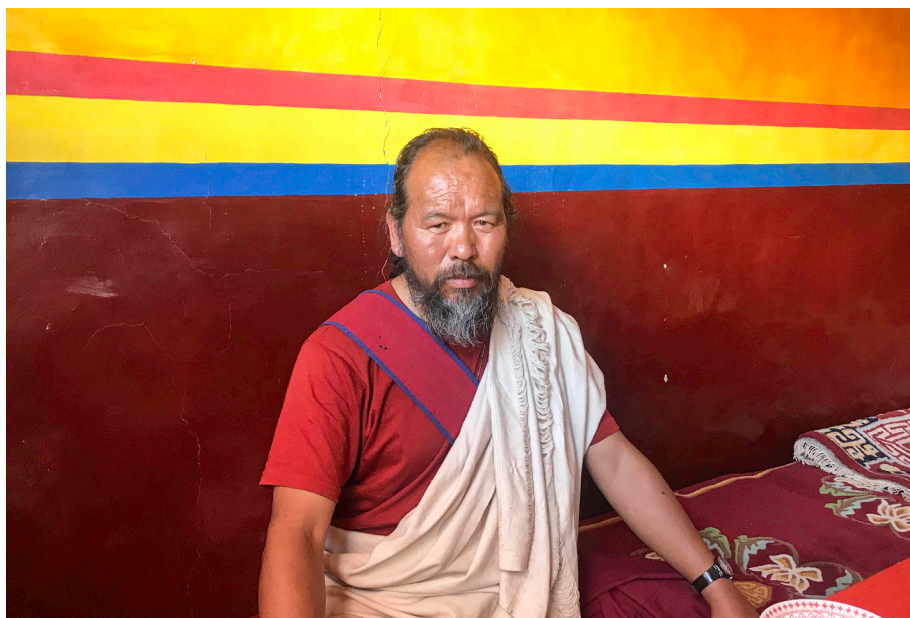
Jogi Ratan v eni od izb gompe Sani v času festivala Naro Nasjal