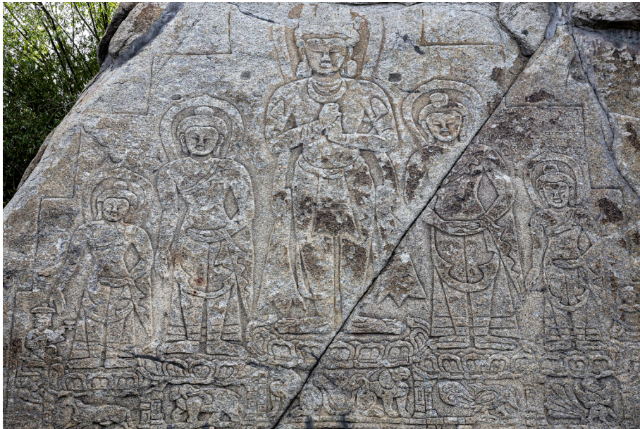
Kamniti relief tathagat v ladaški vasi Shey

Lalitāditya Mukṭāpīḍa ), ki je v 8. stoletju vladal dinastiji Karkota na območju Kašmirja, je v severne predele Indije vabil številne umetnike in obrtnike, ki so gradili samostane in templje ter so domnevno tudi avtorji skalnih reliefov na območju Ladakha (Snellgrove, Skorupski, 1979, 6). Iz tega obdobja so tako ohranjene v skalo izklesane tathagate 12 v vasi Shey, kip bodhisattve Majtreje, ki je danes del gompe Mulbekh na območju Kargila, v kamen izklesani podobi bodhisattve Majtreje in Avalokitešvare 13 v vasi Dras in kamniti relief Buddhe in bodhisattve v Padumu ter v okolici gomp Sani, Stongde, Karsha in Mune. V številnih študijah obstajajo tudi omembe, da je iz tega zgodnejšega obdobja tudi stupa (skrt. stūpa , tib. chöten ) Kanika v zangskarški vasi Sani, vendar za to ni zanesljivih dokazov.