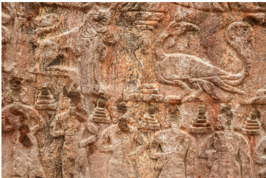
Kamniti relief bodhisattav v Padumu