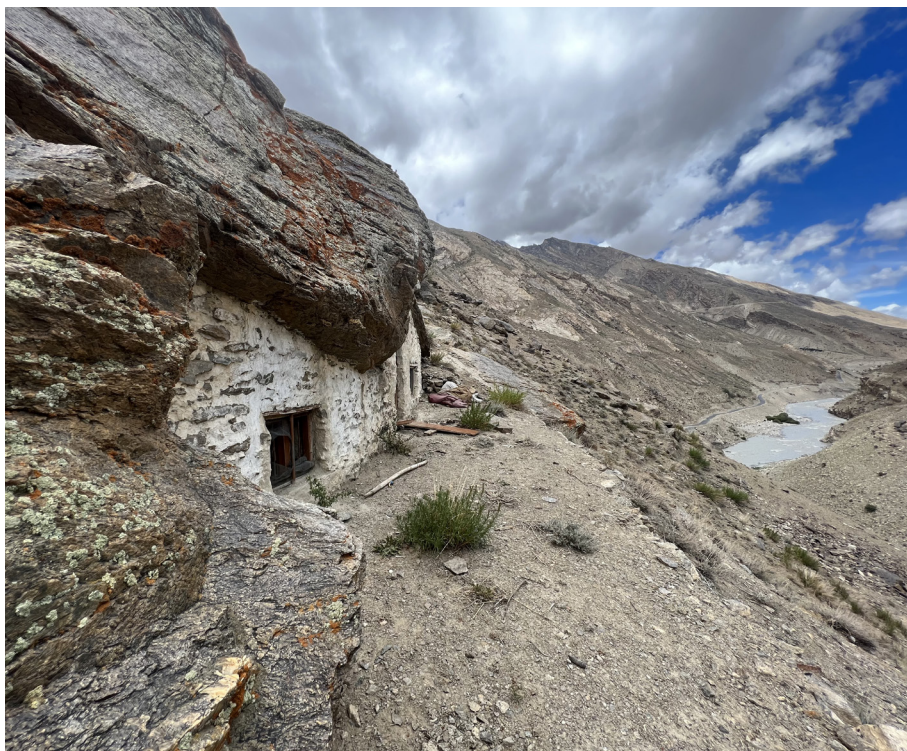
Samotišče v okolici gompe Bardan