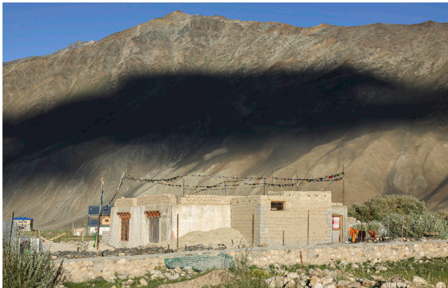
Hiša jogini nedaleč od centra Paduma

samostan, ki pripada šoli drukpa kagyü , s katerim pa jogini, kot so nas seznanile same, niso neposredno povezane, vendar s tamkajšnjimi nunami negujejo stike z občasnimi obiski.