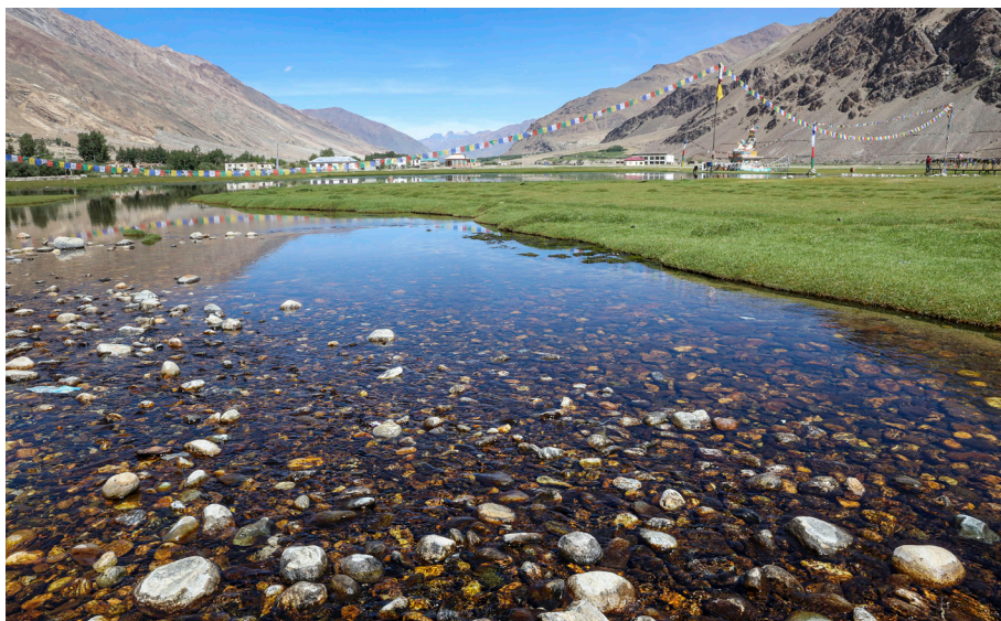
Sveto jezero blizu gompe Sani s kipom Padmasambhave v daljavi

Gompa Sani ima v tradiciji budističnega puščavništva ne zgolj v Zangskarju, ampak tudi na širšem območju Ladakha, zelo pomembno vlogo. Danes se namreč v gompi zangskarški jogiji srečujejo na skupnih pudžah, večinoma pozimi, občasno tudi julija in avgusta. V gompi v času med petnajstim in dvajsetim dnevom šestega lunarnega meseca ( chuto ) po tibetanskem koledarju (v prvem ali drugem tednu avgusta) poteka tudi vsakoletni festival Naro Nasjal, ki je posvečen Naropi. Na njem se zberejo jogiji iz Zangskarja in drugih predelov Ladakha, ki se na skupnih pudžah srečajo že nekaj dni pred začetkom dogodka. 19 Pestro dogajanje, ki poleg jogijev, jogini, menihov in nun privabi tudi množice domačinov, je v nasprotju z omenjenim festivalom v gompi Dzongkhul spleteno iz bučnih tantričnih plesov v maskah ter skupnih obredij in meditacij. Sani je tako nekakšen center srečevanj puščavnikov in obeleževanja pomembnih praznikov v tradiciji, medtem ko v okolico gomp Bardan in Dzongkhul jogiji odhajajo zlasti na samotne meditacije.