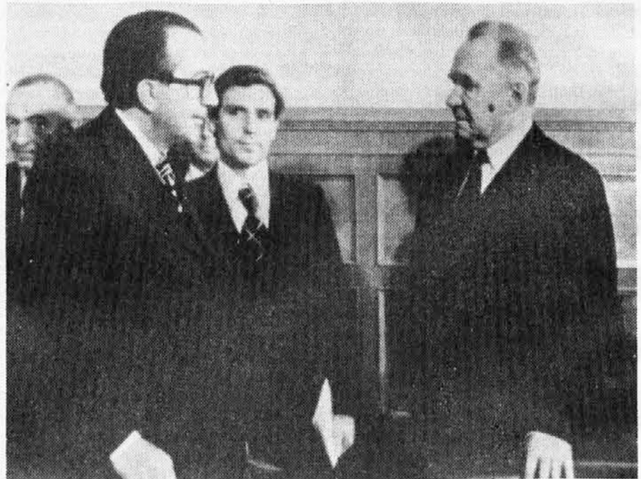
Italijanski ministrski predsednik Andreotti (levo) v pogovoru s predsednikom sovjetske vlade Kosyginom

Seveda je Andreotti obiskal Togliattigrad, kjer je nastalo ob pomoči italijanskih strokovnjakov turinskega Fiata močno industrijsko podjetje za izdelovanje avtomobilov, bil je v Leningradu, ki je 900 dni uspešno ključoval napadom Hitlerjevih armad, prišel nato v glavno mesto Ukrajine Kijev, odkoder se je vrnil v Rim.