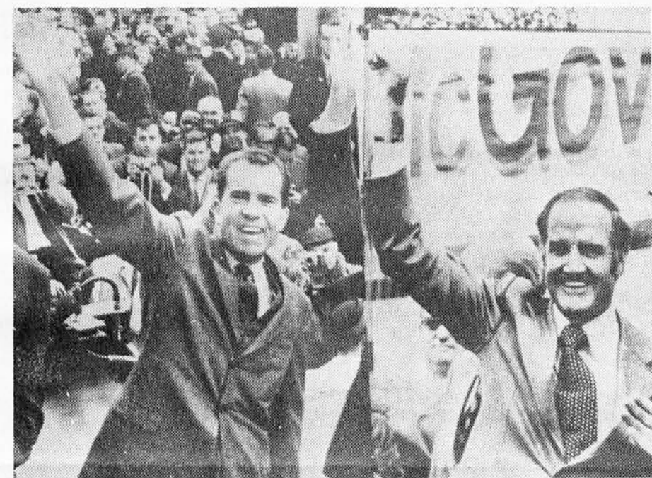
Dva, ki sta se spoprijela pretekli torek na predsedniških volitvah v Sev. Ameriki. Levo: Nixon, kandidat republikanske stranke, desno Mc Govern, ki ga je kandidirala, čeprav nerada, demokratska stranka

Zato gre danes na Tržaškem lista Slovenske skupnosti tako okrepjena na volitve kot še morda ni bila nikdar v zadnjem času. Na kandidati listi so ljudje vseh nazorov, vseh slojev, vseh dejavnosti. Zdi se, da so pri nas spet zaživeli časi, ko nam je narodna sloga in narodna čast najprej pri srcu. To je pa največje zadoščenje za vse zamejske Slovence in za vse, ki nanje gledajo z objektivnostjo in resnično prizadevnostjo.