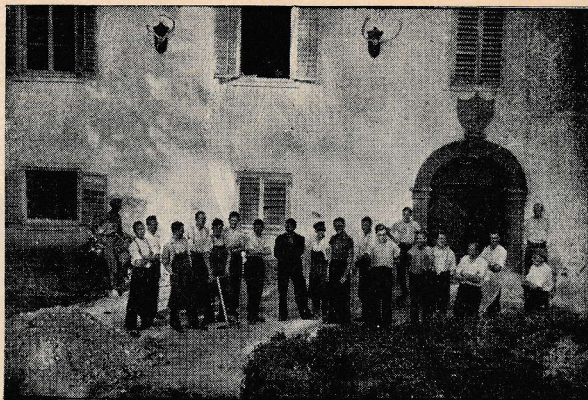
Lisičje: Naši mladi gospodje se odpravljajo na delo, da uredijo novi dom.

V nekaj mesecih smo si zavod že toliko uredili, da je bilo mogoče začeti šolo. Grad je dobil čisto drugo lice. Grmovje, ki se je prej bohotilo vse na okoli in ga zasenčevalo, smo iztrebili. V pritličju smo napravili sicer majhno in preprosto, a vendar