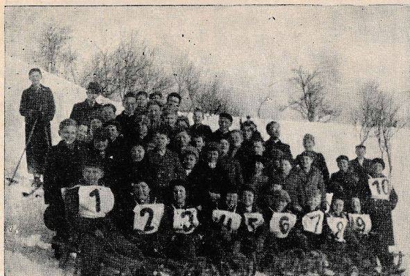
Lisičje: Skupina veselih mladincev, ki so preskušali mlade moči v belem snegu.