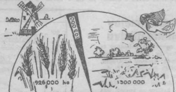
Od skupne kmetijske površine Holandije, ki znaša 2.500.000 ha je 1.307.000 ha zaraslih s travo, 926.000 ha so setvene površine, 103.000 ha pa sadovnjaki in vrtovi.