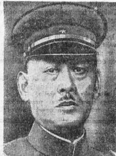
General Kacuki, vrhovni poveljnik japonskih čet

vizij. Japonske čete so pričele ob 14.37 bombardirati Vang Ping. Kitajske čete so pričele obstreljevati Japonce in so napadle ob 2. po kitajskem času japonske položaje pri Papiosana Lukusion. Japonci so sprejeli borbo.