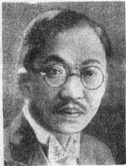
Dr. Vančunghuj: kitajski zun. minister.

Japonska industrija, zlasti tekstilna, je upala, da bo s svojimi niskimi cenami izpodrinila zlasti na azijskem trgu vse druge industrije. Ta namera se ji ni po-