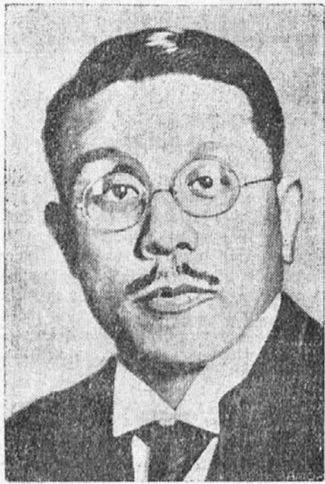
M. Hirota: japonski zunanji minister. Ozadju so pač grobi interesi japonske industrije.

Zato sili japonska industrija v vojno in zato je Japonska mobilizirala že tri milijone rezervistov, da si bo mogla osvojiti kitajski trg in velike naravne zaklade severne Kitajske.