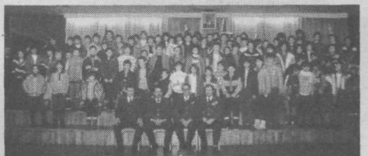
Udeleženci letošnjega kviza pionirjev-gasilcev, ki je bilo v OŠ Karla Destovnika-Kajuha v Štepanjskem naselju