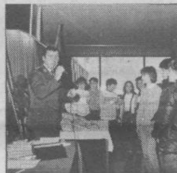
Prvovrščeni trojki pionirjev-gasilcev iz GD Bizovik in GD Lipoglav med kvizom

Če zavrtite telefonsko številko 219-088, boste dobili Servis za občinsko varstvo otrok na domu SEZAM, ki je bil v ta namen organiziran na pobudo RK ZSMS. Prostore so jim prijazno ponudili v Krajevni skupnosti Ajdovščina, na