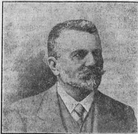
Ljubomir Davidović, predsednik ministrskega sveta, načelnik Jugoslov. Demokratske Stranke.