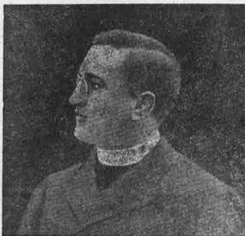
Anton Korosec, podpredsednik ministrskega sveta, načelnik Slovenske Ljudske Stranke.