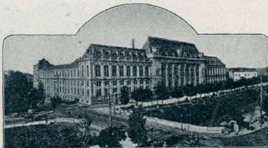
Bukarest: Pravosodna palača.

zašel sem v sodno dvorano, ki je bila natlačeno polna; državni pravdnik je imel svoj govor; razumel kajpada nisem ničesar); mestna hranilnica, narodna banka, vseučilišče,