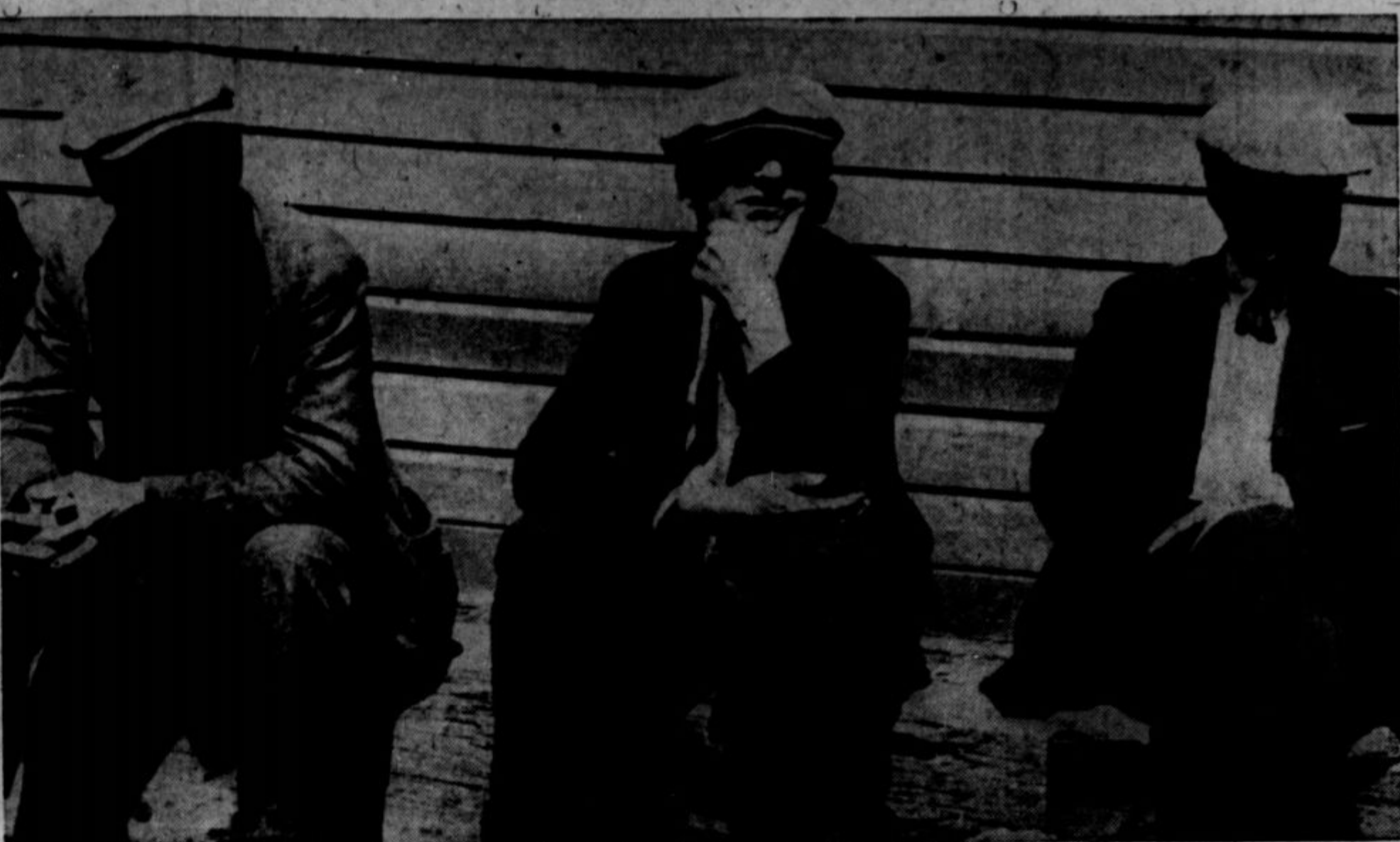
V NEW YORKU je bilo že v maju 400,000 brezposelnih. V Detroitu jih je že tudi tisoče ob delo. In tako več ali manj vseposod. In vrh tega stavke ter nova protiumijska postava, ki nam obeta zelo zelo slabe čase.