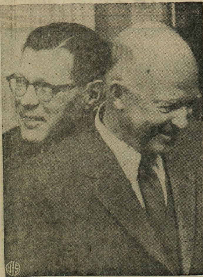
NA TISKOVNI KONFERENCI — Spreten fotograf je ujel tole sliko predsednika Eisenhowerja in njegovega tis- kovnega tajnika J. Hagertya na eni zadnjih tiskovnih kon- ferenc.

GLAVNI URAD 351-353 No. Chicago St. Joliet, Ill.