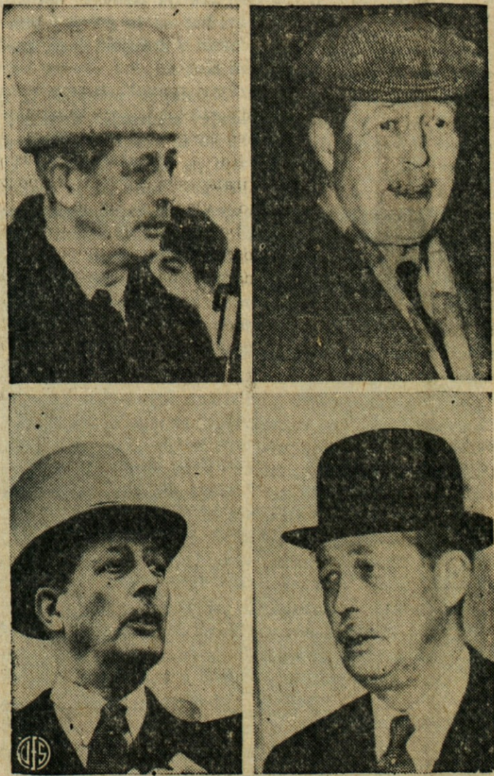
ANGLESKI POPOTNIK — Angleški ministrski predsednik Harold Macmillan je v zadnjih tednih veliko potoval. Na sliki ga vidimo z astrahanskim kočnikom (na levi zgoraj) na letališču v Moskvi, z običajno športno čepico (na desni zgoraj) na obisku na Irskem, s "cilindrom" (levo spodaj) na konjskih dirkah doma, in s "halbkano" na obisku v — Washingtonu.

NEW DELHI, Ind. — Indija je zaskrbljena zaradi upora v Tibetu, pa je izjavila javno, da se vanj ne misli umešavati.