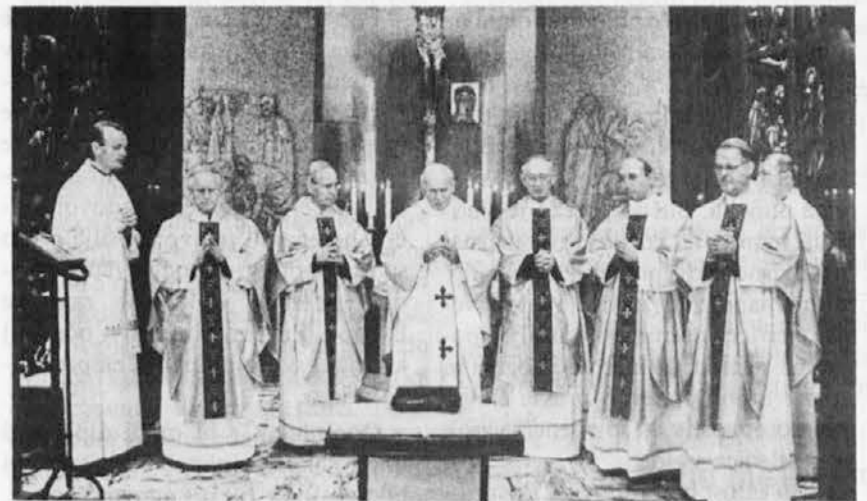
Obisk slovenskih škofov v Vatikanu

V parlamentarni komisiji za nadzor nad Varnostno-informativno službo pa sta se morala zagovarjati načelnik te službe Brejc in notranji minister Bavčar. Del vladnih strank (posebej bivši komunisti) namreč ministra dolžijo, da je kršil ustavo in zakone, ker je v dneh pred lansko vojno prisluškoval Cirilu Zlobcu (in na ta način zvedel tudi za Zlobčev pogovor z italijanskim konzulom). Kakor je bilo moč razumeti iz Bavčarjevega zagovora, pa ni bilo prisluškovano Zlobcu samemu, ampak telefonski liniji z Beogradom in nekaterim drugim osebam v Sloveniji. Če so do sedaj vsaj uradno še obstajali dvomi o spornem Zlobčevem pogovoru, pa jih je razblinil notranji minister sam, ki je dejal, da je Ciril Zlobec v pogovorih, »ki jih je imel z nadzirano osebo 17. in 24. junija sogovorniku povedal načrtovani dan naše osamosvojitve, 25. junij. Ta dan je bil bistven za nenasičen prevzem oblasti... V drugem pogovoru je gospod Zlobec svojega sogovornika seznanil s temeljnimi ukrepi slovenske države, ki so se nanašali neposredno na osamosvojitve Slovenije. Ti so bili z odločitvijo državnega predsedstva in ustavne komisije uradno označeni kot državna tajnost.« Zanimivo je, da predsednik omenjene parlamentarne komisije