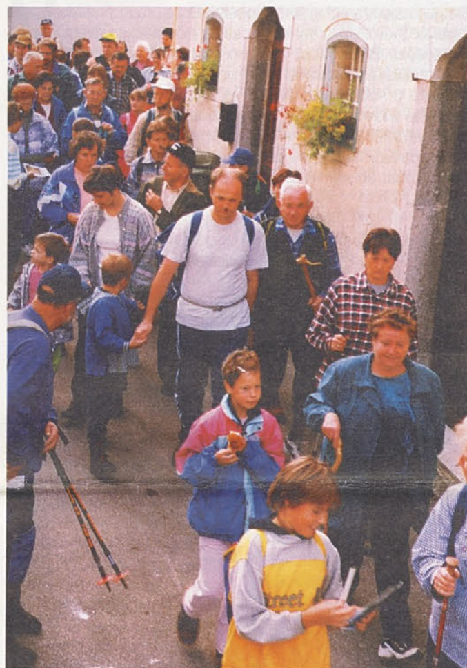
Pohodniki različnih starosti so se dobre volje odpravili na 20 km dolgo pot.

dolge Steklasove poti, po kateri se je na sončno soboto odpravilo kakih 300 pohodnikov. Glede na pestrost ponudbe organizatorji pričakujejo, da bo pot zanimiva skozi vse letne čase.