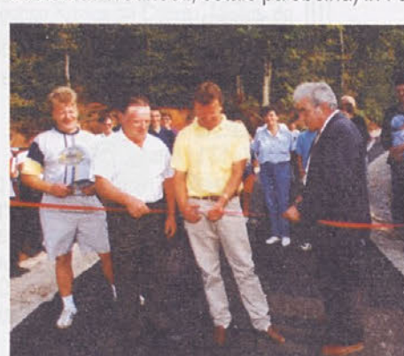
Otvoritev ceste v zaselek Srebotnice