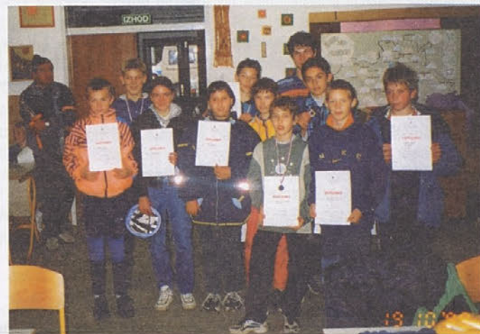
Zmagovalci do šestega mesta na tekmovanju Kaj veš o prometu.

Svet za preventivo in vzgojo se za dobro organizacijo tekmovanja zahvaljuje policistom Policijske postaje Trebnje, članom Društva šoferjev in avtomehanikov ter Osnovni šoli Mirna za gostoljuben sprejem in pogostitev.