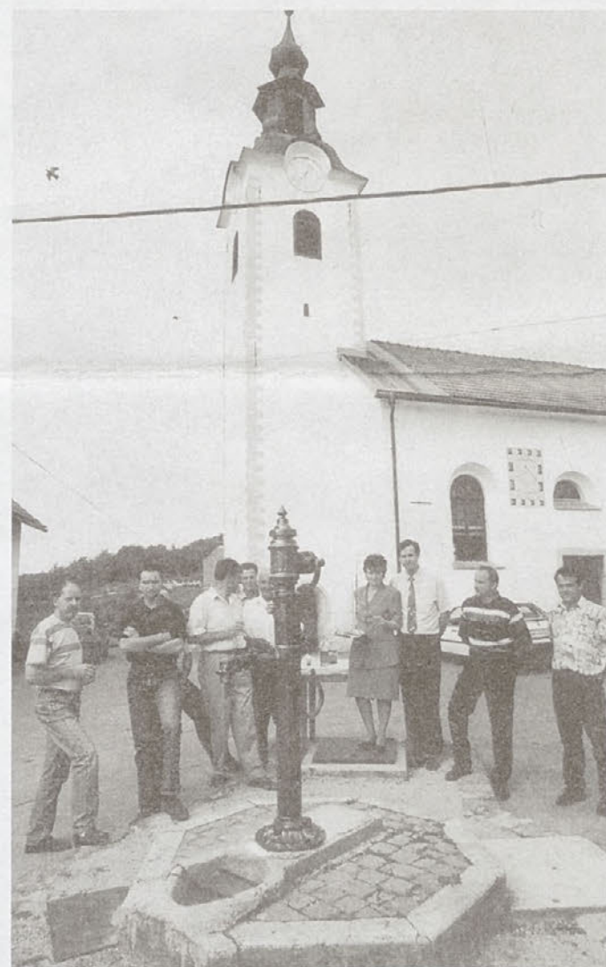
Nova črpalka v središču Sel

KS Sela pri Šumberku čakajo še številne naloge, urediti bo potrebno vodovod do še 4 domačij brez vode, pospešiti bi morali agromelioracijo, še bolj s svojimi izdelki nastopati na ljubljanski tržnici, pa tudi okrepiti iniciativo domačinov, saj se zavedajo, da bodo skupaj lahko bistveno in še več naredili. (tb)