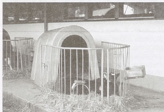
Iglu za teleta na biokmetiji