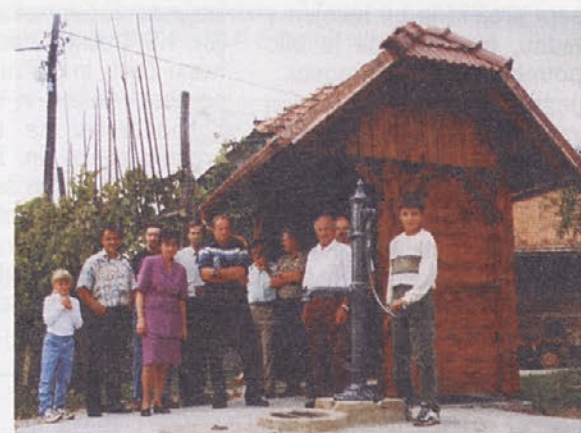
Čakalmica s črpalko za vodo

do edine domačije v Srebotnicah. Struna je poudaril, da so ceste v KS življenjskega pomena za to, da bi KS še bolj zaživela in se odprla tako vikendaškemu kot ostalemu turizmu, predvsem pa dobre ceste korenito spreminjajo življenje na vasi. Dejal je tudi, da prebivalci veliko pričakujejo tudi od nove avtoceste, ki se bo zaenkrat zaključila pri Biču, saj bo to pomenilo, da bo ta krajevna skupnost od Ljubljane oddaljena le še dobrih dvajset minut. V veliki meri zaradi tega pričakujejo, da bodo njihove vasi in domačije postale še bolj zanimive za počitniški in