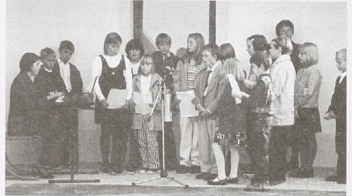
Učenci podružnične šole Trebelno med nastopom.