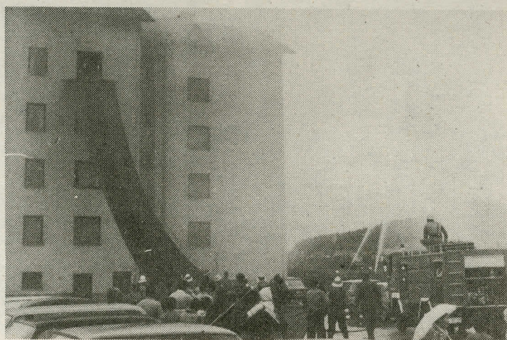
Nazarški gasilci so v mesecu požarne varnosti prikazali reševanje iz višjih nadstropij. Vaja je zelo dobro uspela

O izbiri bodo kandidati obveščeni v 8 dneh po poteku roka za prijavo.