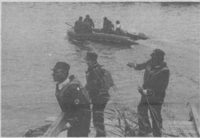
Reševanje iz vode