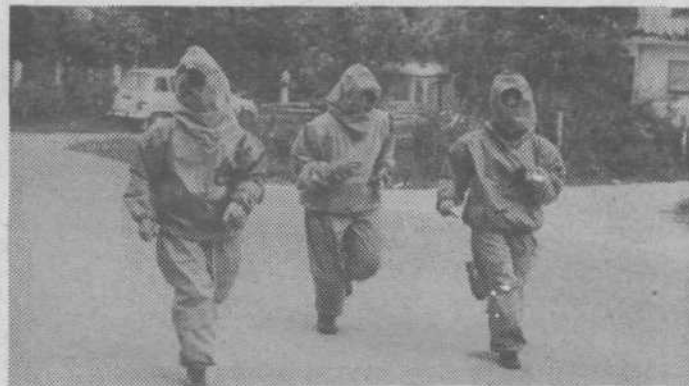
Bizovik: Alarm ob 16.30! Letalski napad z različnim orožjem