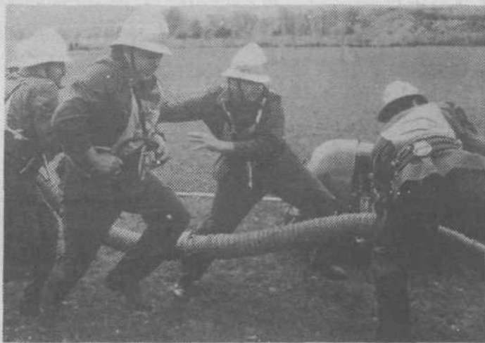
Vevčani so ob svojem prazniku — krajevne skupnosti in papirnice — pripravili gasilsko vajo in se tako tudi vključili v dan civilne zaščite. Na sliki: Zmagovita ekipa pri delu