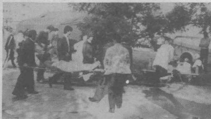
Zelena jama: Prva pomoč je takoj začela delovati