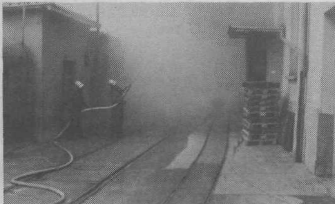
V Kolinski so nastopili gasilci — ob potresu je prišlo do požara v zgradbi splošnega sektorja pri vratarnici in se razširil po vsej strešni konstrukciji