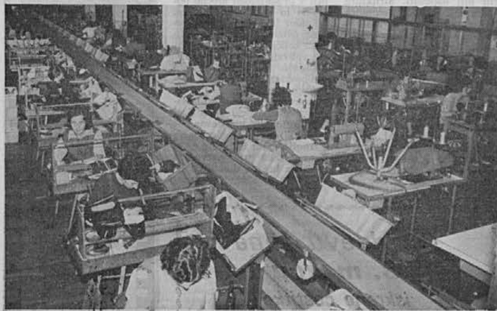
Proizvodni program je narekoval združitvi obeh šivalnic v eno samo, od koder je tale posnetek