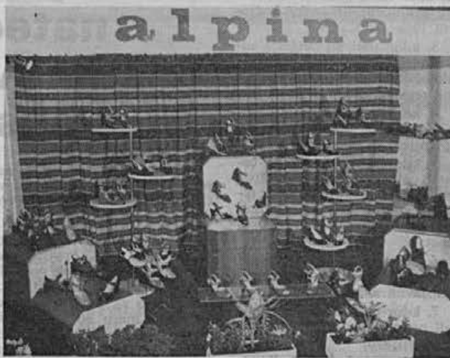
Razstavni prostor lahke obutve

Obiskovalce sejma je pri našem razstavnem prostoru najbolj pritegnila kolekcija smučarske in planinske obutve. Vzrok je seveda tudi v tem, da druge firme tovrstne obutve niso razstavljale. Na