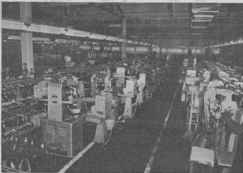
Delavci za stroji v proizvodni hali se nenehno trudijo za večjo storilnost

Rešitev je torej v povečanem izvozu na konvertibilno področje, kar letošnji plan izvoza tudi predvideva. Druga