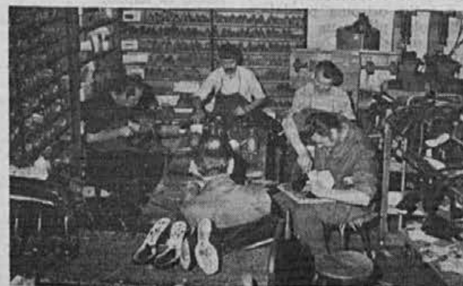
Nepogrešljiv koticček v naši proizvodni hall, kjer se rešuje, kar se rešiti da