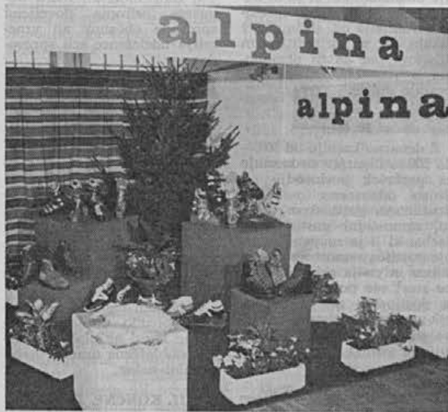
Obutev, ki je obiskovalce najbolj pritegnila