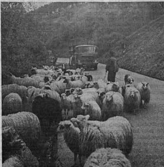
All se bomo vedli kaj boljše?