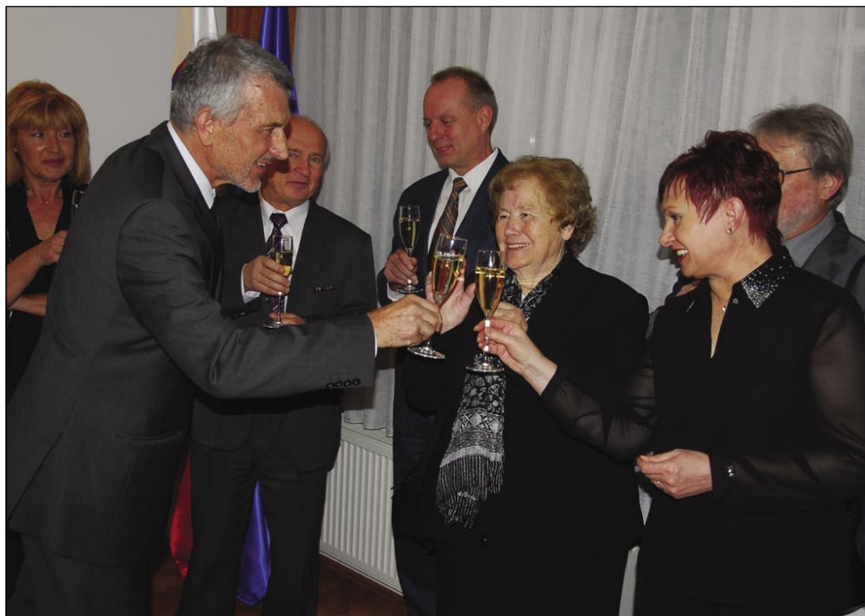
Generalni konzul Dušan Snoj je nazdravil trem praznikom, dnevu samostojnosti R Slovenije, 15. obletnici delovanja generalnega konzulata in božično-novoletnim praznikom

Poglavitna naloga Generalnega konzulata v preteklih 15 letih pa je bila vsekakor zaščita pravic slovenske narodnosti na obmejnem območju Madžarske, je