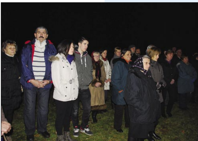
Andovčani in njihovi prijatelji