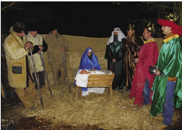
Prizor živih jaslic

za vse, ka se dja nutnaravnem, če drügo nede. Dapa Joži Čer zato nas nikdar ne pisti na cedili, istino, ka malo zamüdo, dapa kak vsigdar, zdaj je tō on biu sveti Djaužef. Tak mislim, ka za tau vlogo od njega baukšoga bi tak nej mogli najdti. Dočas ka smo se nutnaravnali, na dvorišči je že puno lüstva bilau, dapa tau nej baja, ka smo kasnej začnili, etak so te bar čas meli küjano vino koštavati. Letošnji betlehem je malo ovakši biu, kak smo ga dotejga mau meli, zato ka pastirge pa krali so nej na mesti stali, liki vō iz gauštja so prišli, dola so pokleknili pred jaslice pa tak so te na mesto stanili. Med tejm, ka si