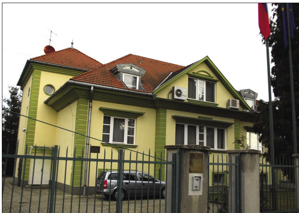
Poslopje generalnega konzulata, v katerem se odvijajo pomembni dogodki