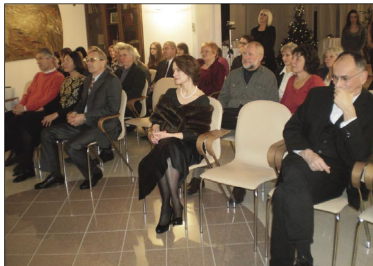
Naši so se lepau zbrali, eden tau publike

tak, če skupaj držimo in se pomagamo, poštvüvlemo. Vüpamo se, ka v nouvom leti mo tadale delali, zbor bo dale spejvo, Mladinska sekcija bo dale vküper odla, dale bomo imeli prireditve kak do zdaj. Razveseljivo je, da se mladi, ki majo slovenske korenine, zanimajo za slovenski knjižni jezik, hodijo na poletno šolo v Ljubljano. Eden je bijo lani na jesenski in pomladanski šoli, sedaj je na univerzi. Voditeljica Mladinske sekcije je pa sedaj na jesenski šoli. Dobro je, da se mladi vedno udele-