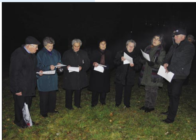
Cerkveni pevci iz Dolejnec

tejm Državna slovenska samouprava tō pomagala, ka je dobro prišlo etak na konci leta, gda so že prazne žepke. Letos smo žive jaslice v soboto, 21. decembra večer v šestoj vōri meli, gda je tak toplo bilau kak na vüzen ali ešče bola. Malo čüdno je bilau se tak kreda dejvati na božič, ka nej bilau snega pa nišoga razpoloženja nej. Dapa tau se je včasim spremenilo, gda smo v gauštji vsekli krispan pa smo ga okrasili, istino tau je že zadvečerek bilau. Delo se je pa že