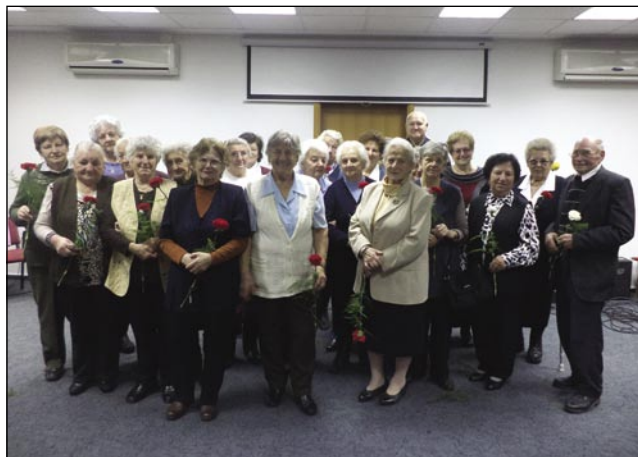
S spoštanjaum pa z veseldjom pozdravljeni penzionisti v najlepši lejta