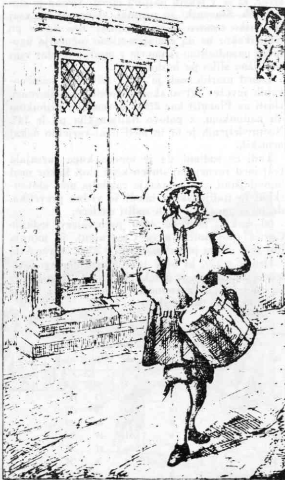
Mestni bobnar razglša odredbe mestnega sveta

3. Splošna karantena. Ta se je uveljavila zlasti po mestih in v težjih primerih; takrat se je za-