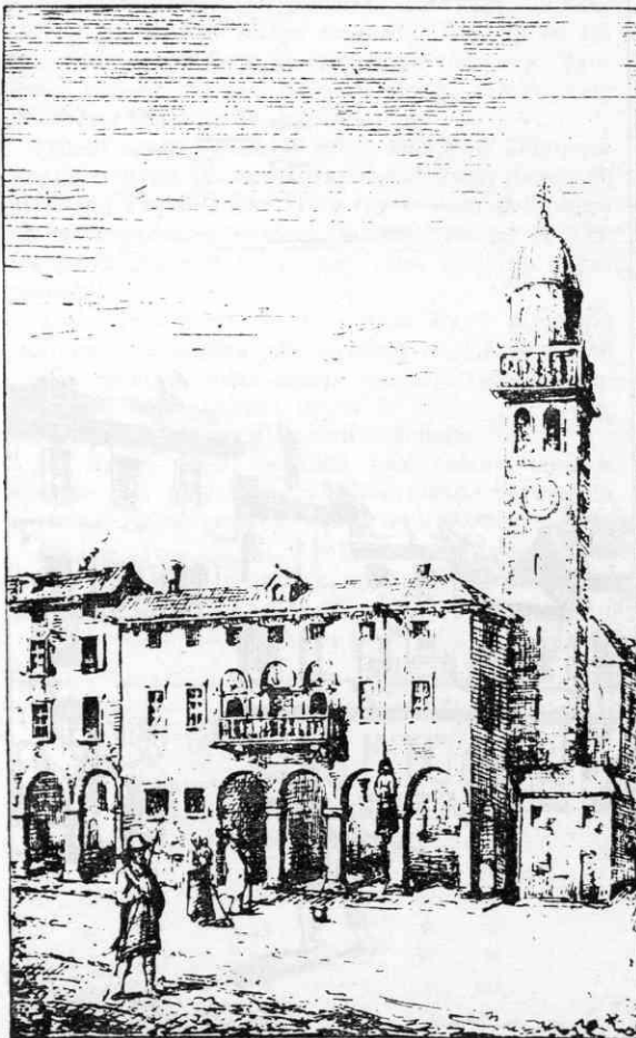
Mestna hiša v Gorici v XVIII. stoletju