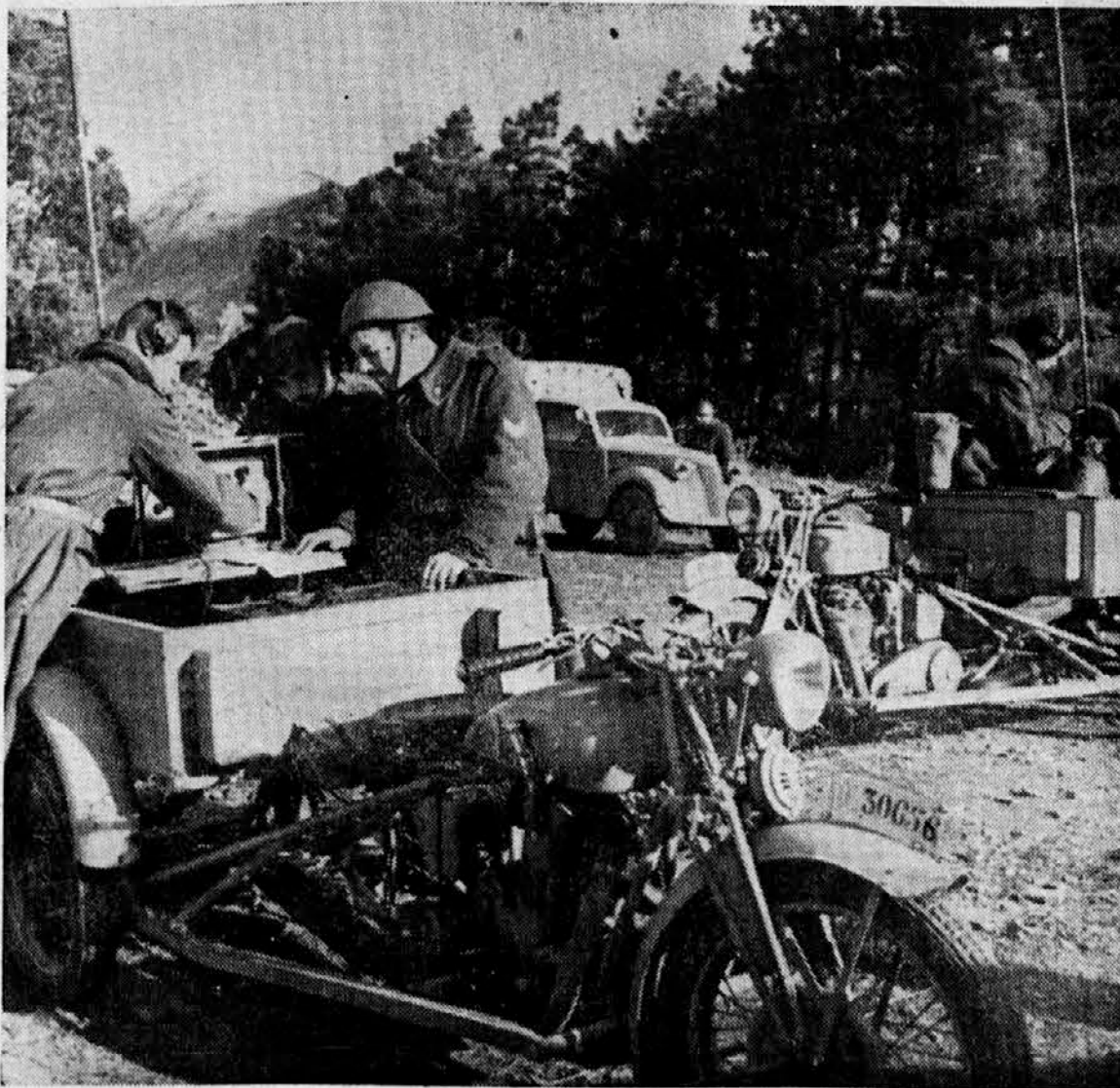
Poljska radijo postaja.

Gre se za stari ameriški način priznavanja. Kapljico na kapljico se vlivajo Amerikancem grenka presenečanja, dasiravno so ti že zdavnaj prišli do zaključka, da vojna ni prav nič lahka zadeva in da Japonci niso majhen, siten narod, katerega bodo oni v najkrajšem času pometli iz Tihega Oceana z njihovih mogočnim brodomjem, tistim brodomjem, ki pa danes že nad polovico leži na dnu tega Oceana.