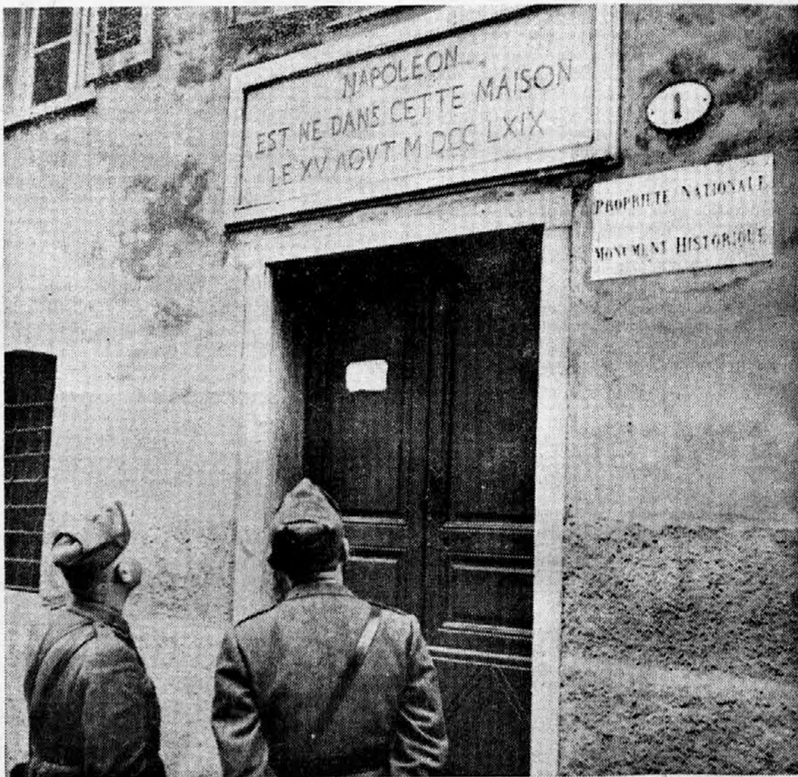
Napoleonova rojstna hiša v AIACCIO (Korzika).

Kaj se bo pa zgodilo takrat, ko bodo Italijani in Nemci vrgli v bitko vse svoje razpoložljive bojne sile, ki se neprestano večajo in množijo z ladjami in letali, ki skoro nemoteno plujejo čez Sredozemsko morje?