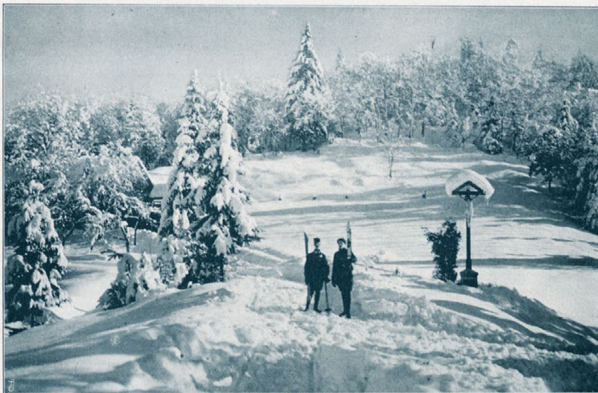
Smuški teren v Podutiku pri Ljubljani.

metne igre gojiti z vso vnemo tudi razne panoge lahke atletike, ki tvori nujno potrebno dopolnilo nogometa. Lahkoatletične prireditve v Ljubljani, Mariboru in Celju so nudile zadovoljive dokaze, da ima naša mladina vedno več umevanja za prave sportne naloge. Poleg iniciative posameznih agilnih klubov v Ljubljani in drugod gre na tem polju upravičena pohvala zlasti Ljubljanskemu nogometnemu podsavezu, od katerega se nadejamo, da bo smotreno in vztrajno nadaljeval začeto delo.