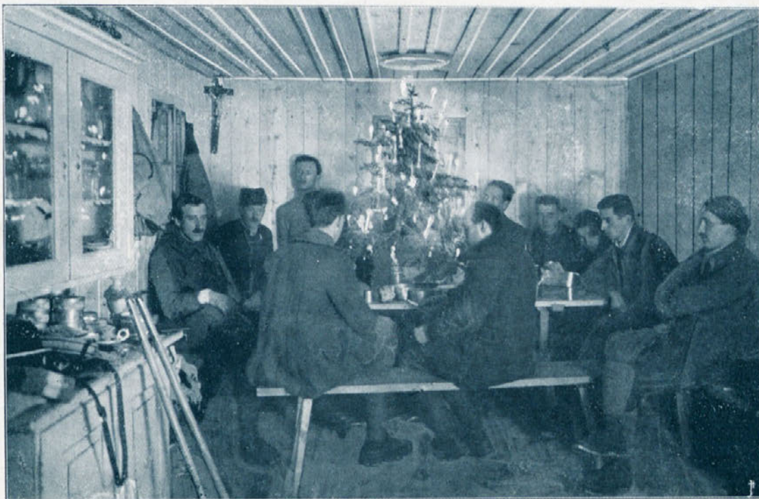
Smučarska božičnica na Veliki Planini.