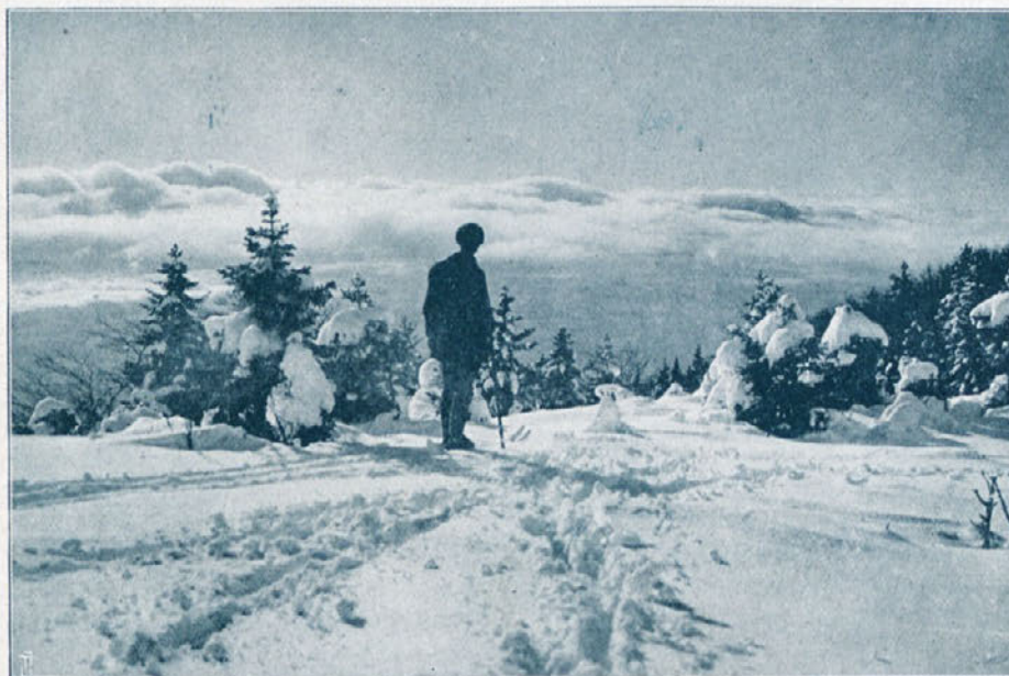
Pogled na megleno morje s planine Jezerc.

Eno mi je še omeniti. Za vse to ogromno delo, organiziranja klubov in dirk, je v prvi vrsti zasluga