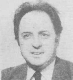
Piše dr. BORIS KUHAR

Zelo zgodaj, že v maju so letos pred nami pomembni spomladanski prazniki, ki so ponavadi šele junija. Letos cerkveno leto močno prehiteva naravo. Binkošti praznujemo že 19. maja in še celo telovo je že maja. Ljudstvo ima svojo pratiko in se malo meni za astronomski koledar. Zanje so binkošti zadnji mejnik v gredi. Tudi tod na Dolenjskem je še vedno odumachen rek, da se po binkoštih že začne poletje.