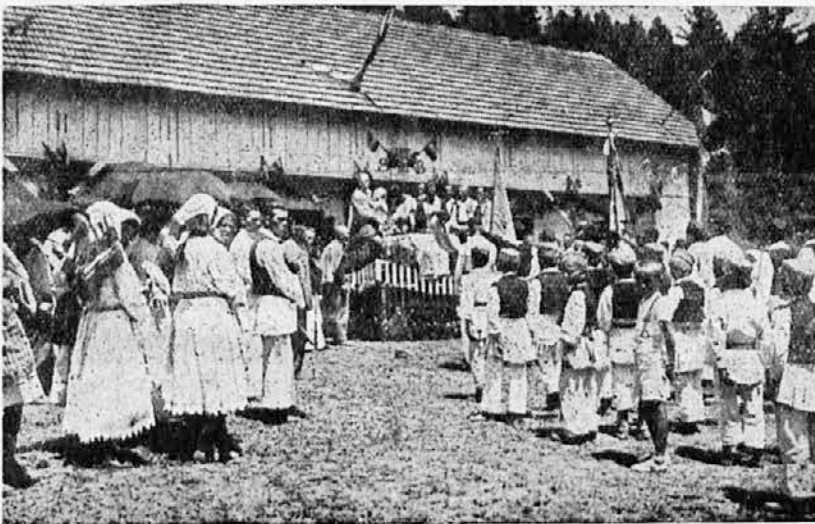
Освећење заставе у чети Прибинић

Од тих заветних задатака, чета је до сада извршила следеће: 1) изградила 2 чесме (врела) и прозвала их „Врело Краља Петра II“ и „Врело Гаврила Принципа“; 2) Изградила пут у дужини од 500 метара, који води од бановинског пута до Принциповог врела; — 3) Осветила