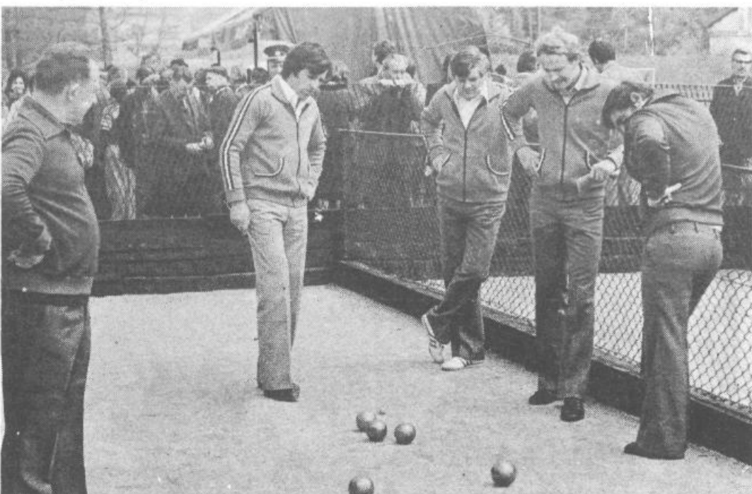
Posnetek je s turnirja balinarjev, ki je bil na dan občinskega praznika na balinišču v KS Krim-Rudnik