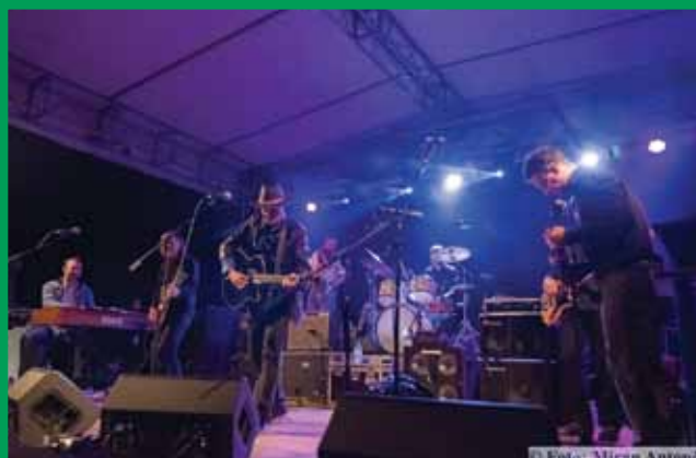
Prisluhnili smo lahko Vladu Kreslinu in Malim Bogovom.