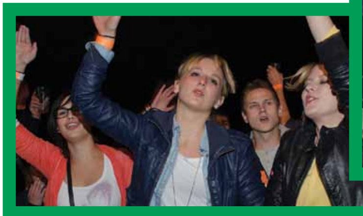
Logaško poletje je dalo obilo zabave.