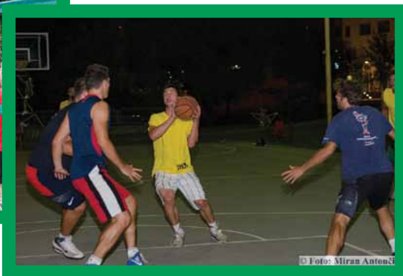
In se pomerili tudi v košarki.