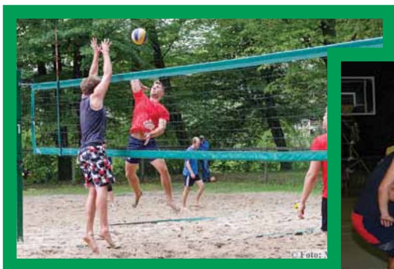
Mladi so igrali odbojko.