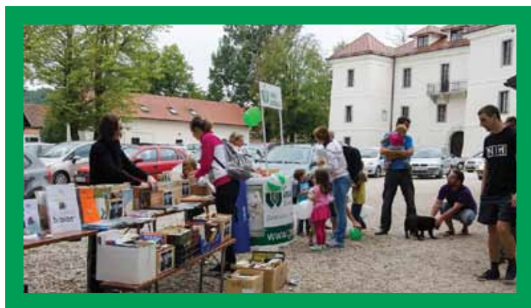
V Bukvarni smo kupovali zanimive knjige.