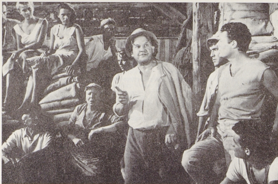
V koprodukcijskem filmu »Kruh in sol« (1957) je Sever igral starega piranskega solinarja (v sredi s klobukom)