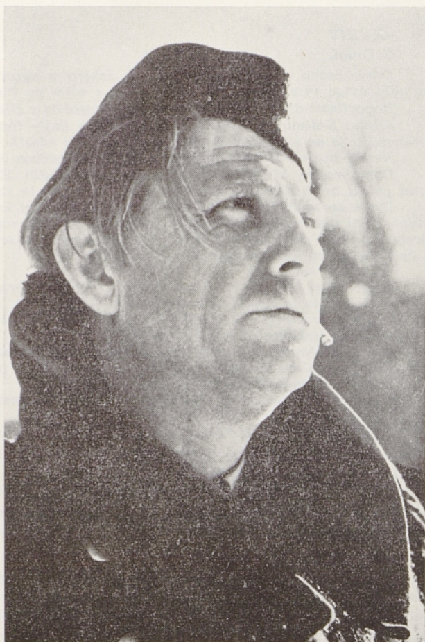
Sever kot partizan Drejc v filmu »Na svoji zemlji«, 1948