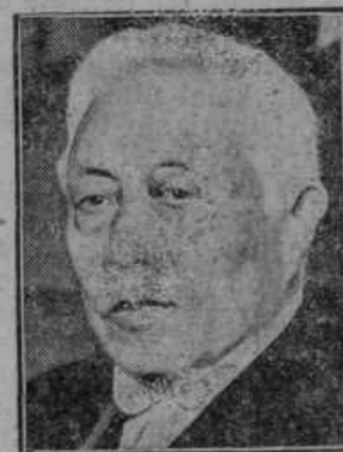
Novi japonski ministrski predsednik admiral Makoto Saito.

Centralna sadjarska zadruga. V časopisih so se pojavile vesti in tudi naše uredništvo je prejelo predlog, da bi se ustanovila centralna zadruga za izvoz sadja, in sicer v Beogradu. Zoper ta predlog se je že mnogo ljudi oglasilo in tudi mi nikakor ne moremo zavzeti stališča, da bi taka organizacija kaj omogočila izvoz sadja. Sadju ni pšenica, ni vino, tudi je treba hitro odpremiti, sicer je velika škoda. Tudi vse poslovanje preko Beograda bi oviralo točno prodajo sadja. Poleg tega bi za tako organizacijo bilo treba dovolj kapitala, ako bi se naj v gotovini izplačevalo. Naši sadjerejci hočejo na vsak način, da denar dobijo. Nujno je, da se pusti sadna kupčija vsaj po banovinah povsem prosta, naši so dovolj pripravljeni, da bodo izvoz pravilno organizirali. Država je pa itak že s pšenico imela take izkušnje, da ni treba, da bi še pri sadju toliko ali še več izgubila. Pa tudi kmetje bodo bolj zadovoljni, ako bodo točno dobili denar namesto bonov. Zato se naj vsi merodajni faktorji izjavljajo proti ustanovitvi take centrale.