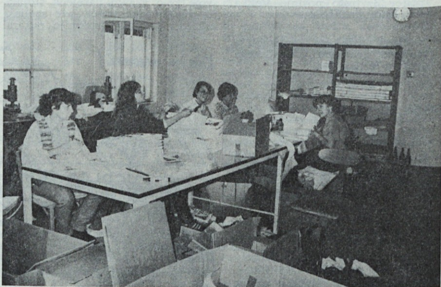
Mladi na medpočitniškem delu