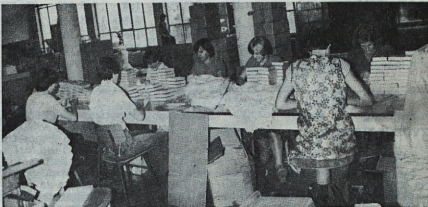
Z novimi stroji se odpravlja ročno delo, ki pa ga pri konfekcioniranju še vedno ni malo.