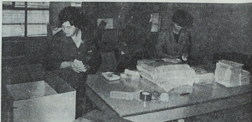
Kompletiranje paketa za novorojenčka — nekatere mamice v Sloveniji so že prejele paket.