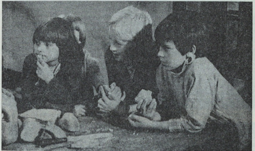
Zdrav otrok — naša sreča

Merlin Danica delegat zdravstvene skupnosti