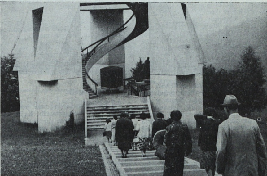
Člani ZB TOSAMA so ob prazniku položili venec pred spomenik v Dražgošah

Mogoče smo ob 4. juliju za tre- nutek ustavili nekdanjega borca, aktivista in ga vprašali, kaj njemu pomeni ta praznik. Gotovo smo do- bili odgovor, ki ga moramo nositi v mislih dan za dnem: »Ta dan po- meni predvsem spomin na težke dni, ki pa niso bili zaman, temveč so rodili bogate sadove. Rodili so spoznanje, da je svoboda nekaj, kar ni naprodaj, cenjen zaklad, ki se lahko kupi le s krvjo in današ- nji rodovi, predvsem pa še mladi, rod, naj pomnijo: Spoštujte pridobitve revolucije, cenite svobodo, kajti svoboda, kajti svoboda je samo ena!«