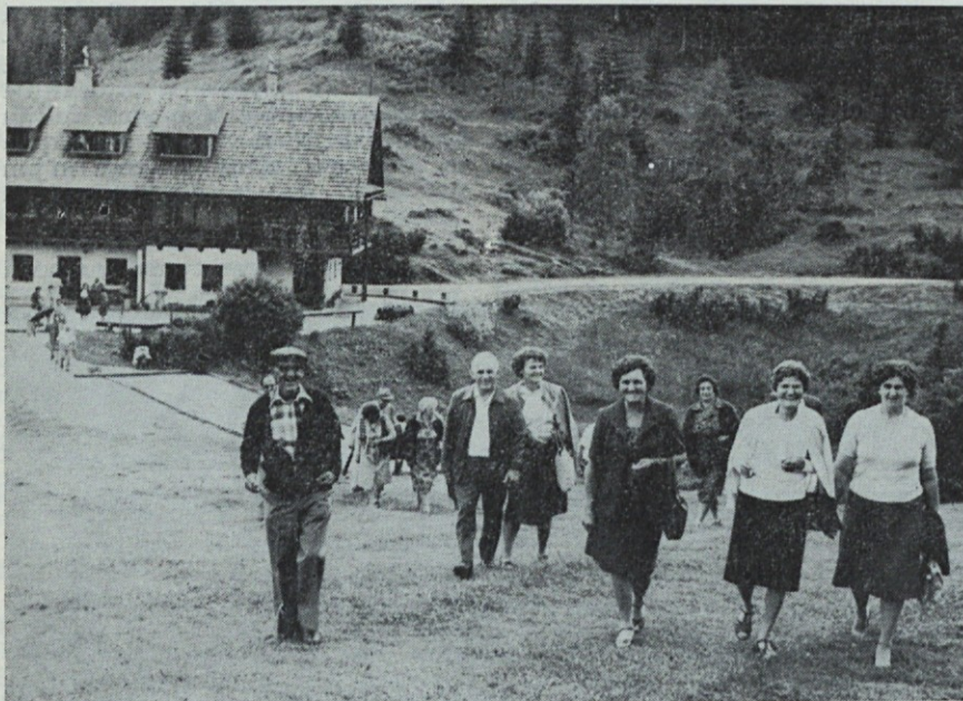
Obisk spomenika na Jelovici