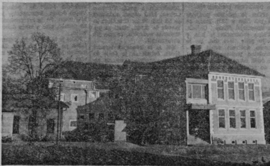
Obnovljena fasada druge osnovne šole kaže prijetno lice, ki pa bo še lepše takrat, ko bo oplemeniteno z urejenim okoljem.

K telovadnici mislijo za prvo nujno pridobiti še dve učilnici, tako bi jim uspelo preiti na eno in pol izmenjski pouk. Tako bi bil rešen problem številka ena.