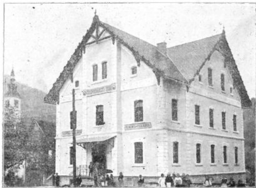
Pod. I. Gospodarski dom v Cerknem.

Z današnjo številko začenja „Prim. Gospodar“ svoj drugi letnik. Kakor nas je gonila lansko leto vedno le želja pomagati z dobrimi nauki našemu trpečemu kmetškemu ljudstvu, tako