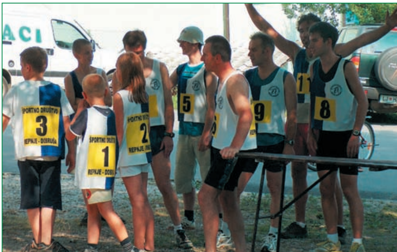
Športno društvo Repnje-Dobruša vas vabi.