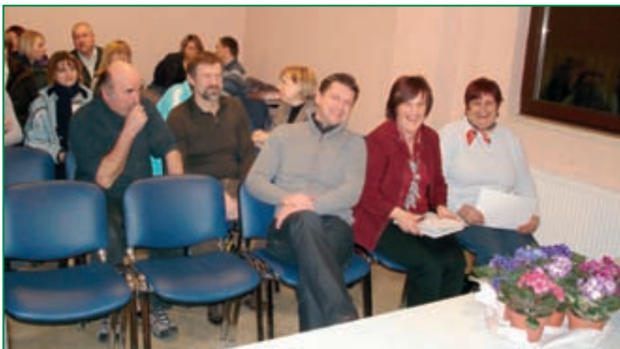
Na občnem zboru so bili člani dobre volje.

Konec meseca avgusta (20. 8.– 22. 8. 2010) smo se podali na tridnev-