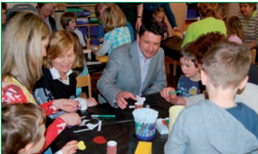
Župan Aco Šuštar si je sam ogledal, kako teče življenje v vodiškem vrtcu.

Naš vrtec je kljub prostorski utenjenosti prostor srečevanja, druženja, medsebojnega spoznavanja, učenja in medgeneracijskega povezovanja. Tudi letošnjo pomlad smo v centralni vrtec in obe enoti vrtača povabili babice in dedke. Po predstavitvi vzgojnega