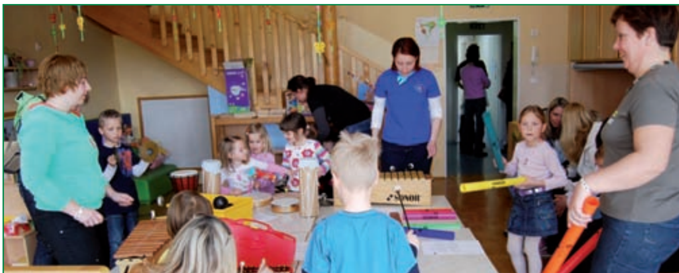
Različne generacije, različne želje, isti cilji.