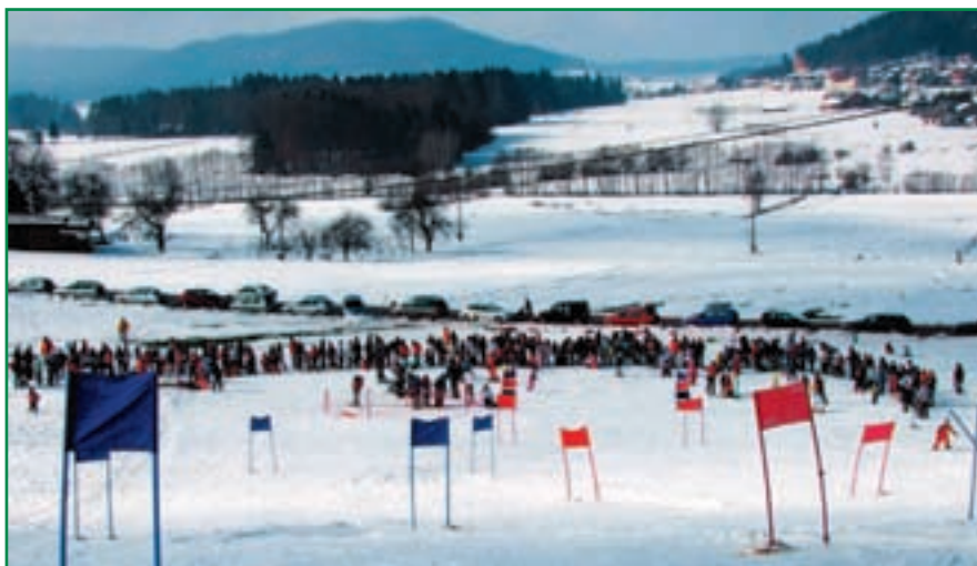
SD Strahovica velja za najbolj aktivno društvo v občini.