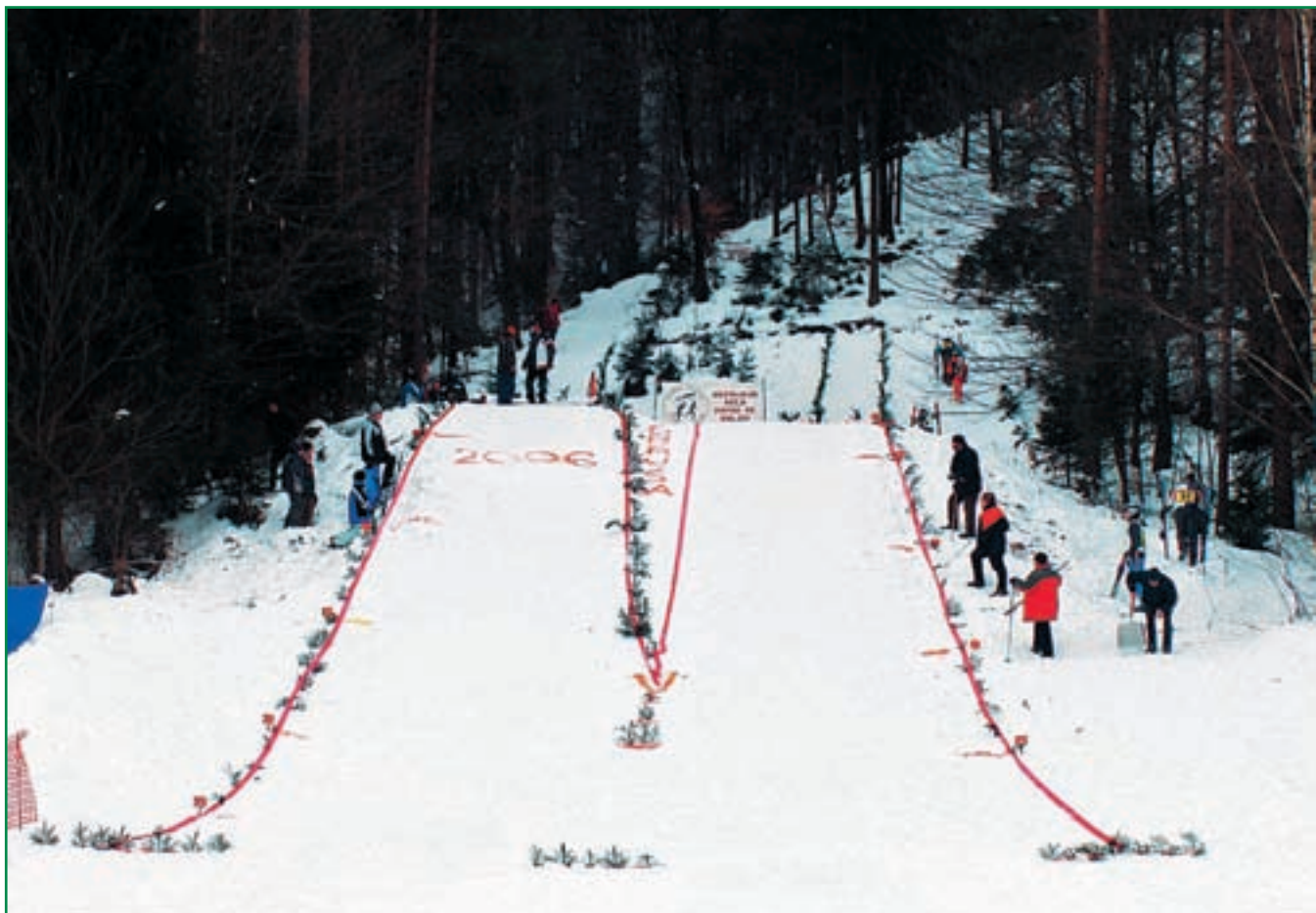
Slavna Dobruška "velikanka"

Predstavitve športnega društva ne bomo začeli z letnico 1997, ko smo stopili skupaj in za voljo športnega duha uradno registrirali sedanje ime športnega društva. Že dolgo pred tem je precej živahno delovala športna sekcija, kot del enote Prostovoljnega gasilskega društva Repnje-Dobruša.