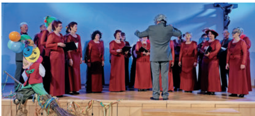
Obrtniški MePZ Notranjska pod vodstvom W. A. Mozarta