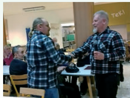
Dobrodošlica novemu članu