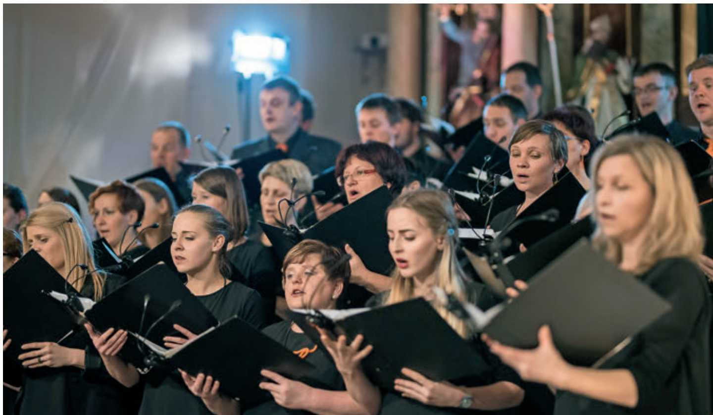
Adoramus je slavnostno počastil svoj jubilej.