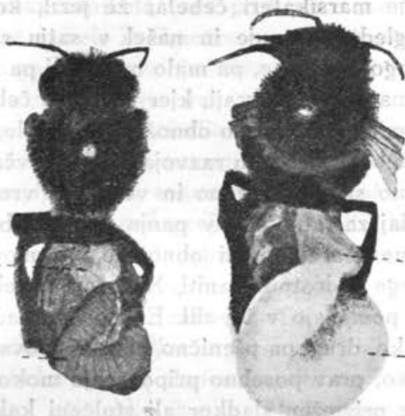
Podoba 2. Zdrava čebela.

Ako čebele ne morejo redno izletavati spričo mraza ali slabega vremena, zapuste bolne gnezdo, lezejo s trepetajočimi krili in z napetim zadkom iz panja ter se popolnoma onemogle zbirajo v večjih ali manjših gručah po tleh ali pa na bradi, dokler ne pomro (podoba 4). Ob lepem vremenu bolni panji živahno izletavajo, a le redka izmed čebel se vrne. Če zvečer tak panj pregledamo, najdemo tam samo