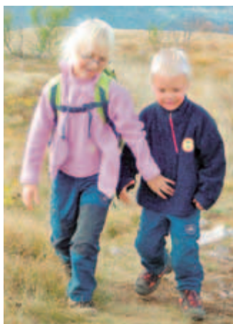
Začelo se je leta 2008 na Slavniku.

kogorje, je nevarna aktivnost in tveganja lahko le zmanjšate, ne morete pa jih v celoti odpraviti. Zato sva se tudi midva z bratcem najprej naučila varnejše hoje v gore. Udeleževala sva se tečajev v okviru Planinskega društva Kamnik in planinskih taborov pri Planinskem društvu Rašica. Poleg tega sva športna plezalca in trenirava športno plezanje na steni v Domu kulture Kamnik, kjer tečaje športnega plezanja za otroke organizira Športno plezalni odsek Kamnik, ki deluje v okviru Planinskega društva Kamnik.