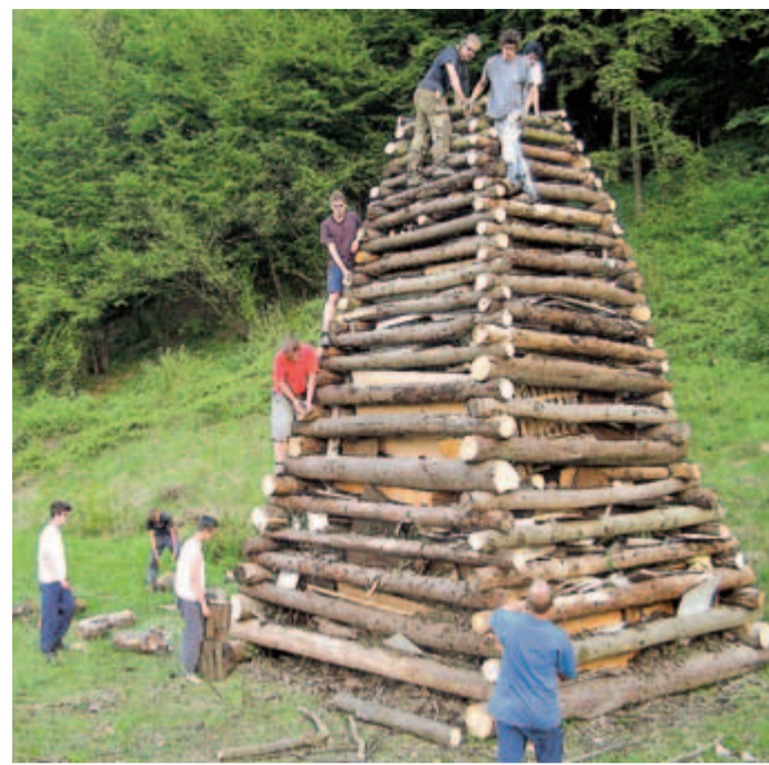
Postavljanje kresa je bil vedno velik dogodek, ki je trajal kar nekaj dni, zadovoljstvo ob pripravi in postavljanju pa neizmerno.