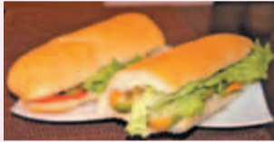
razni sendviči, tudi vegi

Odprto: ponedeljek-sobota od 6h do 21 h, nedelja in prazniki od 8h do 20 h