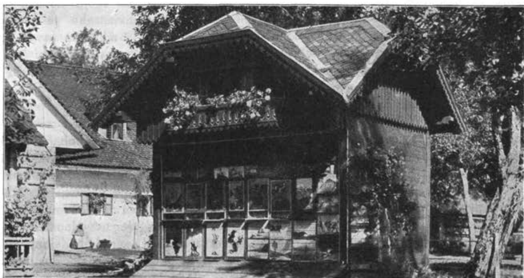
Čebelnjak g. kateheta Pintarja pri Sv. Duhu pri Škofji Loki.

Neuspehi naprednega čebelarstva so ob koncu minulega stoletja pokazali potrebo pouka in prilagoditve panja in ravnanja s čebelami po njih naravi. Ako je