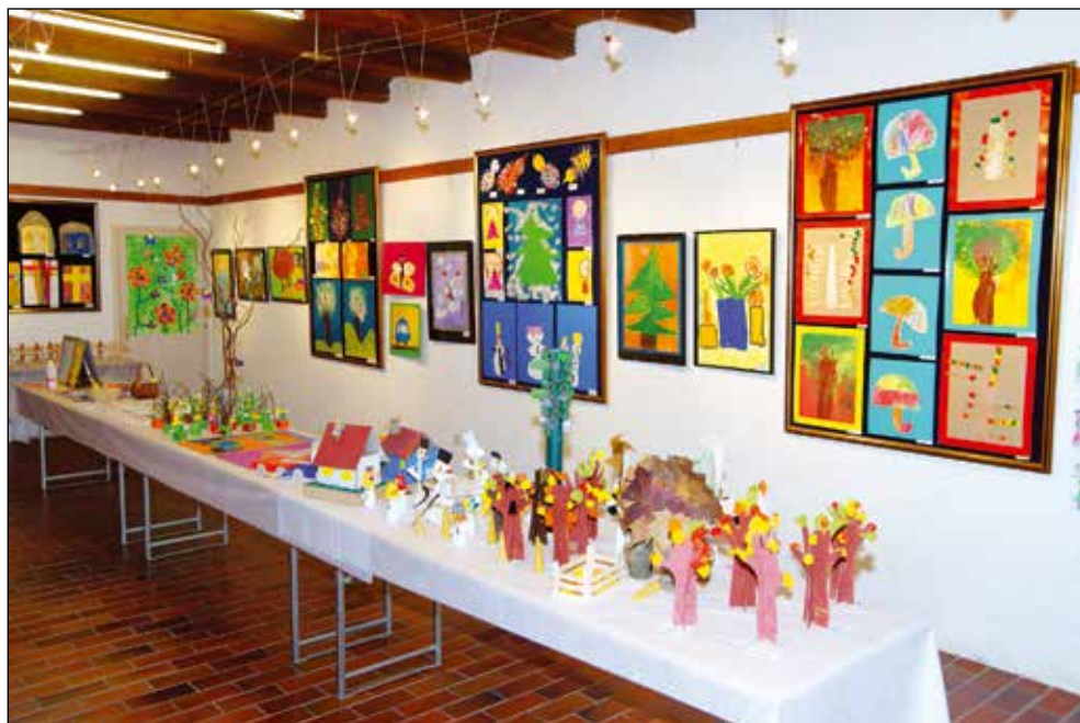
Otroške umetnine, razstava ob 20-letnici Antonovega vrtca, 2015.