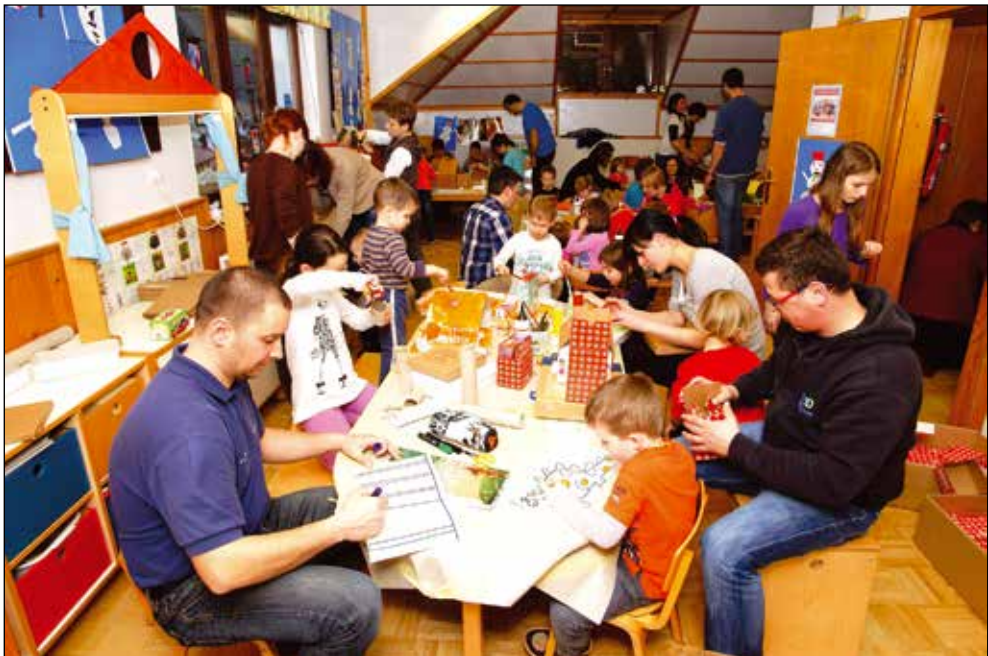
Delavnica izdelovanja gregorčkov, 2015.