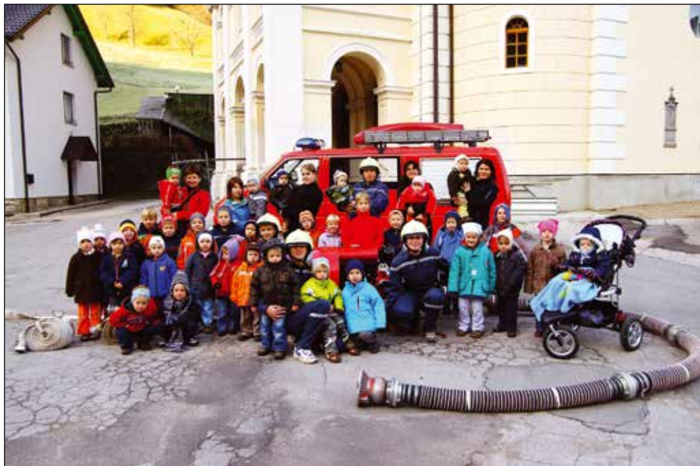
Obisk mamic gasilk z Zalega loga, 2010.