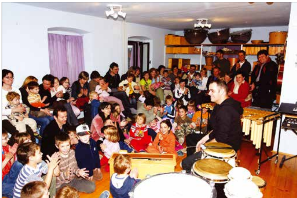
Glasbena delavnica v Groharjevi hiši v Sorici, 2008.