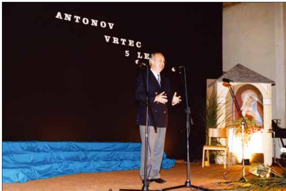
Govornik na 5. obletnici Antonovega vrtca, dr. Andrej Bajuk, predsednik vlade RS, 2000.