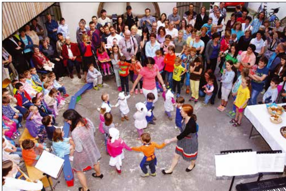
Od jeseni do pomladi, nastop ob otvoritvi razstave, 2015.