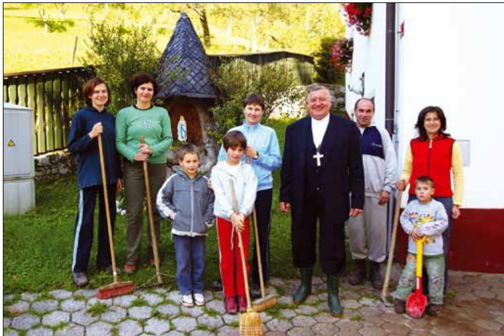
Pomoč pri odstranjevanju posledic poplav, nadškof msgr. Alojzij Uran, 2007.