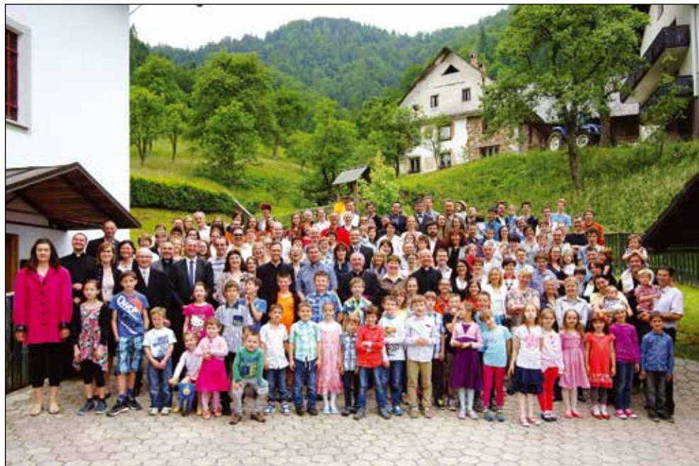
Skupinska fotografija po zahvalni maši, 2015.