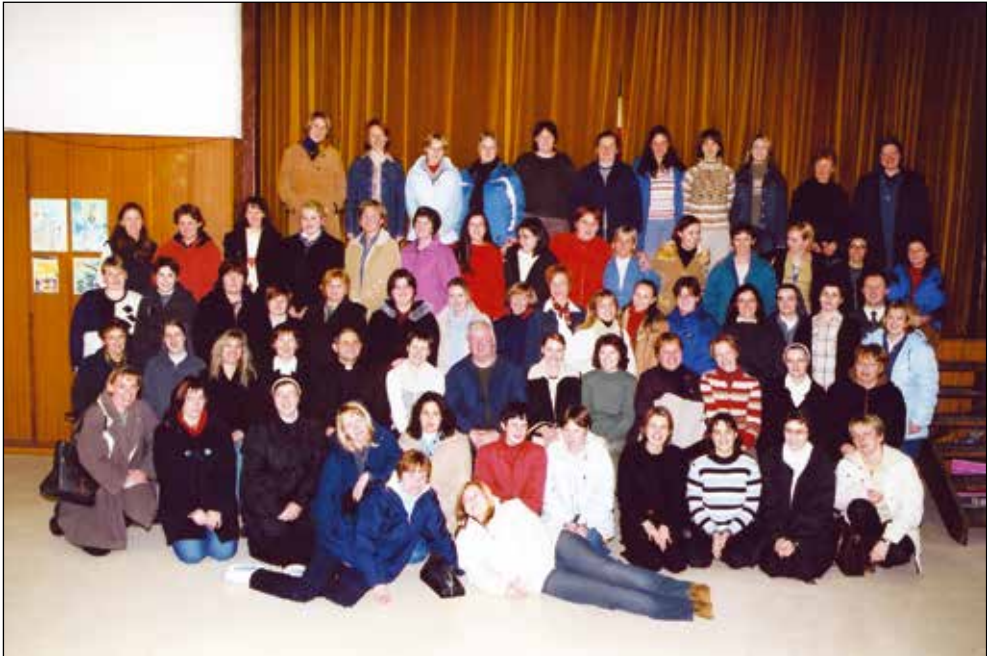
Aktiv vzgojiteljic katoliških vrtcev v Železnikih, 2004.