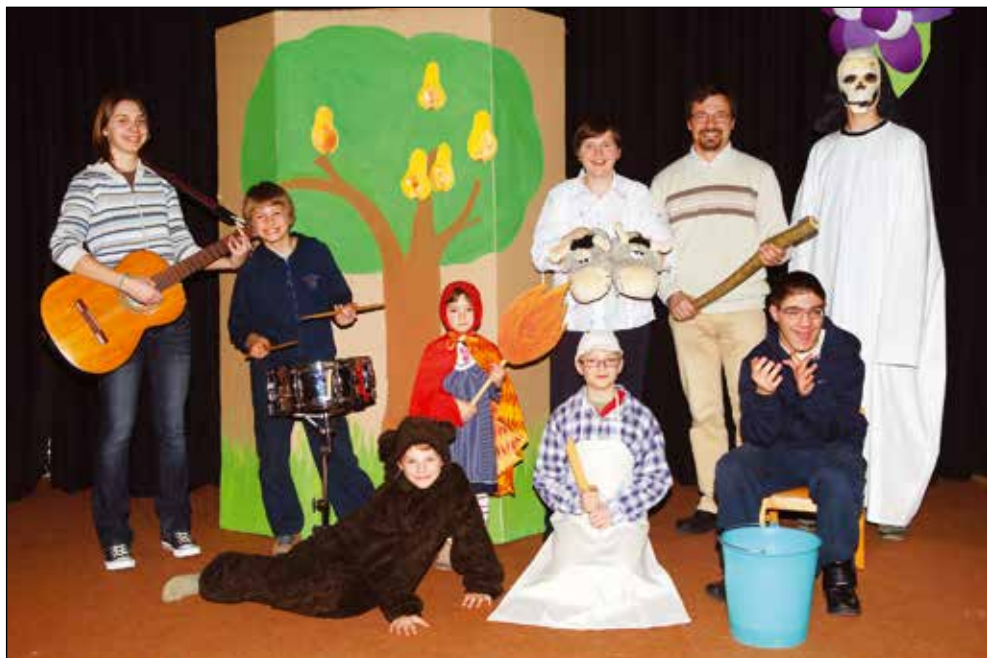
Družina Rovtar 18 let v Antonovem vrtcu.