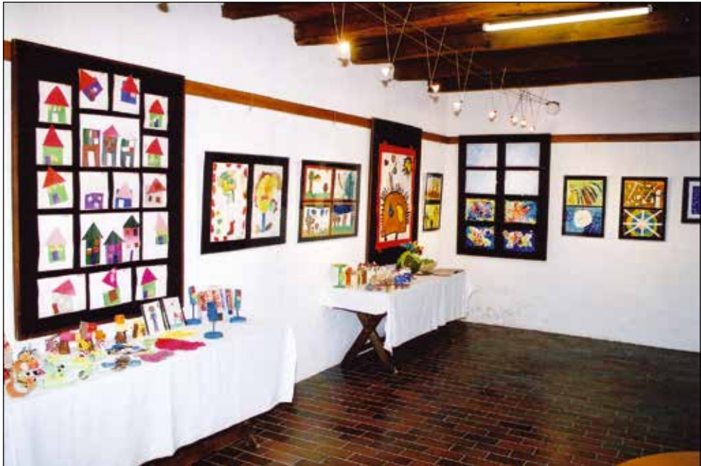
Razstava otroških izdelkov v galeriji Muzeja Železniki, 2005.