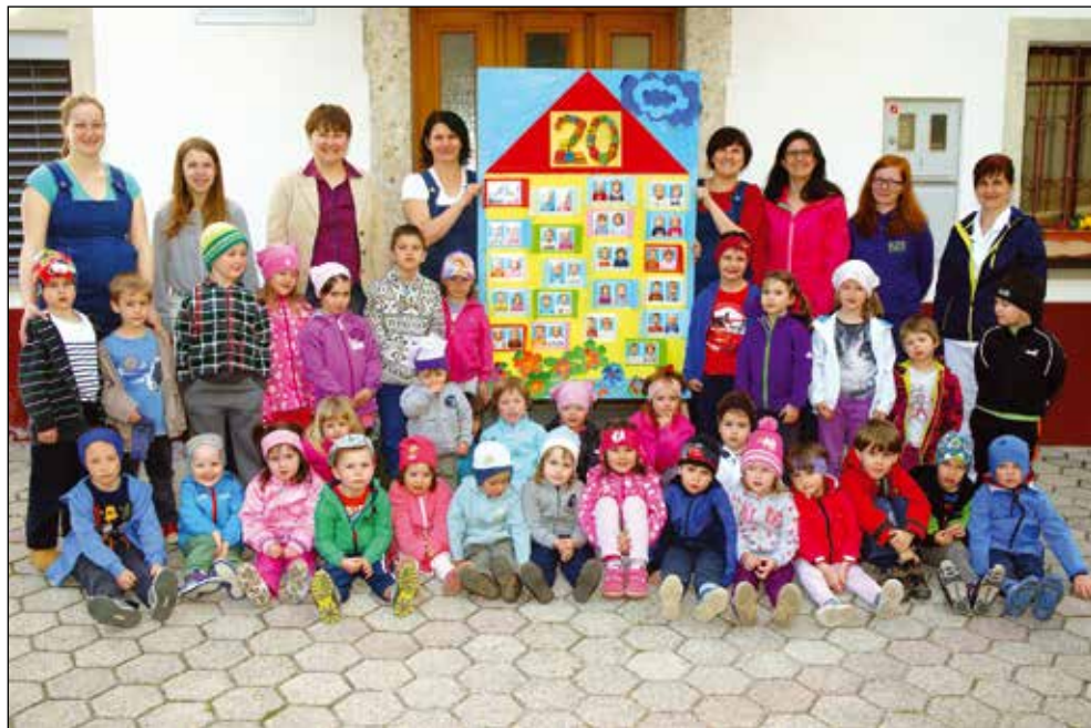
Po dvajsetih letih, 2015.