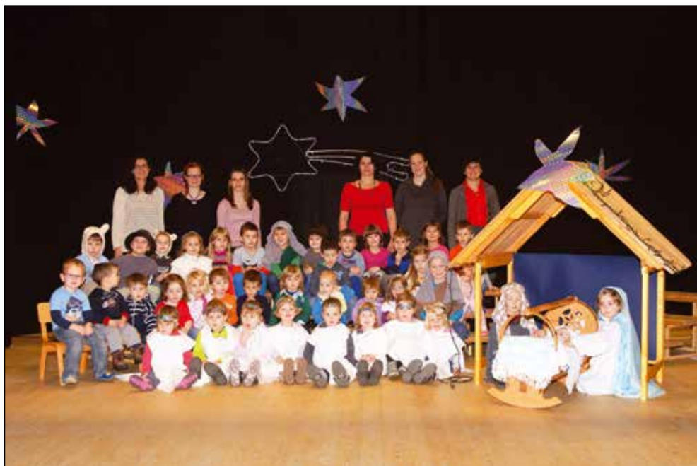
Božičnica na odru Kulturnega doma, 2014.