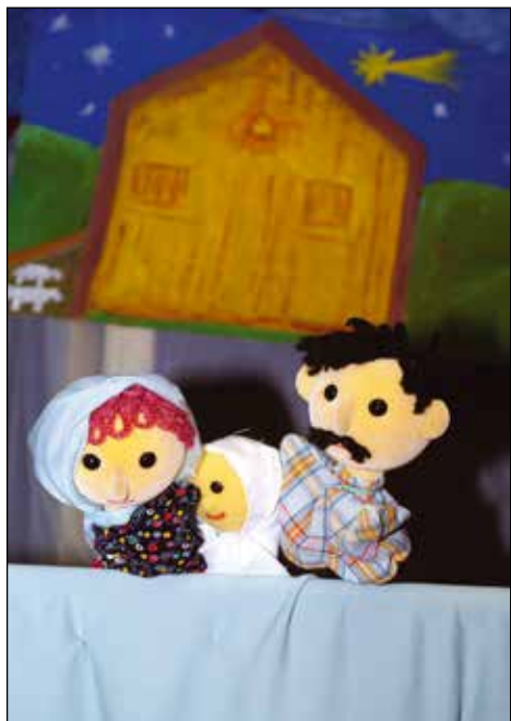
Lutkovna upodobitev božične zgodbe, 2006.