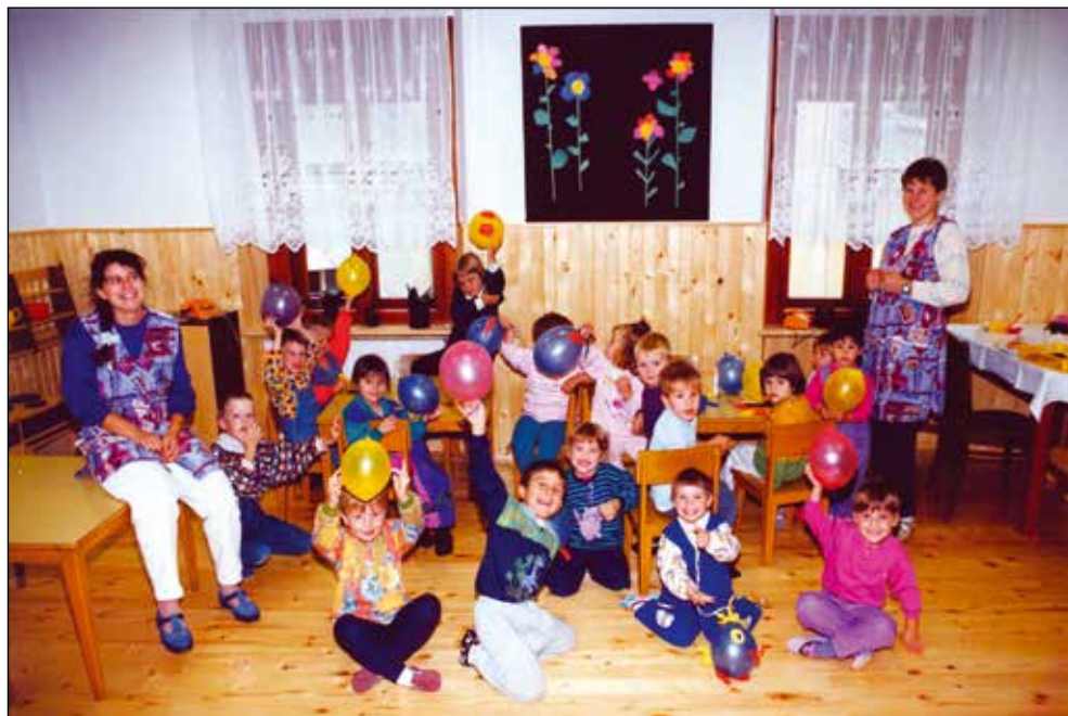
Prvi dan v vrtcu, 1995.