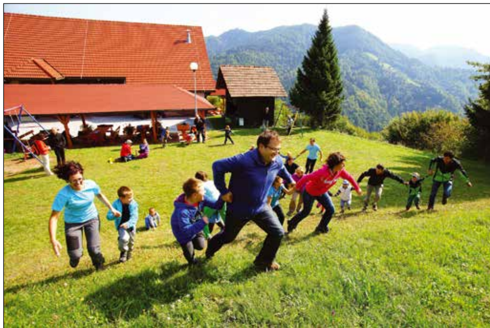
Igra Črni mož na srečanju družin na sv. Andreju, 2012.