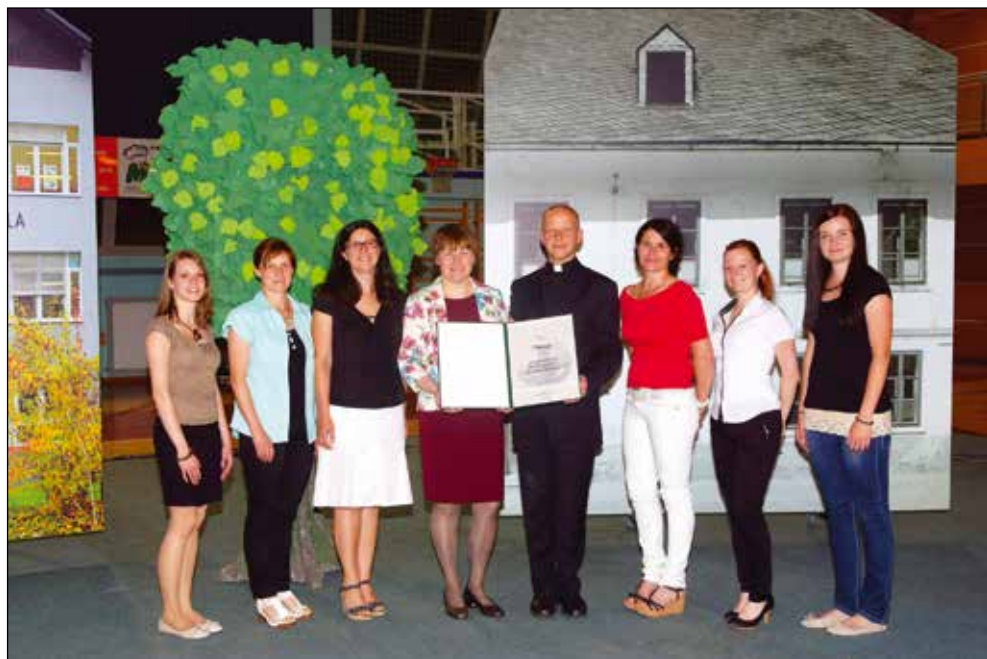
Zaposlene s priznanjem, 2015.