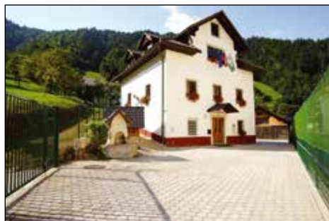
Vrtec danes, 2015.