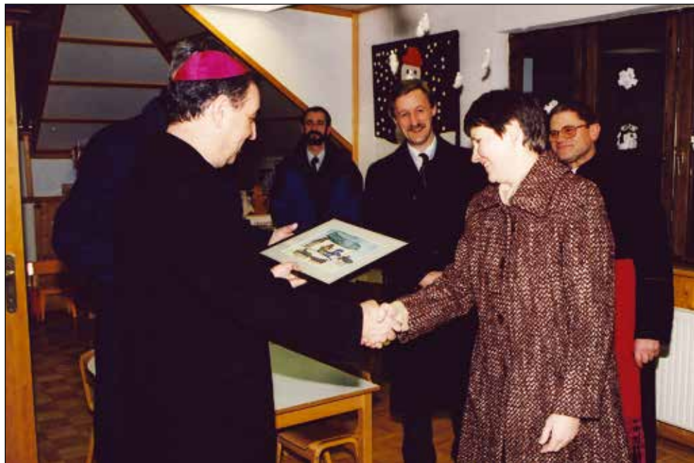
Nuncij msgr. Giuseppe Leanza v vrtcu, 2003.