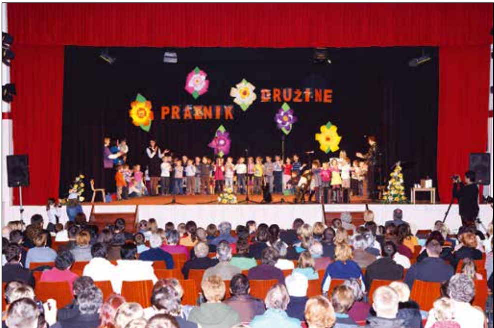
Priveditev Praznik družine v dvorani na Češnjici, 2011.