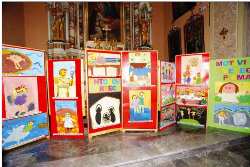
Razstava Svetopisemske zgodbe v cerkvi sv. Antona, 2014.