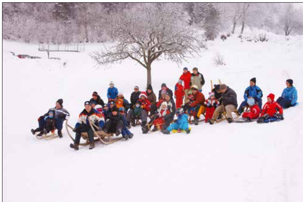
Družinsko sankanje v Dražgošah, 2013.