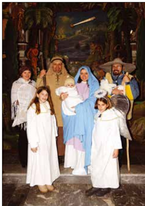
Sveta družina, 2012.