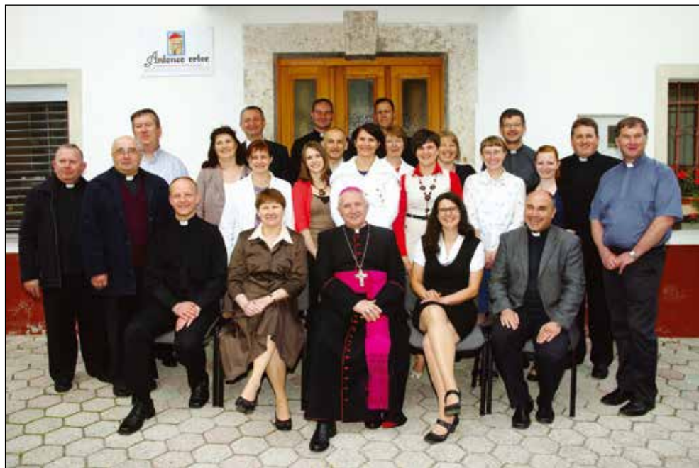
Fotografija z nadškofom msgr. Stanislavom Zoretom, 2015.