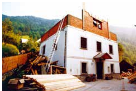
Brez strehe ob prenovi, 1996.