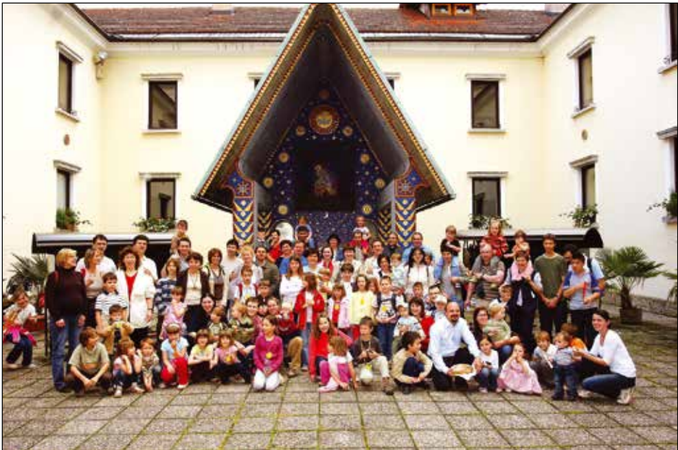
Srečanje družin katoliških vrtcev na Brezjah, 2008.