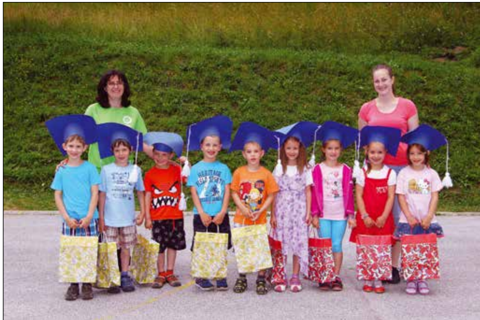
Mali maturantje, 2014.