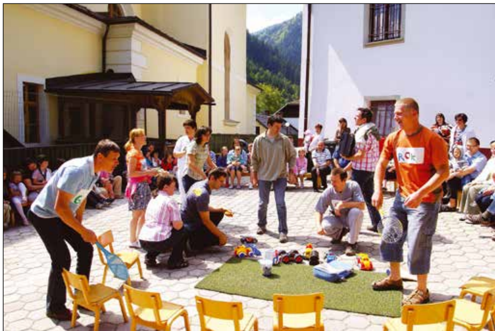
Vsakoletna igra staršev za otroke, 2009.