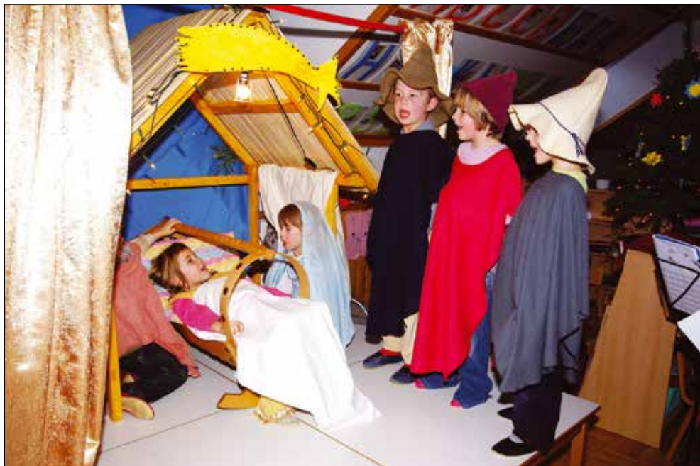
Pastirci pred hlevčkom, 2007.