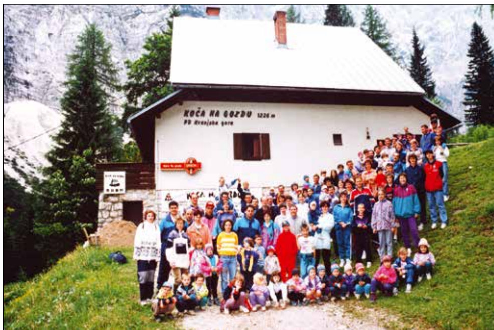
Letovanja v Koči na Gozdu, Vršič, 1997.