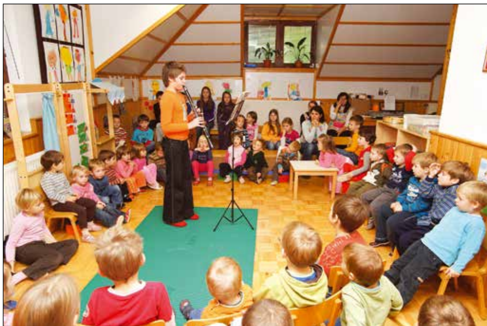
Bivši vrtičkarji na obisku v vrtcu, 2010.