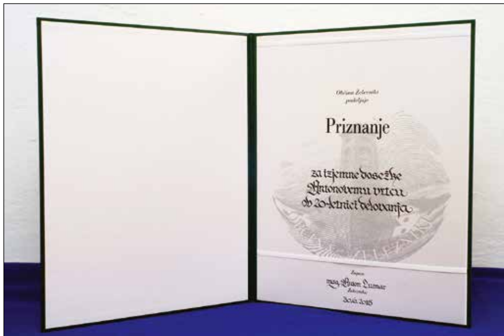
Priznanje občine za izjemne dosežke, 2015.