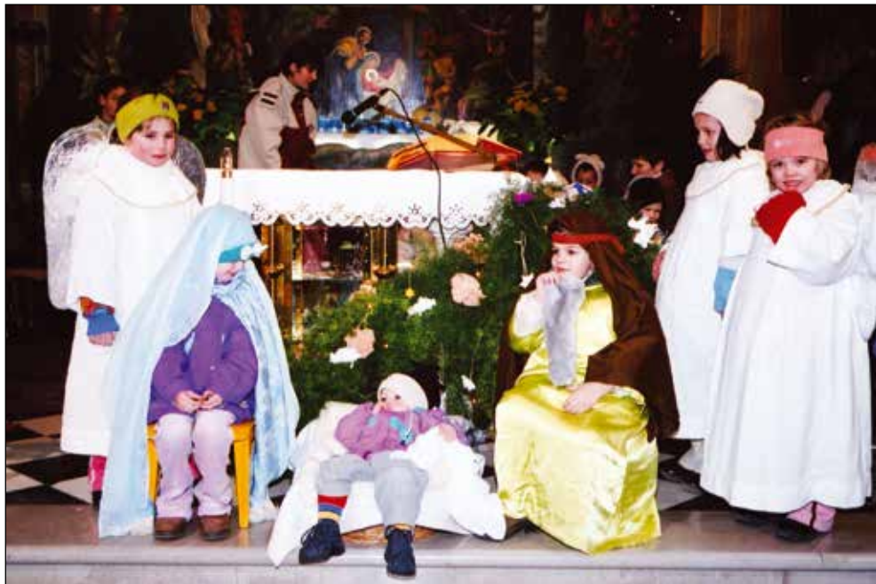
Žive jaslice v cerkvi sv. Antona, 2004.