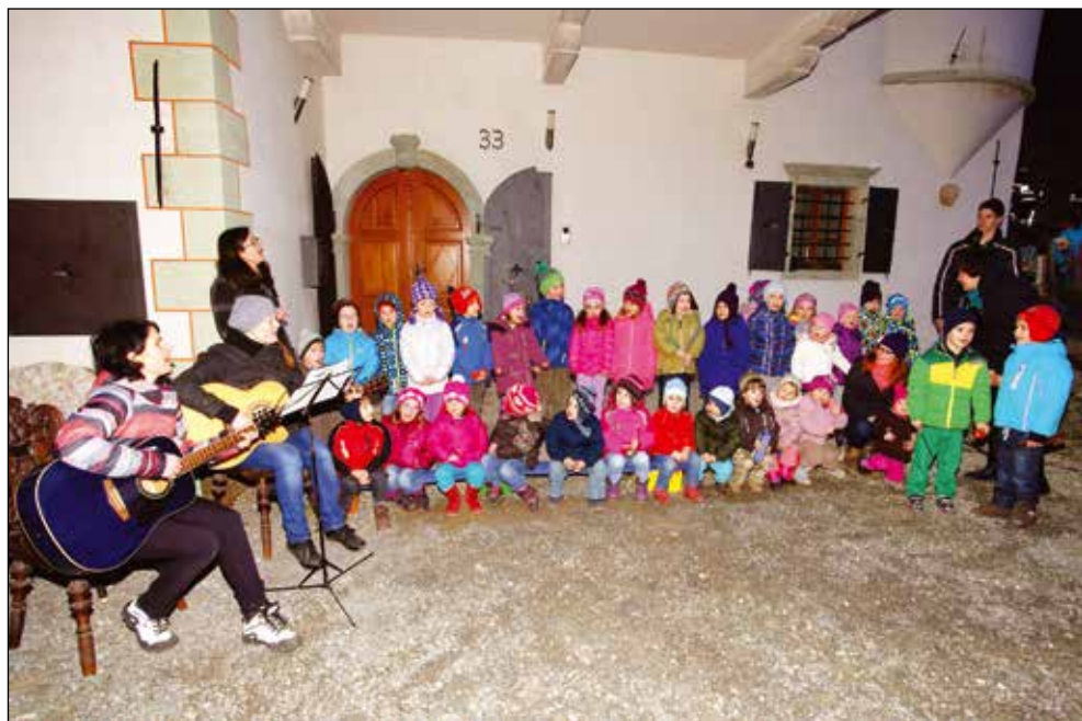
Nastop na prireditvi Luč v vodo, 2015.