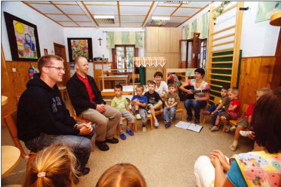
Obisk duhovnikov, 2011.