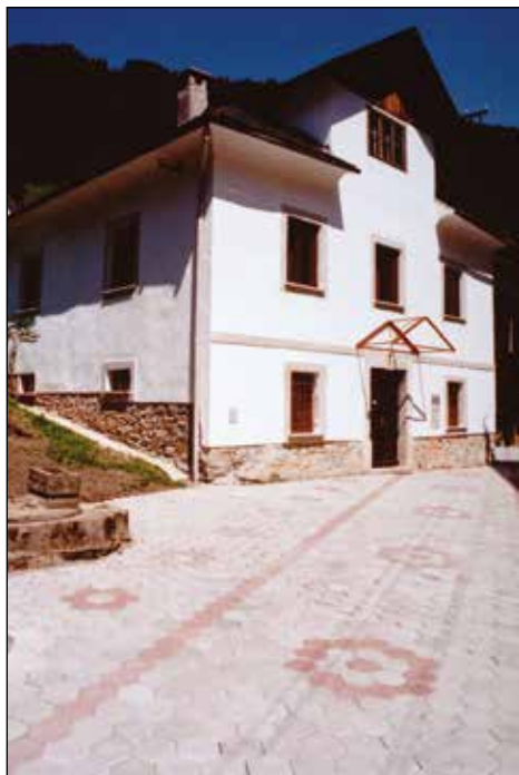
Antonov vrtec leta 1995.