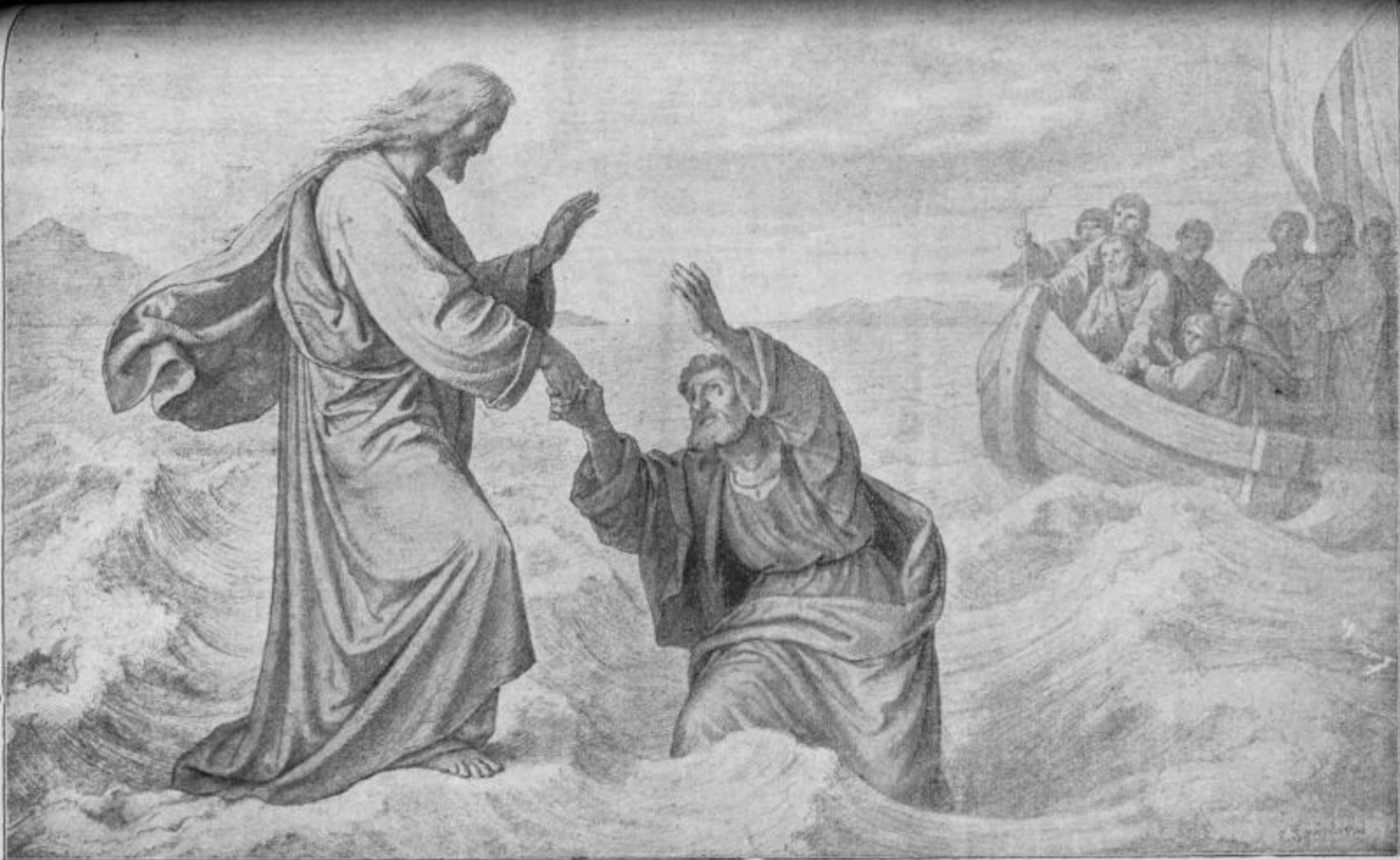
Jezuš reši sv. Petra.