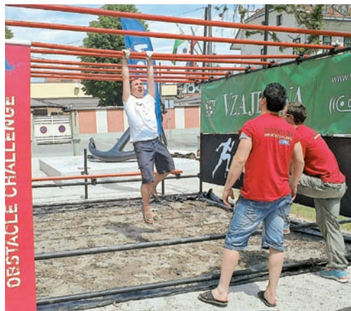
Predstavitve oviratlonca na teku trojk minulo soboto na Kongresnem trgu v Ljubljani.

Prijaviš se lahko na spletni strani www.oviratlon.si , prijava pa bo možna tudi na dan dogodka. Prijavnina ob prijavi in plačilu do vključno 10. junija 2012 znaša 16 EUR, za prijave in plačila od 11. do vključno 15. junija pa 20 EUR. Prijavnina na dan dogodka bo 25 EUR. Prijaviš se lahko v eni izmed treh kategorij: posamezniki, ekipe ali naključna skupina.