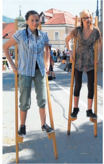
Dijakinje ŠCRM Kamnik so predstavile igre, s katerimi so si otroci nekaj krajšali čas, med njimi tudi hojo s hoduljami.

Na odru pri parku Evropa so nastopile pevske, plesne,