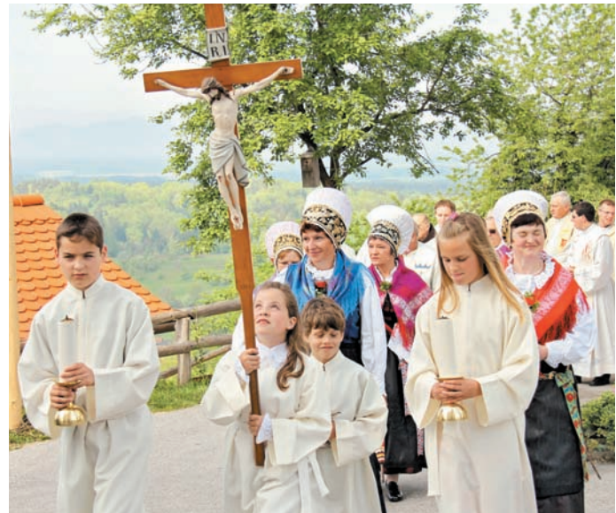
Slovesen sprevod pred cerkvijo sv. Ane v Tunjicah – krajanke v narodnih nošah in duhovniki skupaj z ministranti.

Besedilo in fotografije: Barbara Klanšek