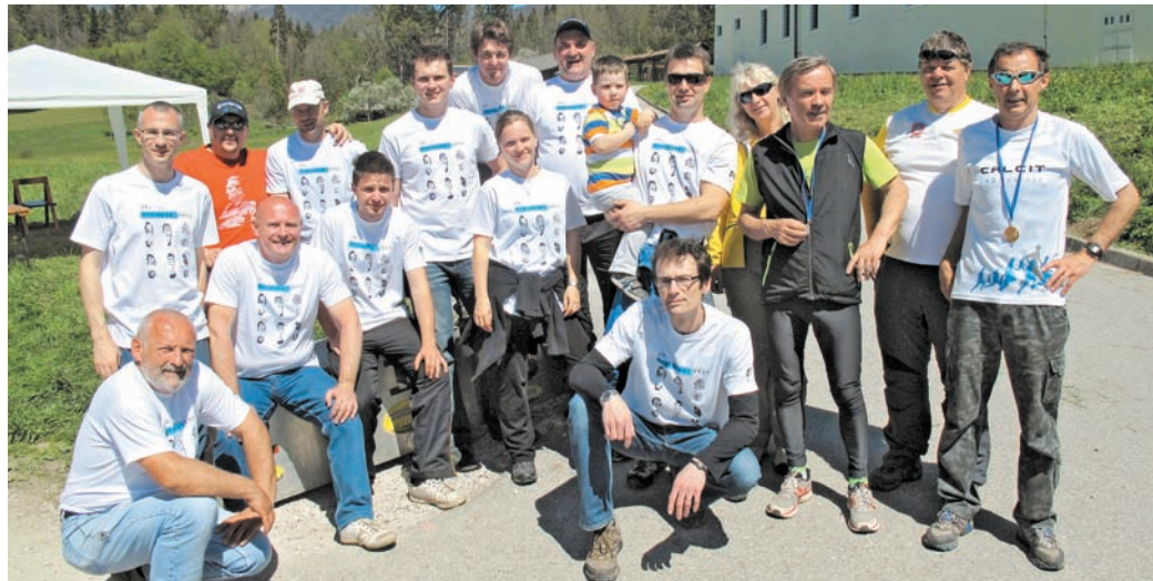
Ekipa organizatorjev zadovoljna ob uspešno zaključenem tekaškem dogodku.