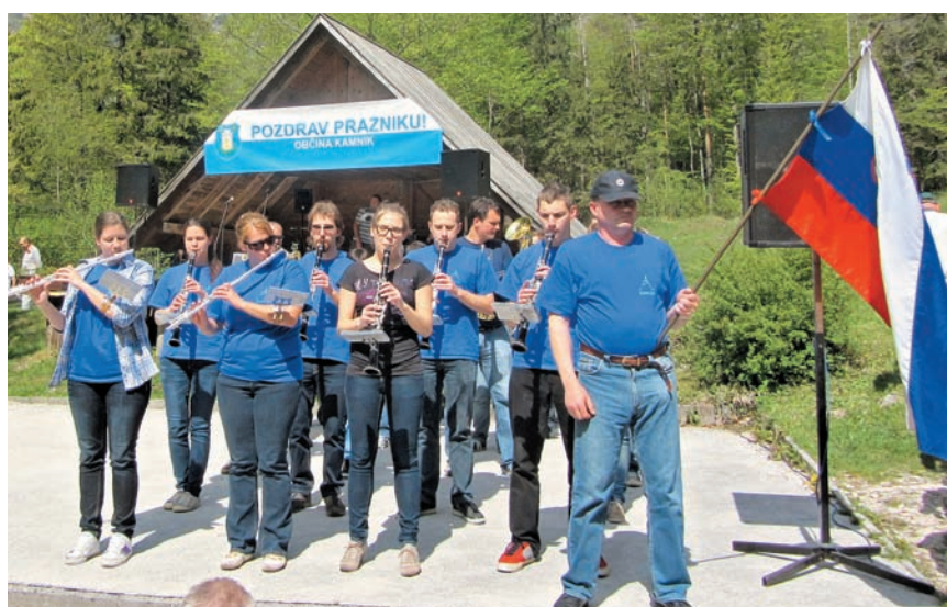
Prvomajsko dogajanje v občini Kamnik se je začelo že ob pol četrti uri zjutraj, ko je Mestna godba Kamnik s tradicionalno prvomajsko budnico krenila z Glavnega trga v Kamniku in pot nadaljevala proti Duplici, Šmarci, Podgorju, Volčjemu Potoku, Tunjicam, Mekinjam, Motniku, Špitaliču, Zgornjemu Tuhinju, Pšajnovici, Vrhpolju, Godiču in jo sklenila ob 11. uri na prizorišču osrednje tradicionalne prireditve ob mednarodnem dnevu delavstva v Kamniški Bistrici.

Domu v Kamniški Bistrici pozdravil zbrano množico udeležencev in jim, kljub težkim časom, zaželel veselo praznovanje 1. maja, praznika dela. Poudaril je, da je potrebno spoštovati tako delavke in delavce, kot tudi njihove pravice do dela. »Vsi skupaj moramo biti optimistični