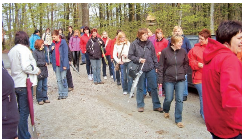
Gasilke pred Zdravilnim gajem v Tunjicah.

po pregledu preteklega dela gasilk podala še nekaj statističnih podatkov o članicah. Izrazila je zadovoljstvo, da je bil odziv na