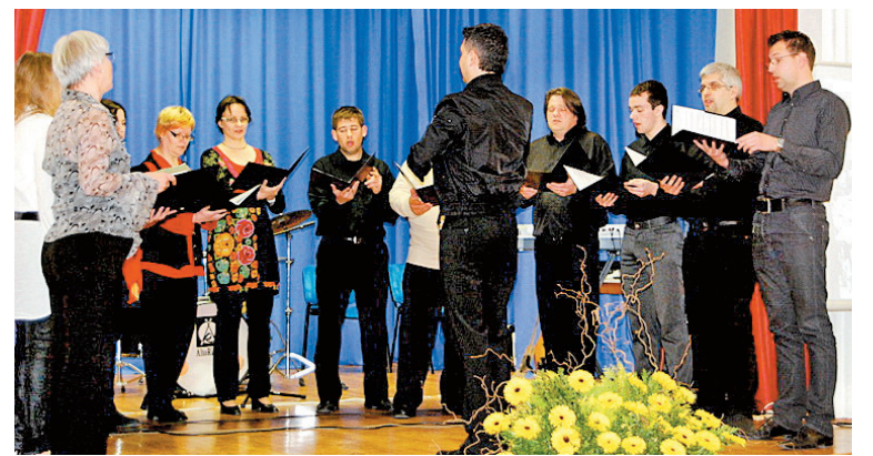
Organizatorji koncerta Komorni pevski zbor Šutna.

Pripis: V primeru, da se prireditve niste mogli udeležiti, bi pa radi sodelovali pri zbiranju sredstev za sedem otrok, se lahko obrnete na tajništvo Zavoda CIRIUS Kamnik in se dogovorite za donacijo. Otroci odidejo v šolo v naravi 4. junija. KPZ Šutna