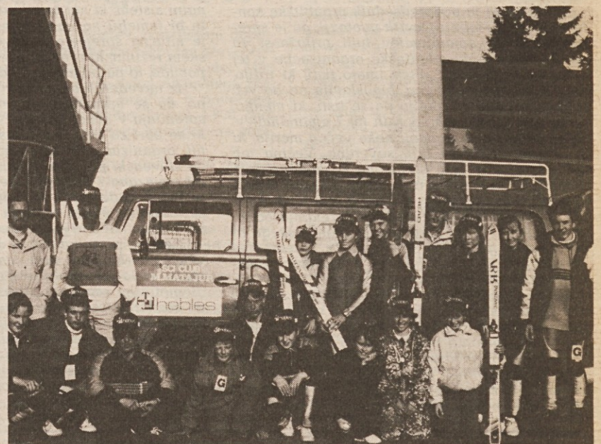
Skupina mladih smučarjev društva Monte Matajur