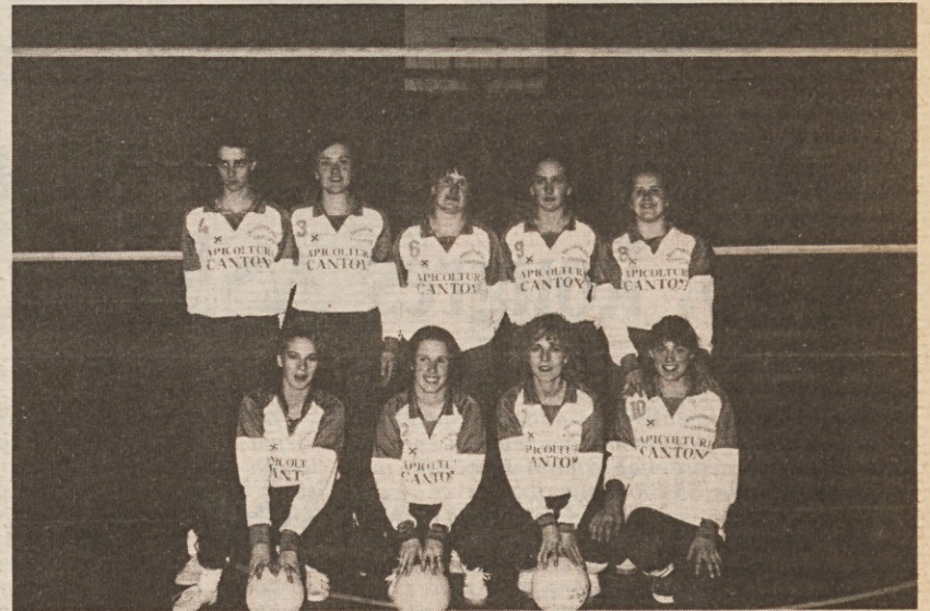
Ženska odbojarska postava iz Šlenarta