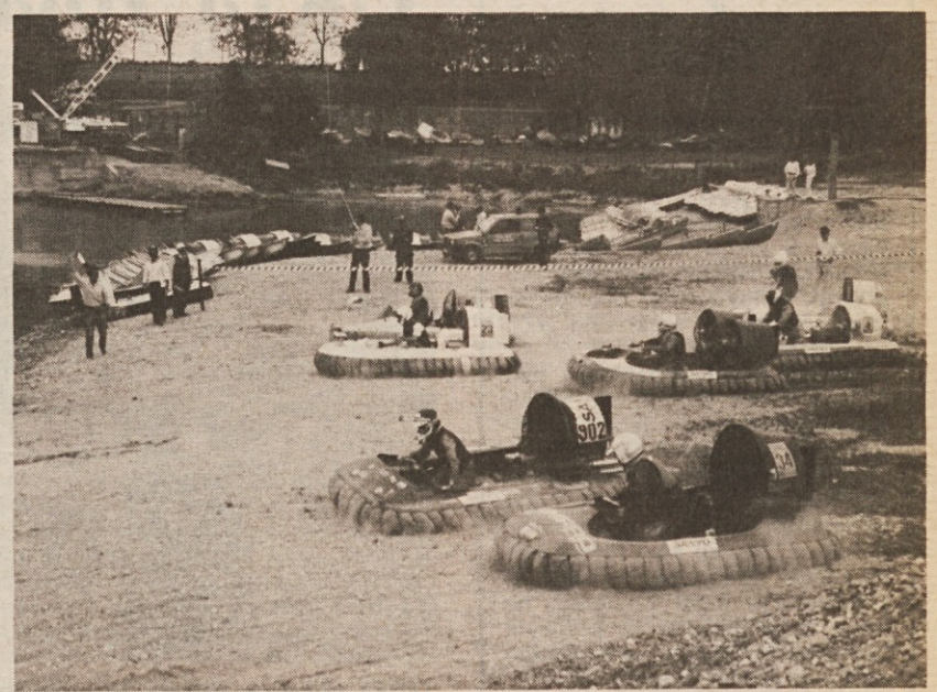
Hovercraft ima v Benečiji precej privrženecv