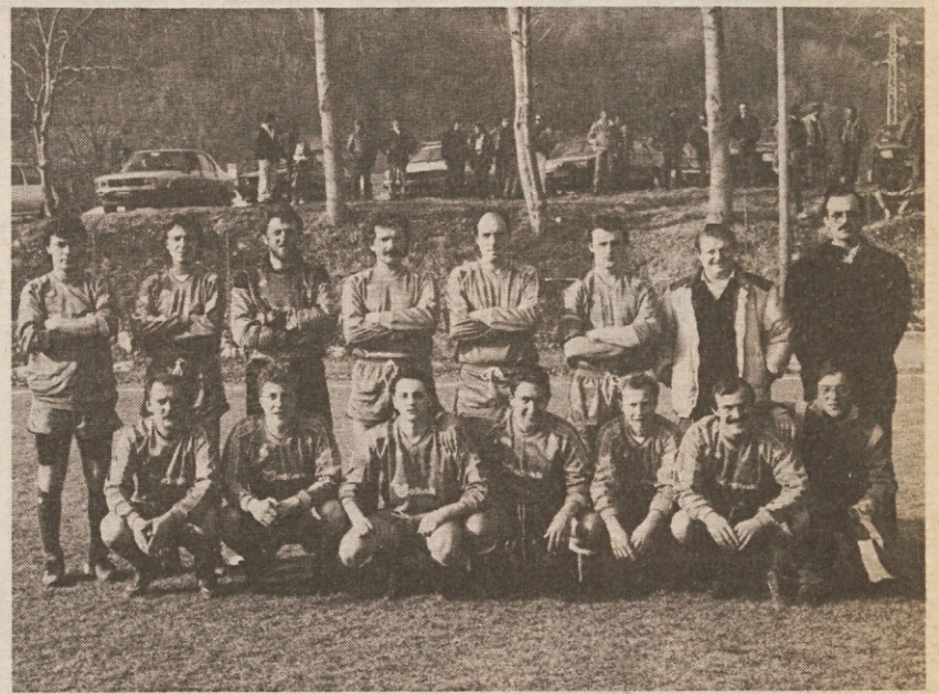
Postava Savogneseja, ki nastopa v 3. AL

Med pomembnejšimi manifestacijami, ki se odvijajo v Benečiji, smo že omenili nogometni turir v Ljesah. Temu bi dodali še kolesarsko dirko po beneških dolinah za vse kategorije ter konjsko kros tekmovalje. Seveda je ob tem še več drugih pobud in zanimivih prireditev, ki odločno prispevajo, da se tudi v beneških dolinah športna dejavnost nenehno razvija in prispeva k rasti slovenskega človeka. (Petra)