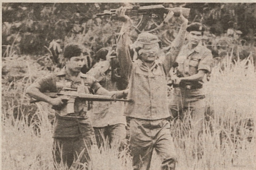
Tajska obmejna patrila je ujela dva kamboška vladna vojaka, ki sta po lastnih besedah na Tajsko pribežala iz notranjosti Kambodže (Telefoto AP)