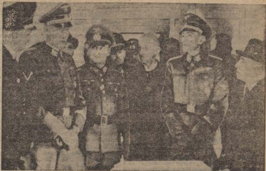
Lazarettzug als Geburtstagsgeschenk für den Führer. In den Mittagsstunden des 20. April 1942 übergab Staatspräsident Hacha dem stellvertretenden Reichsprotektor, SS-Obergruppenführer Heydrich, einen vollständig eingerichteten 400 Meter langen Lazarettzug als Geburtstagsgeschenk für den Führer. — Unser Bild zeigt links den stellvertretenden Reichsprotektor, SS-Obergruppenführer Heydrich, rechts Staatspräsident Hacha und Staatssekretär Frank im Innern des Operationswagens des Lazarettzuges

Ce je Anglija v takratni dobi najtežjih vojaških kriz zaprosila pomoč z obljubami, ki jih od vsega početka ni nameravala držati, je bilo jasno, da bodo ogoljufanci nekega dne zahtevali izpolnitev obljub. Dajali so torej menice, ki jih bodo morali prej ali slej vnovčiti. Indijski in arabski svet sta si dobro zapomnila obljube, s ka-